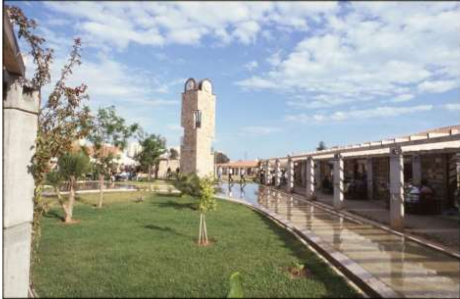
Resim 9 Su Kanalı ve Saat Kulesi, Olbia Sosyal Merkezi, Antalya (Bektaş, C., Salt Araştırma Arşiv) Url-1