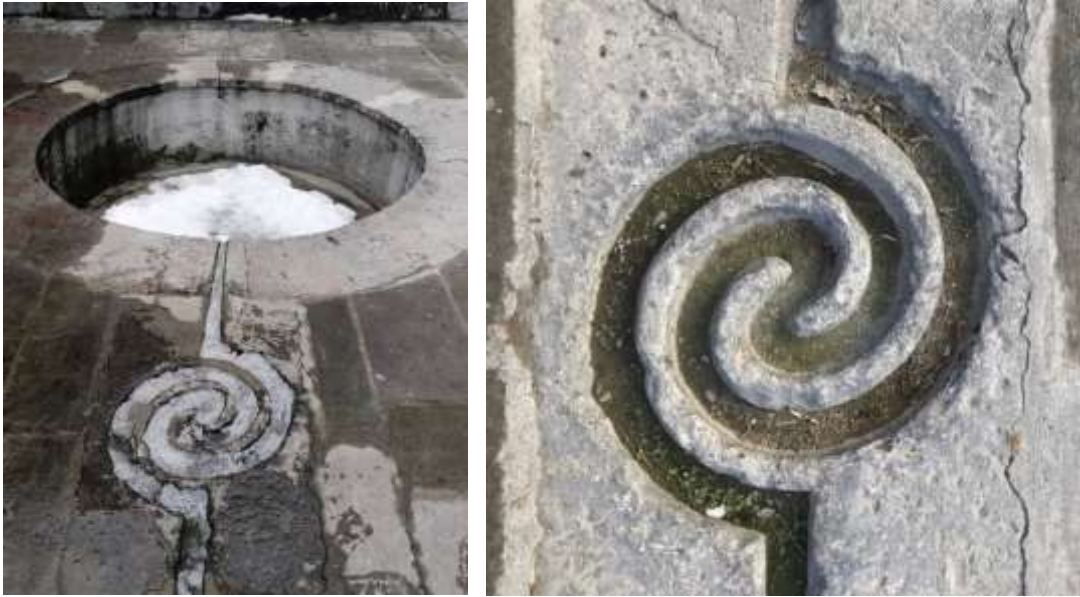
Resim 1 ve Resim 2 Çöpür Taşı, Güpgüpoğlu Konağı, Kayseri (Url-5)

natında görülen bir özelliktir. Artuklu ve Akkoyunlu yapılarında eyvanlar içinde çeşmeden kademeli biçimde akıtılarak sular değişik oyunlu yollarla havuzlara doldurulurdu. Aynı gelenek; Divriği Darüşşifası havuzunda, Konya İnce Minareli Medrese, Mardin Zinciriye ve Kasımiye Medreseleri havuzunda, Kayseri Güpgüpoğlu Konağı'nda (Resim 1 ve Resim 2), Sivas Numan Efendi Kütüphanesi'nde (Resim 3), görüldüğü gibi Selçuklu ve Osmanlılarda da karşımıza çıkar. İçerisinde dere veya çay akan şehirlerin bazılarında sular küçük arklarla avlu, bağ ve bahçe içerisinden geçirilirdi. Evlerin avlularından geçirilen sular değişik kademelenme ile akıtılırdı. Bu kademelerin her birine muhtelif delikli taşlar konularak sular bunların içinden geçirilirdi. Taşların delikleri ses çıkartması için dışarıda bırakılarak bu deliklerden geçen sular her kademedede farklı ses çıkartarak bir melodi oluştururdu (Acun, 2010, s. 10).