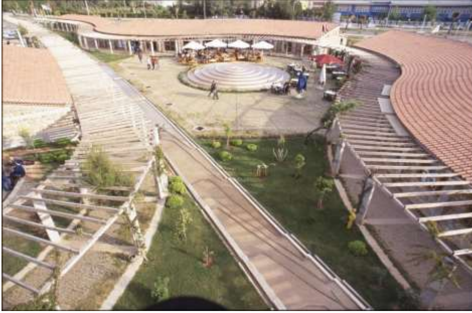
Resim 8 Su Kanalı ve Dönerce Havuz, Olbia Sosyal Merkezi, Antalya (Bektaş, C., Salt Araştırma Arşiv) Url-1