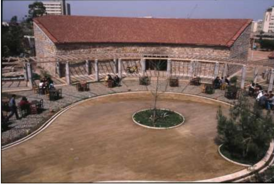
Resim 10 Sığ Havuz ve Çınar Ağacı, Olbia Sosyal Merkezi, Antalya (Bektaş, C., Salt Araştırma Arşiv) Url-1

lere gölge veren bir gelecek teması da düşünülebilir. Bu havuz aynı zamanda su kanalına bağlanarak merkez içinde bir nokta görevi de üstlenmektedir. Sığ havuz, sakinliği ve durgunluğu anlatırken diğer tarafta kanala bağlanmayan dönerce havuz hareketi ve enerjiyi vurguluyor olabilir (Resim 11).