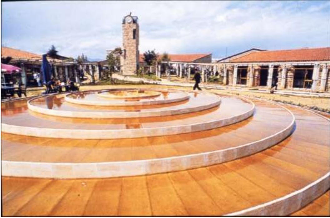
Resim 5 Dönerce Havuz ve Saat Kulesi, Olbia Sosyal Merkezi, Antalya (Bektaş, C., Salt Araştırma Arşiv) Url-1