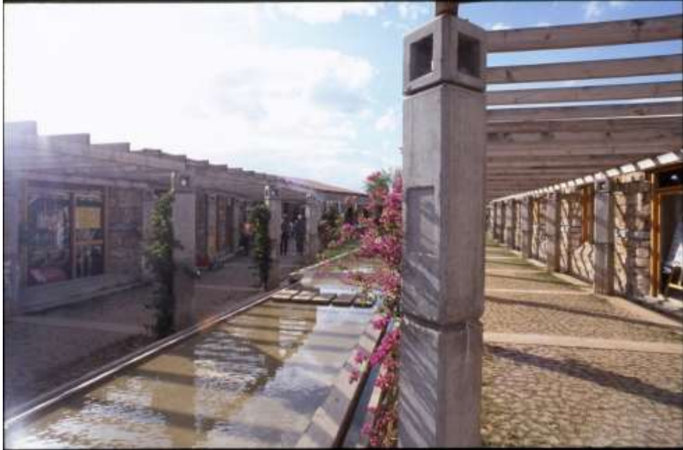
Resim 7 Su Kanalı, Olbia Sosyal Merkezi, Antalya (Bektaş, C., Salt Araştırma Arşiv) Url-1