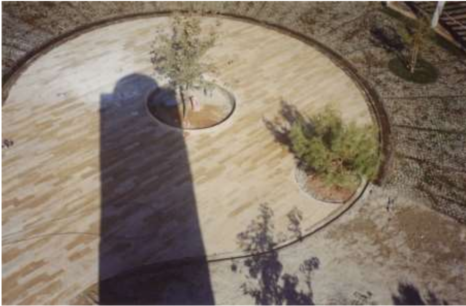
Resim 11 Sığ Havuz ve Çınar Ağacı, Olbia Sosyal Merkezi, Antalya (Bektaş, C., Salt Araştırma Arşiv) Url-1