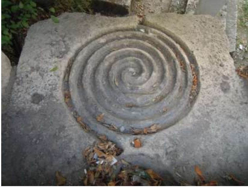
Resim 3 Çöpür Taşı, Numan Efendi Kütüphanesi, Sivas (Url-6)

Bektaş'ın çöpür taşından yola çıkararak yapmış olduğu çeşitlemelerden biri olan ve 7 kottan oluşan su ögesi burada görülmektedir (Resim 4). Katman olarak 7 adet kotun kullanılmasındaki amaç sanatın 7 kolu olmasından kaynaklanıyor olabilir. Buradaki su ögesi tasarımında, suyun travertenlerden akışı ile doğacak doğal bir müzik kaynağı sesi bekleniyor olabilir (Resim 5).