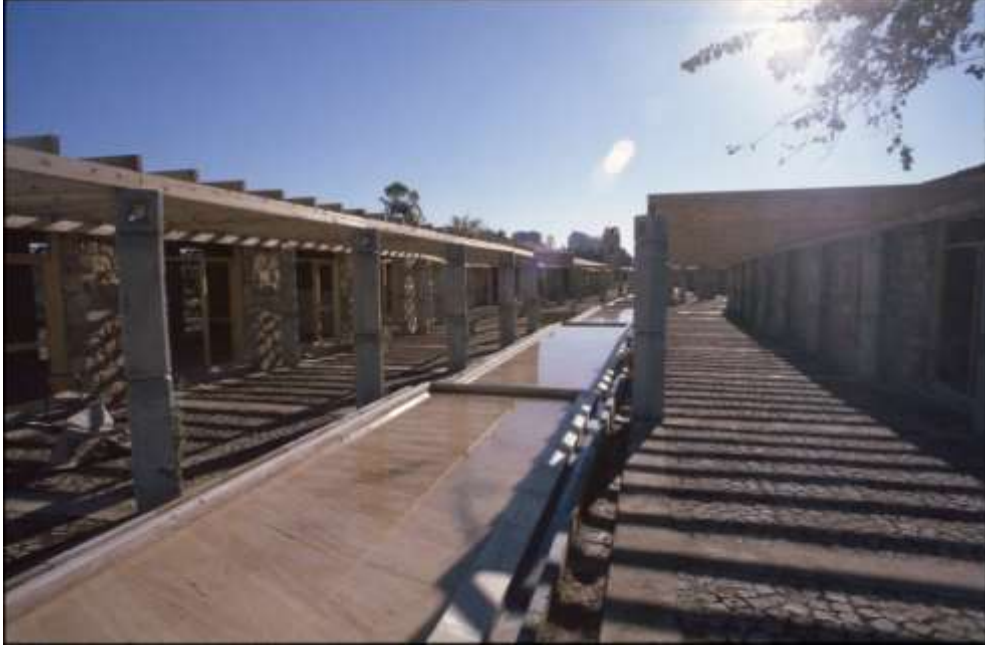
Resim 6 Su Kanalı, Olbia Sosyal Merkezi, Antalya (Bektaş, C., Salt Araştırma Arşiv) Url-1