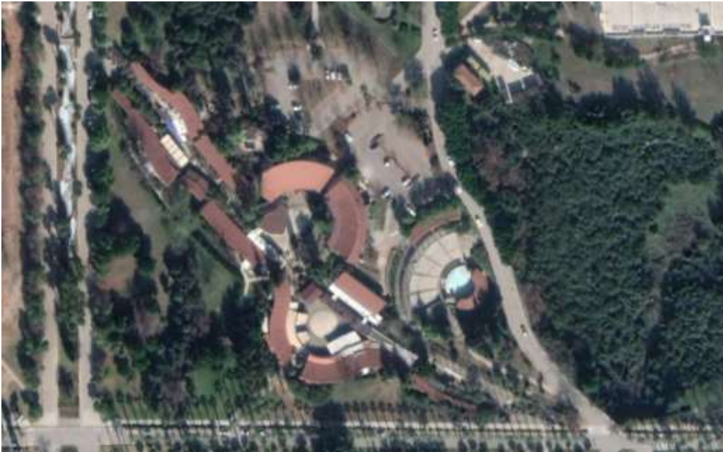
Resim 4 Dönerce Havuz, Olbia Sosyal Merkezi, Antalya (Url-8)

Bektaş'ın çöpür taşından yola çıkararak yapmış olduğu çeşitlemelerden biri olan ve 7 kottan oluşan su ögesi burada görülmektedir (Resim 4). Katman olarak 7 adet kotun kullanılmasındaki amaç sanatın 7 kolu olmasından kaynaklanıyor olabilir. Buradaki su ögesi tasarımında, suyun travertenlerden akışı ile doğacak doğal bir müzik kaynağı sesi bekleniyor olabilir (Resim 5).