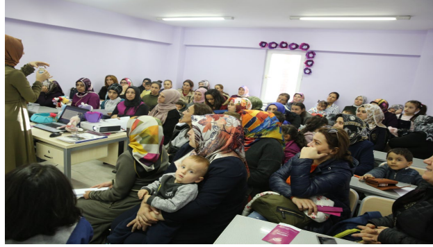
Şekil 1. Şehir Benim Projesi, Beceri Geliştirme (Kokulu Mum Yapımı) dersi katılımcıları.

doğrultusunda belirlediği; kokulu mum yapımı, pon pon yapımı, amigurumi oyuncak bebek yapımı, oyun hamuru yapımı gibi beceri geliştirme eğitimlerini de uygulamıştır.