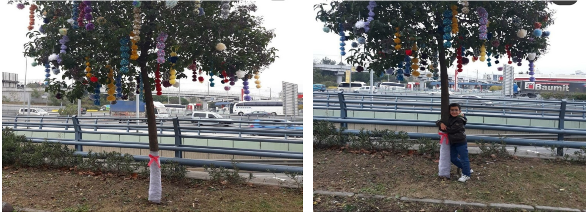
Şekil 7-8. Katılımcılarla Yavuz Selim Parkı'nda ponponlarla ağaç süsleme etkinliği.

Proje katılımcısı kadınlar ile aradan geçen 2 yılın ardından, bir anket yapılmıştır. Bu anket ile genel olarak, proje öncesi ve sonrası yaşadıkları sokak, mahalle ve ilçeye olan sahiplenme ve âdiyet duygularındaki değişim, kamusal alan kullanımları ve kentsel kimlik gelişimleri ile ilgili değerlendirme yapımları istenmiştir. Anket soruları ve cevapları, aşağıda yer almaktadır.