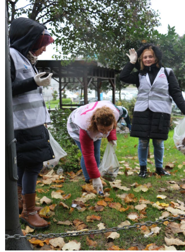
Şekil 4-5-6. Şehir Benim Projesi katılımcılarıyla, Yavuz Selim Mahallesi'nde merdiven boyama etkinliği.

Yavuz Selim Parkı içerisinde bulunan bir ağaç, katılımcı kadınlar ve çocukların birlikte yaptıkları, el emeği ponponlarla, süslenmiştir. Süsleme bittikten sonra her bir katılımcı ağaç ile resimler çekilerek bu anıyı saklamak istemiştir.