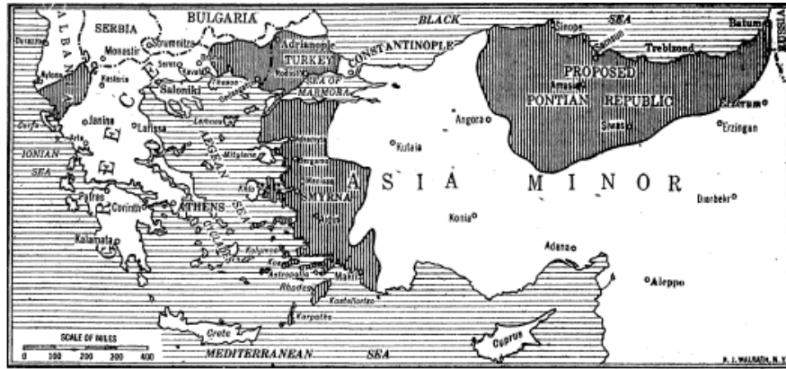
GREEK MAJOR AND MINOR CLAIMS AT PARIS—Showing the Proposed Pontian Republic and the Territory Sought in Asia Minor and Europe.