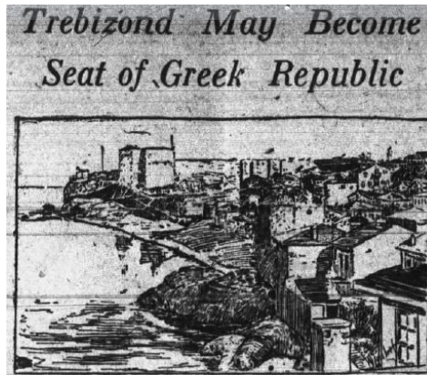
Ek 5. Daily Arcansas Gazette, 29 Nisan,1919

Araştırmacıların Katkı Oranı Beyanı: Yazarlar makaleye eşit oranda katkı sağlamış olduklarını beyan eder.