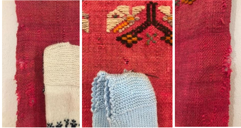
Şekil 9: Örnek 2’de görülen bozulmalar (Arin, 2021).