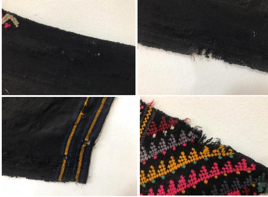
Şekil 7: Örnek 1’de görülen bozulmalar (Arin, 2021).