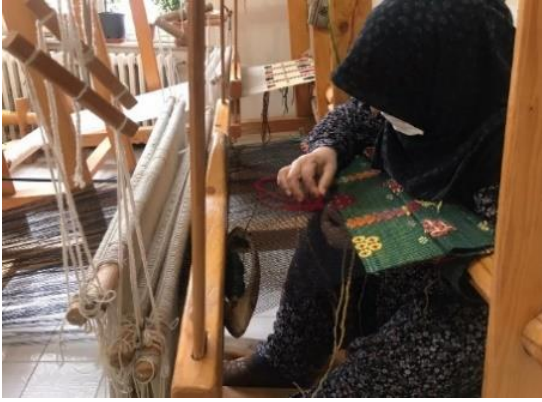
Şekil 2: Dokumada desen oluşturma (Arin, 2021).