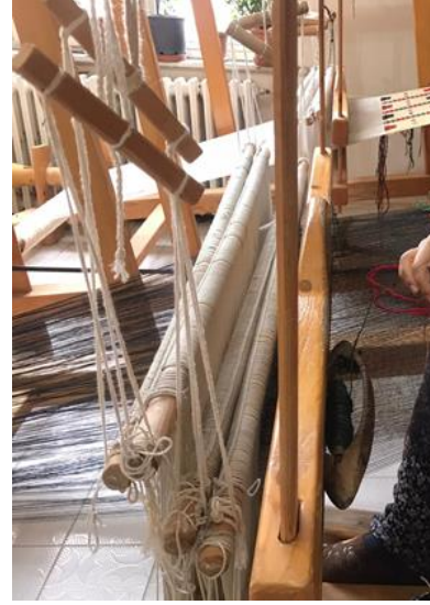
Şekil 1: Dört gücü çerçevli dokuma tezgâhı (Arin, 2021).

Cicim, bezayağı dokuma veya atkı yüzü dokumada zemin atkı iplikleri arasına renkli desen iplikleri sıkıştırılarak, dokuma yüzeyinde kabartma desenler oluşturan bir dokuma tekniğidir. Yörede yapılan dokumalarda ise bu işlem çözgü ipliklerinin üzerine dimi dokuma yapılırken, uygulanacak motifin durumuna göre renkli desen iplikleri, dokumanın arkasından önüne geçirilmesi ve belirli atlamalar yapılarak tekrar arkada serbest bırakılmasıyla yapılmaktadır. Dokumanın eni boyunca değişik renk ve biçimdeki motifler içinde atlamalar yapıp, iplikler arkaya verildikten sonra çatki iplikleri geçirilerek sıkıştırılmaktadır. Motifler tamamlanıncaya kadar her sırada aynı işleme devam edilir ve dokuma bitirilir (Keser, 2020). Sarioğlu ve Yıldız, (2017:1092), Karacakılavuz dimi dokumalarını motifli ve motifli olmayan üzere iki grupta değerlendirmektedirler. Motifli dimiler, yalnızca atkı ve çözgü iplerinin birbirlerine, verev bir görünüm oluşturacak şekilde sarılmasıyla meydana getirilmektedir. Motife yer verilmeyen bu dokumalarda, deniz kabuğu, ayna ya da para kullanarak hareketlilik sağlanmaktadır. Motifli dimiler ise dimi dokuma örgüsü ve cicim dokuma tekniğinin bir arada kullanılmasıyla yapılmaktadır (Şekil 2-3).