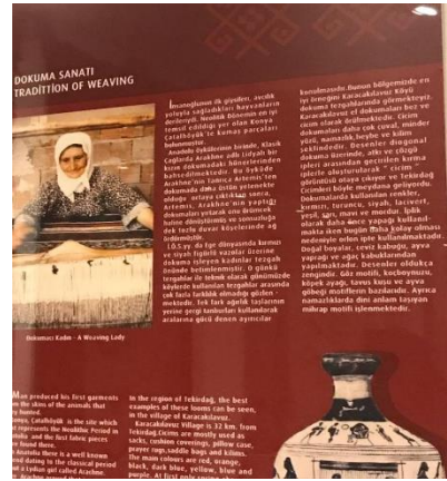
Şekil 15: Pano örneği (Arin, 2021).