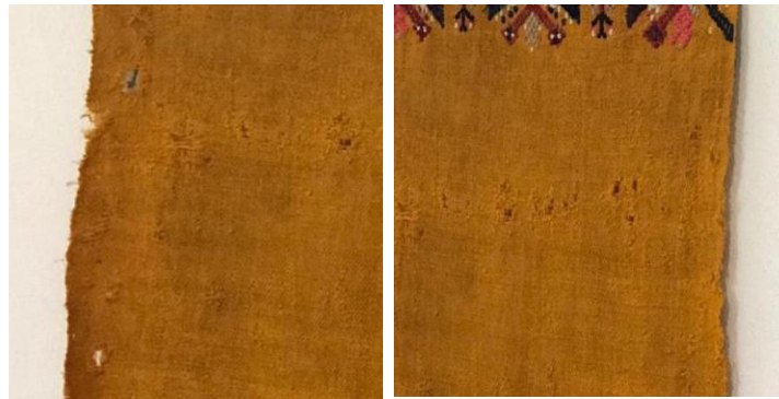
Şekil 11: Örnek 3'te görülen bozulmalar (Arin, 2021).