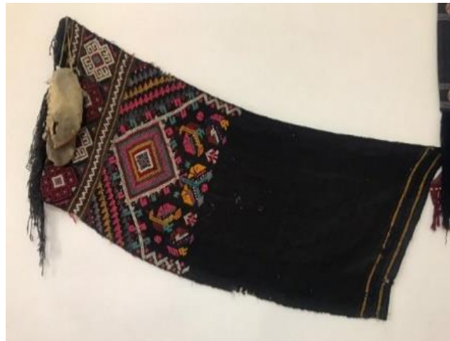
Şekil 6: Seccade-Örnek 1 (Arin, 2021).

Bozulmalar: Seccadenin bozulma durumu incelenirken uzun yıllar boyunca kullanıldığı da göz önünde bulundurulmuştur. Buna bağlı olarak dokuma yüzeyinde özellikle orta ve kenar kısımlarında aşınmalar görülmektedir. Dokumanın sol kenarının alt bölümünde atkı ve çözgü kayıpları mevcuttur. Aynı zamanda dokumanın çeşitli yerlerinde bazıları delik görüntüsü oluşturacak kadar yoğun görülen bir iplik kaybı söz konusudur (Tablo 1) (Şekil 7).