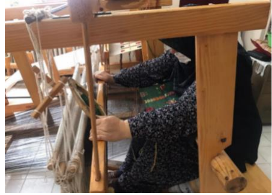
Şekil 3: Atkı ve motif sıkıştırma işlemi (Arin, 2021).

Dimi tekniğiyle meydana getirilen dokuma zemini, üçüncü bir ip kullanılarak yapılan cicim teknikli motiflerle bezenmektedir. Zemin kısmında dimi, motif kısımlarında ise cicim tekniği kullanılarak kendine has bir üslupla dokunmaktadır. Motif kısmında kullanılan renkli iplikler ile istenen desen dokuma sırasında oluşturulmaktadır. Dokumalarda kullanılan başlıca renkler, kırmızı, turuncu, siyah, lacivert, yeşil, sarı, mavi ve mordur. Bu dokuma yöntemiyle seccade, kilim, minder yüzü, heybe ve nazarlık gibi çeşitli ürünler üretilmektedir (Kaçar, 2012:7) (Şekil 4-5). Aynı zamanda bu dokumalar yatay, dikey, serpme, merkezi ve mihraplı olarak adlandırılan beş farklı kompozisyona bağlı kalarak oluşturulmaktadır 8 .