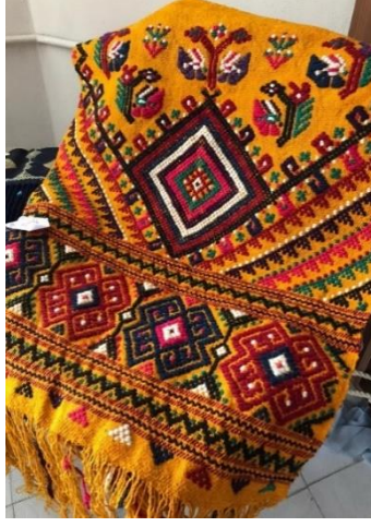
Şekil 12: Seccade örnek 3'ün yeni tasarımı (Arin, 2021).

Dokumalarda göz motifi, koçboynuzu, köpek ayağı, tavus kuşu, üç güller, çam dalı, mührü Süleyman, çengel, sofra, beygir nalı, yıldız, kilit deseni ilave atkı ipliği ile işlenmektedir.