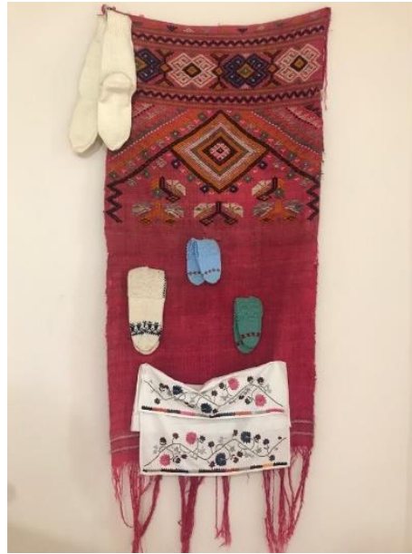
Şekil 8: Seccade-Örnek 2 (Arin, 2021).

Bozulmalar: Seccade içinde bulunduğu ortamdan ve uzun bir zaman boyunca kullanıma bağlı olarak oluşan renk değişimi gözlemlenmiştir. Buna ek olarak dokuma yüzeyinde aşınmalar görülmektedir. Dokumanın çeşitli bölümlerinde atkı ve çözüğü iplik kopmaları ve iğne izlerine ait delikler mevcuttur (Tablo 1) (Şekil 9).