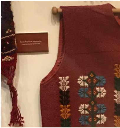
Şekil 14: Etiket örneği (Arin, 2021).

ürün özellikleri değil sadece Karacakılavuz dokumalarına ait bilgiler verilmiştir (Şekil 14). Bunun yanı sıra yine bordo zemin üzerine dokuma sanatı hakkında bilgi içeren bir pano yerleştirilmiştir (Şekil 15). Ürünlere yönelik bilgilerin yer aldığı etiketlere yer verilmesi, ürünün coğrafi işaret alan özgün bir değer olduğunun vurgulanması gerekmektedir. Dijital ekranlardan yararlanılabilir, yörenin yaşayan insan hazinesi olabilecek bireyler ile sözlü tarih çalışmaları yapılabilir ve halk bilim anlatılarına yer verilebilir. Müzede öğrenme kapsamında eğitim paketlerinde Karacakılavuz uygulamalarına yönelik etkinlik planlanabilir. Yeni üretim Karacakılavuz dokumaları müzede gelen ziyaretçilere pazarlanabilir. Sözü edilen öneriler çağdaş müzecilik bağlamında müze pazarlaması açısından önemli unsurlardır.