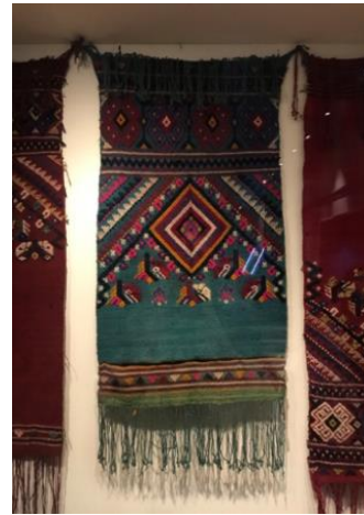
Şekil 4: Karacaklavuz dokuma örnekleri, Tekirdağ Arkeoloji ve Etnografya Müzesi (Arin, 2021).