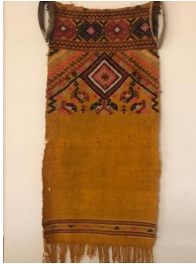
Şekil 10: Seccade-Örnek 3 (Arin, 2021).

Bozulmalar: Seccadede uzun bir zaman boyunca kullanıma bağlı olarak oluştuğu düşünülen yıpranmalar söz konusudur. Bu dokumanın yeniden dokunduğu bilinmektedir. Müzede sergilenen ürünlerin bozulma durumu ileri seviyede olduğunda ürünün yeniden kopyası yapılmakta ve yeni dokuma sergilenerek esas ürün yüksek önlemler alınarak depoya kaldırılmaktadır (Şekil 12). Kullanıma bağlı olarak dokuma yüzeyinde aşınmalar görülmektedir. Dokumanın çeşitli bölümlerinde atkı ve çözgü ipliklerinde kopmaları mevcuttur (Tablo 1) (Şekil 11).