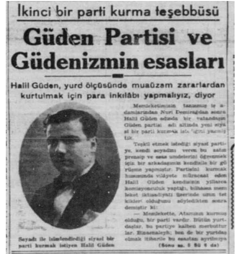
Şekil 3 Yeni Sabah, 20 Temmuz 1945.