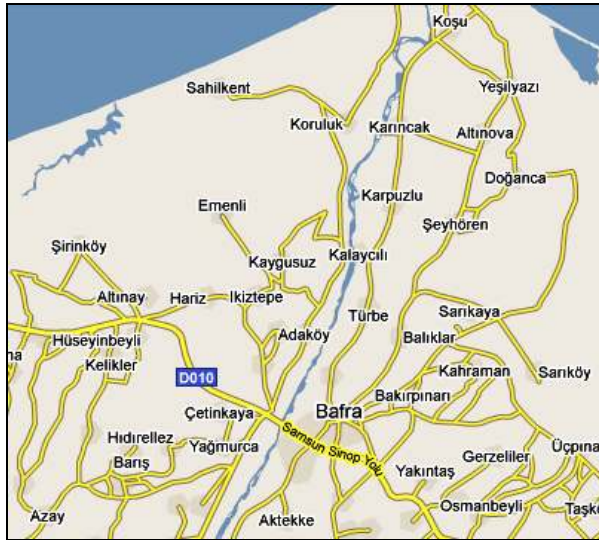
Şekil 1. Bafra Ovası'nda kapyra tipi kırmızı biber tiplerinin toplandığı yerlerin görünümü.

Deneme süresince kültürel işlemler, düzenli olarak yürütülmüştür. Toprak analiz sonuçları dikkate alınarak denemenin kurulduğu her iki yılda da dekara 2 ton yanmış çiftlik gübresi, taban gübresi olarak 43 kg/da DAP (Diamonyum fosfat) ve 15 kg/da CAN (Kalsiyum amonyum nitrat) olacak şekilde gübreleme programı uygulanmıştır. Dikimden sonra yapılan