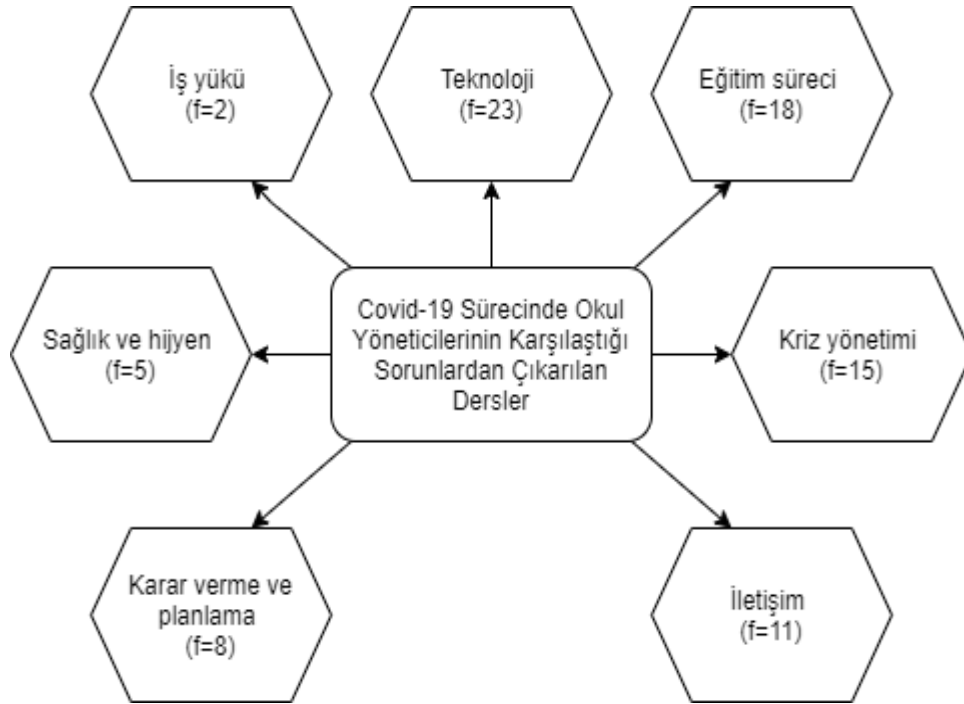
Şekil 2. Okul Yöneticilerinin Covid-19 Pandemisi Sürecinde Karşılaştığı Sorunlardan Çıkardıkları Derslere İlişkin Temalar

Elde edilen verilerin analizi sonucunda okul yöneticilerinin Covid-19 pandemisi sürecinde karşılaştığı sorunlardan çıkardıkları dersler 7 tema altında toplanmıştır. Şekil 2’de bu temalara yönelik bilgiler verilmiştir.