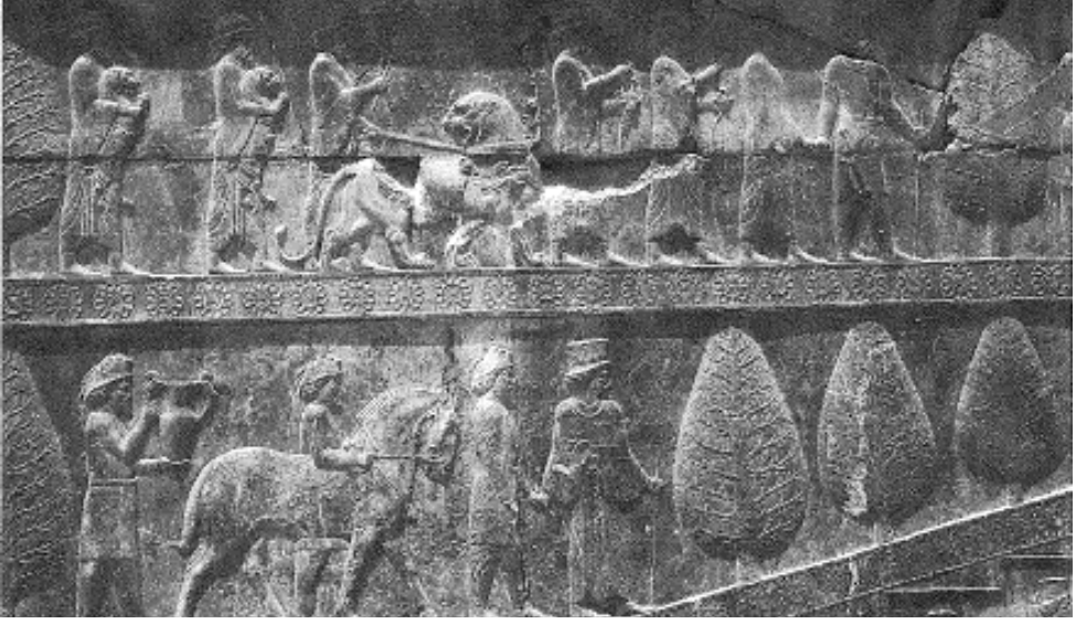
Resim 1. Büyük krala hediyeler getiren iki tebaa grubu (yukarıda Elamit; aşağıda Armanialılar): Persepolis doğu merdiveni Apadana (Kuhrt, 2009, s.106)