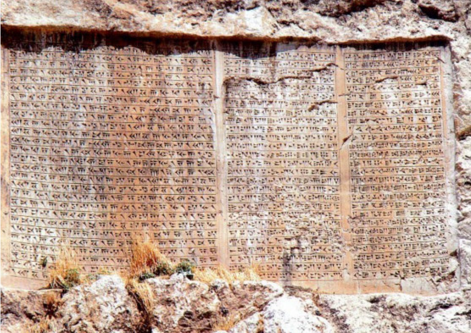
Fotoğraf 1. Van Kalesi yamacında yer alan Pers kralı Kserkses'e ait yazıt (Bassello, 2013, s. 137).