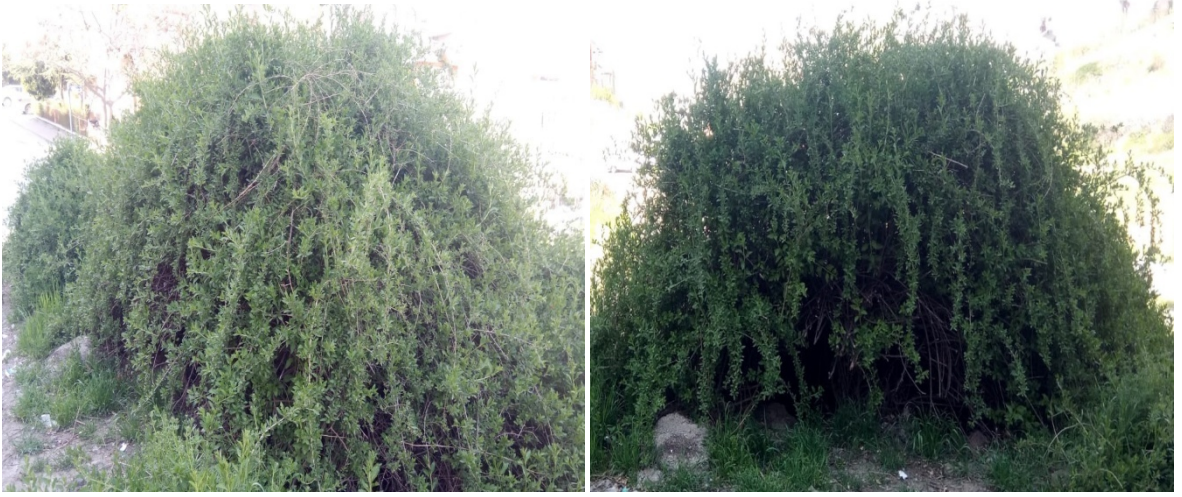
Şekil 4. Gelişmiş Anadolu Teke Dikenin bol yapraklı olduğu zamandan görünüm