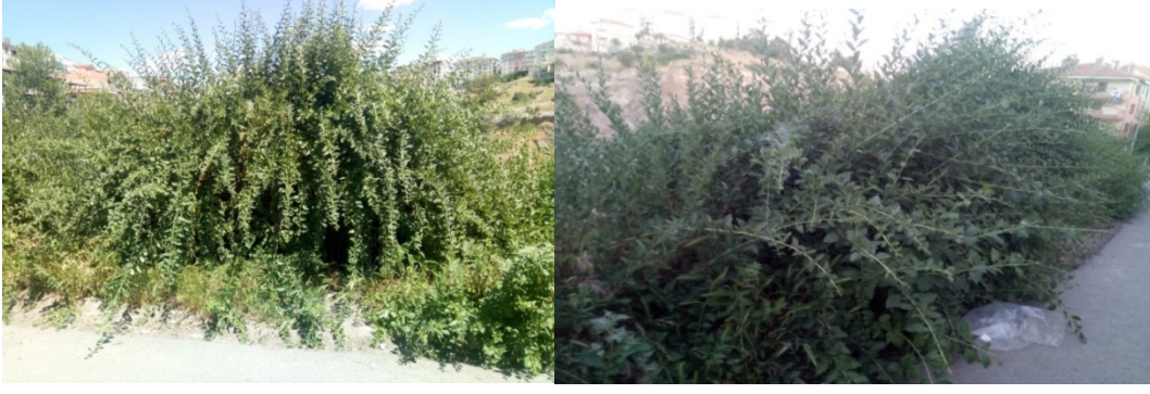
Şekil 2. Anadolu Teke Dikeni'nin Doğadaki Görünüşü