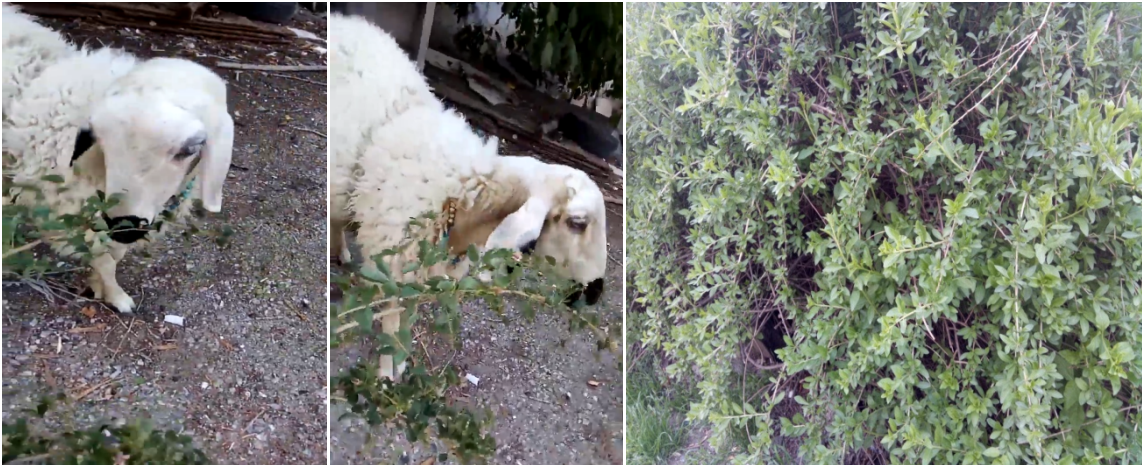
Şekil 3. Anadolu Teke Dikeni'nin doğal ortamda otlatılması

Yaygın bir endemik türümüz olan Anadolu Teke Dikeni'nin saha gözlemlerinde küçükbaş hayvanlar tarafından sevilerek ve iştahla yendiği tespit edilmiştir(Şekil 3). Hem tohum hem de özellikle vejetatif aksamından kolayca çoğaltılan Anadolu teke dikeni bitkisinin yem değeri, "Çalı ve Çalimsı Bitkilere Ait Gözlem Kriterleri" isimli kitapta belirttikleri ve bitkinin teknolojik özellikleri olarak ifade ettikleri [13] ; kuru madde, bitki ham protein oranı, bitki ham kül oranı, ham yağ oranı, ham selüloz, ADF, NDF, ADL vb. gibi bazı özellikleri kapsayacak şekilde analizleri metodumuzda belirtildiği şekilde S.Ü. Veterinerlik Fakültesinde yapılmıştır.