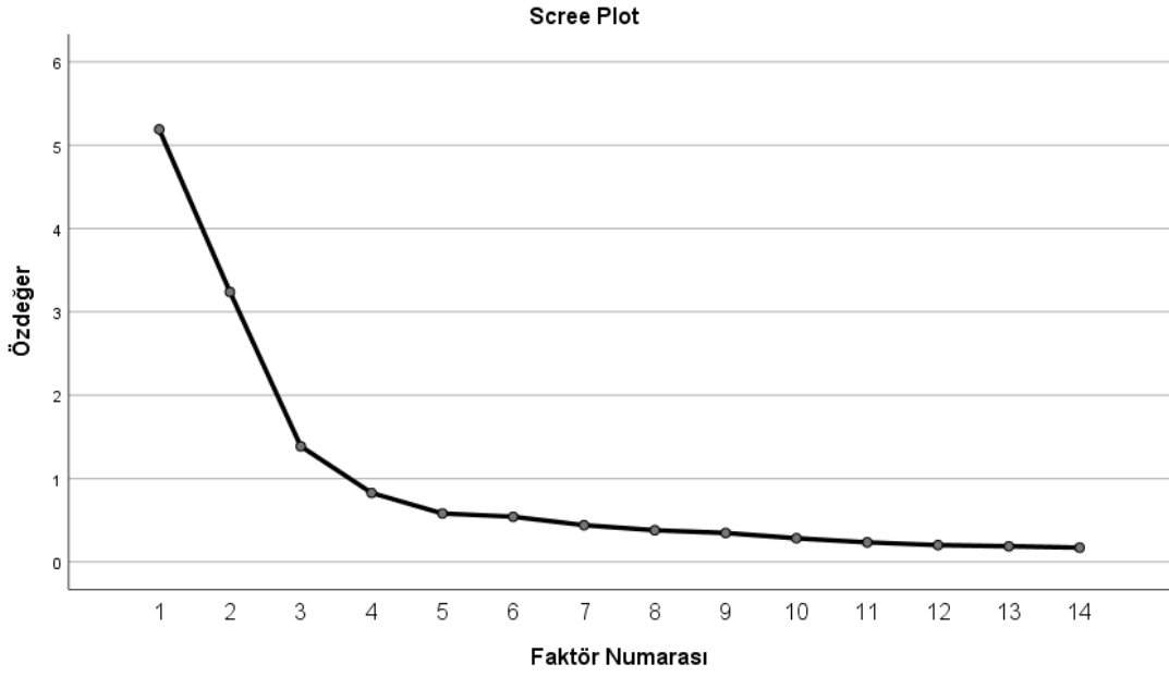
Şekil 1: Algılanan İş Riski Ölçeği Yamaç Grafiği

Algılanan iş riski ölçeğine ait Şekil 1'deki yamaç grafiği incelendiğinde, ölçeğin 3 boyuta ayrıldığı görülmektedir. Buna göre: