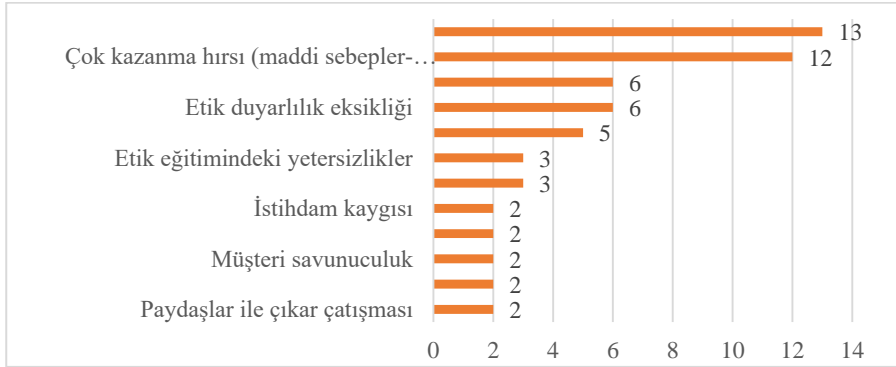
Grafik 3: Uluslararası çalışmaların sonuçlarına göre muhasebe meslek mensuplarının etik dışı davranış sergilemelerinin nedenleri