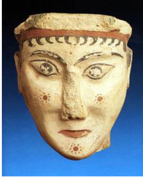
Şekil 1: Miken Uygarlığı'ndan bir yüz boyası gösterimi (URL-1, Erişim Tarihi: 27-07-2021)

Yüz yazma geleneği antik kültürlerde de izlerine rastlanan bir süslenme biçimidir. Miken Uygarlığı'nda bulunan ve Şekil 1'de görülen yüzün bir kadına ait olduğu düşünülmektedir. Neredeyse siyah gibi görünen ama çok derin mavi ile çizilmiş renkler saç ve gözler için kullanılmıştır. Dudaklar ve yanıklarda kullanılan dekorasyonlar ile saç filesi ise kırmızı renklidir (URL-1, Erişim Tarihi: 27-07-2021).