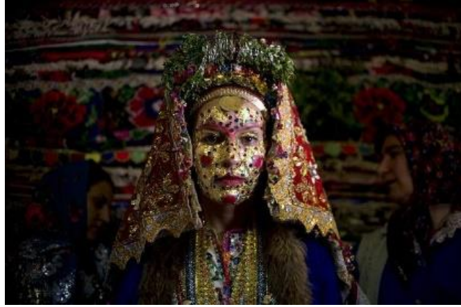
Şekil 2: Gelina uygulaması (URL-2, Erişim Tarihi: 27-07-2021)

Bulgaristan'ın Müslüman bir azınlığı olan Pomaklara aittir ve bu bölgede kullanılan ritüelde gelinin yüzüne sürmek için "belilo" denilen kalın altın rengi metalik bir krem kullanılır. Belilo bir maske gibi pullar ve çiçekli desenlerle süslenerek gelinin yüzüne uygulanır. Son olarak maskenin altında gelinin fiziksel yüz özelliklerine bağlı olarak da kaşlarına sürme çekilir ve dudaklarına ruj sürülür. Bu işlem yaklaşık 2 saati bulur ve genellikle de kadın ziyaretçiler ve akrabaları eşliğinde yapılır. Bazen de bu törenlere profesyonel bir makyaj sanatçısının katıldığı da belirtilmiştir. Düğünden sonra imam tarafından son bir kez dua okunur ve geline damadın evine gidene kadar eşlik edilir, burada gelin makyajını çıkararak ritüel tamamlanır. Gelina geleneği, Pomak kültürüne ait oldukça eski bir kültürdür. Ancak bu geleneğin Sovyet kurallarında yasaklandığı ve durdurulduğu, bu geleneğin yavaşça yok olduğu bilinmektedir (URL-2, Erişim Tarihi: 25-07-2020).