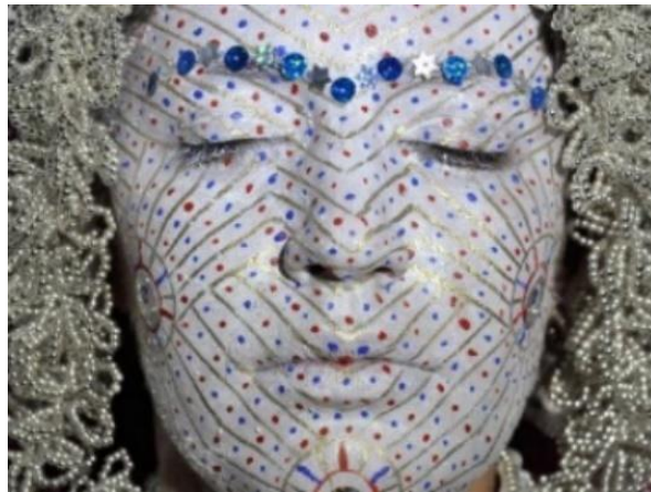
Şekil 3: Kosova'daki yüz yazma uygulaması (URL-3, Erişim Tarihi: 27-07-2021)

Türkiye ve Balkan bölgelerinde az da olsa halen yer aldığı bilinen bu geleneğin bir diğer uygulaması da Kosova'dadır. Burada da yüz yazma geleneği binlerce yıl öncesine gider ve bir sonraki kuşağa geçerek aktarılır. Güney Kosova'da Zhupa bölgesinde 65 yaşındaki bir yaşlı kadının genç gelinlerin yüzlerini yazdığı bilinmektedir. Burada uygulanan yöntemde, gelinin yüzü birçok renk katmanları ile boyanır. Birbiri içinden geçen altın yollar yüzün üzerine çizilir ve bunlar bir yaşamdan başka bir yaşama geçişi sembolize eden 3 altın daireye bağlanır (Şekil 3). İçinden mavi ve kırmızı noktaların çıktığı kırmızı daireler bereketi sembolize eder ve bunlarla tüm yüz kaplanır bu sırada geline sağlıklı ve mutlu bir aileye sahip olması dlenir (URL-3, Erişim Tarihi: 25-07-2020).