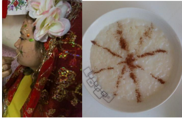
Şekil 9: Güneş motifi uygulaması (Anadolu Ajansı arşivi, Muhabir: Halil Fidan, Fotoğraf: İsmail Duru, Model: Gamze Elmas), Şekil 10: Sütlaç üzerinde güneş motifi (Dilek Himam arşivi).

Yüz yazıcısı Şerife Zorlu, görüşmeler sırasında ikram ettiği yemeklerin, tatlıların üzerine de benzer güneş motifini aktarırken, gündelik yaşama içkinleşmiş olarak bu sembolleri görmek de mümkün olmuştur. Kullanılan semboller iki yanak ve alın ve çene bölgesinde yüzün stratejik noktalarında kullanılır.