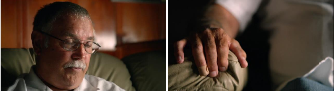
Görsel 5. Don Cobain El Detayı

Cobain'in bireysel kayıt cihazlarının yer aldığı bir dönemde yaşamış olması, kendisinin ve ailesinin bunları kullanıyor olması, bunun yanı sıra şöhrete ulaşması ve medya tarafından da kayıtlarının oluşturulması, arşivinin zengin olmasını sağlamaktadır. Böyle bir durum belgeselcinin elini de zenginleştirmektedir. Devasa bir arşiv yığınıyla dahi karşı karşıya kalınabilmektedir. Uzun bir süre arşiv görüntüleri incelenebilmekte ve oluşturulmak istenen minvalde kullanılabilir. Bu yönüyle belgeselde, tüm görüntülerin film ekibi tarafından çekilmesine gerek kalmamaktadır. Özellikle kurgucu ve yönetmen, çekim yapmanın yanı sıra daha çok derleme/düzenleme ile ilgilenebilmektedir.