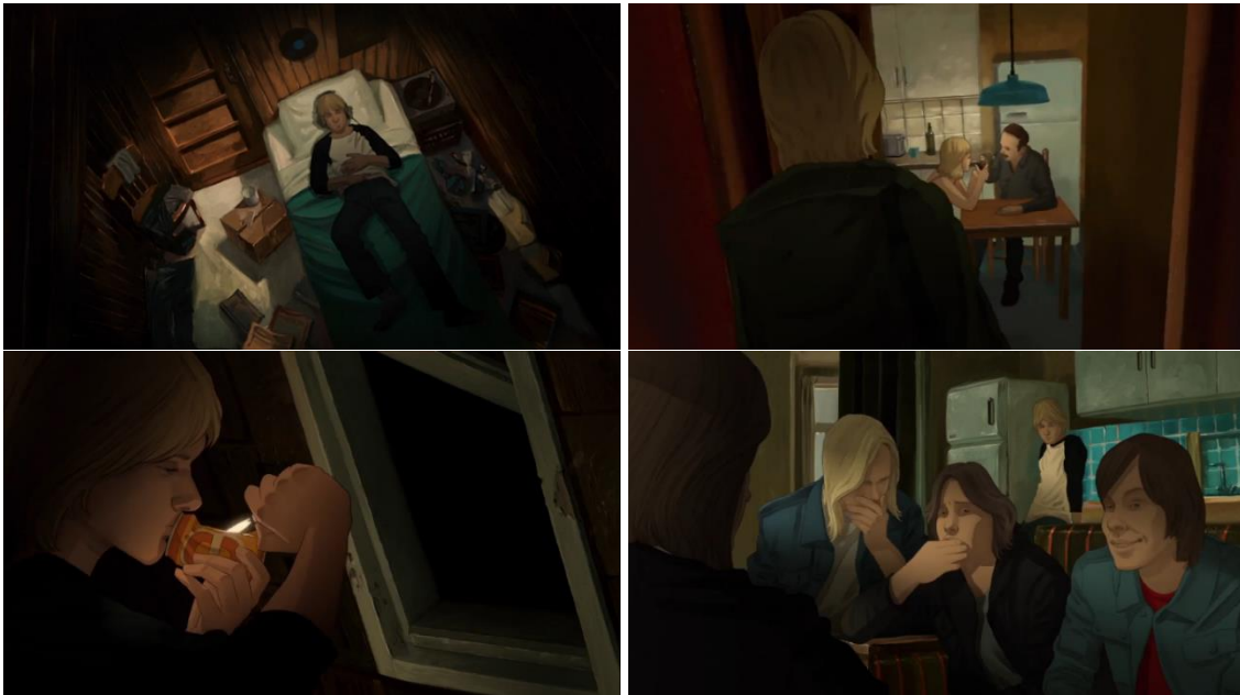
Görsel 7. Belgeselde Animasyon Kullanımı

Cobain'in solisti ve gitaristi olduğu Nirvana müzik grubunun albüm kapaklarında yer alan simgeler ve görseller çeşitlendirilerek ve animasyon teknikleriyle