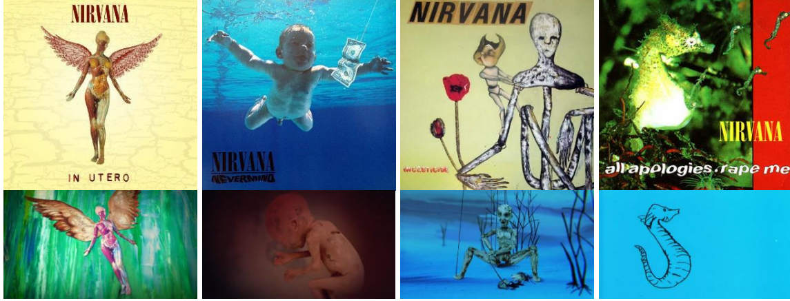
Görsel 8. Albüm Kapaklarının Belgeselde Kullanımı

hareketlendirilerek kullanılmıştır. Aşağıdaki şekilde üst kısımda albüm kapaklarının resimlerine, alt kısımda ise belgeselde kullanılan görüntülere yer verilmiştir. Nirvana albümlerinin kapaklarında bulunanlar; In Utero (1993) kapağında kanatlı bir kadın, Incesticide (1992) kapağında mumyayı andıran bir yaratık, bir bebek ve haşhaş tohumu, Nevermind (1991) kapağında havuzda yüzen bir bebek ve All Apologies (1993) kapağında deniz atı görselleri bulunmaktadır. Bu albüm kapağı görselleri Nirvana'nın ve Cobain'in şarkılarının ve tarzlarının yansıdığı imgelerdir. Bu imgeler Cobain'in dünyasına mümkün olduğunca girmeye çalışan bir yönetmen için, onun duygu durumunu yansıtmaya yardım edebilecek metaforik öğeler olarak kullanılmaktadır.