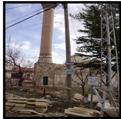
Şekil 13. İbrala Köy Meydanında Bulunan Cami

İbrala'da her yıl 5-6 Ağustos tarihleri arasında Yunus Emre'yi Anma Etkinlikleri düzenlenmektedir. Etkinliğin Yunus Emre konulu paneller yapılarak, bölge halkı ve çevre yörelerden gelenlere tanıtılmaktadır. Birçok sanatçının sahne alması, yöresel oyunlar, çeşitli sergilerin düzenlenmesi ve spor faaliyetleri gibi etkinlikler düzenlenmektedir.