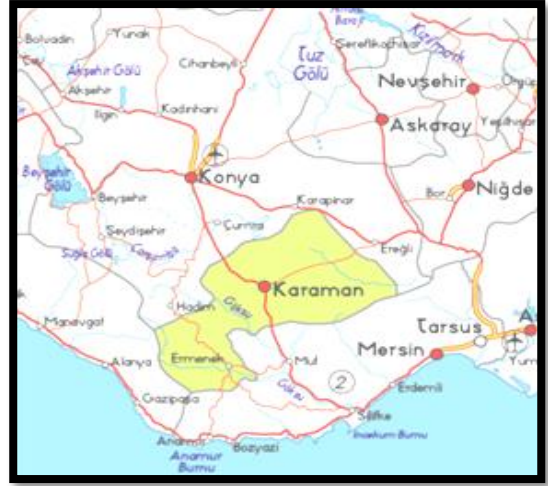
Şekil 1. Karaman haritası

Karaman, coğafi açıdan ele alındığında, Türkiye’nin İç Anadolu Bölgesi’nde bulunmaktadır. Tarihte olduğu gibi, günümüzde de büyük öneme sahiptir. Uzun yıllar boyunca bölgenin ekonomi, kültür, sanayi, ticaret ve sanat merkezi olmuştur. Karaman ve çevresi; tarihi yapılara, inanç merkezlerine ve mağaralara ev sahipliği yapan bir yerdir (Şekil 1).