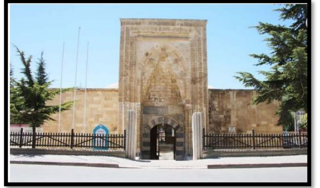
Şekil 6. Hatuniye Medresesi

Osmanlı Sultanı Murat Hüdavendigâr'ın kızı, Karamanoğlu Alaaddin Bey'in karısı Nefise Sultan tarafından, 1382 yılında yaptırılmıştır. Yapının giriş kapısında oluklu gök mermerden iri söve taşlar bulunmaktadır (Şekil 6). Taç kapısı, Karamanoğulları devri mimarisinin günümüze ulaşan en önemli eserlerinden biridir [20]. Geniş taç kapı, birbirine geçmeli taşlarla biçimlenmiş, kemer başlangıcı ve kilit taşı bezenmiştir [21]. Hem mimarisi hem de bulunduğu mevki açısından, kentnin dikkat çekici yapıları arasında yer almaktadır. Medrese, revaklarla çevrili açık avlu, tek eyvanlı, sağlı sollu öğrenci odalarının bulunduğu dönemsel bir yapı niteliği taşımaktadır. Yapı malzemesi olarak kesme taş kullanılan medresede, süsleme özellikle büyük taç kapısında, kapı ve pencere sövelerinde, eyvan kemerlerinde ve öğrenci odalarının girişlerinde kendisini göstermektedir. Süslemelerde geometrik ve bitkisel motiflerin yanı sıra, rumiler, palmeler ile yazılar süslemenin esas düzenini oluşturmaktadır. Günümüzde sergi alanı, toplantı salonu, şiir ve müzik dinletileri gibi etkinliklerin yapıldığı Hatuniye Medresesi aynı zamanda Karaman Müze'sinin yanında yer almaktadır.