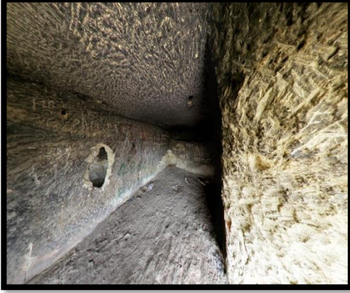
Şekil 14. Manazan Mağaraları ve At Meydanı

bölgede doğal kayaların içlerine oyulmuş olan 5 katlı dehlizler toplu mesken yerleridir. Bu mağaraların Bizans Dönemi'ne ait bir yerleşim yeri olduğu ön cephede bulunan bir şapelden anlaşılmaktadır. Mağara çok katlı olup, giriş katı, kum kale, at meydanı ve ölü meydanı gibi kısımlardan oluşmaktadır (Şekil 14).