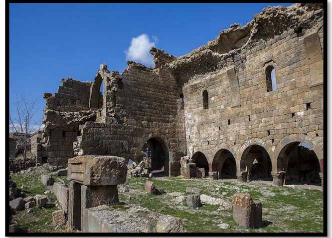
Şekil 8. Binbir Kilise

Bizans Dönemi'nde bölgenin en önemli dini merkezlerinden olan Binbir Kilise, Karadağ'ın eteklerinde Maden Şehri köyünün etrafında bulunmaktadır. Büyük bir kısmı mezar yapılarından meydana gelen bölge, Hititler Dönemi'nde de kutsal kabul edilmiştir ( https://karaman.ktb.gov.tr/TR-129387/karadag-binbir-kilise.html ). Pek çok kilise ve manastır içinde barındıran bölgedeki, dini ve askeri yapıların Anadolu'nun kültürel özellikleri açısından oldukça büyük bir önem taşıdığı söylenebilir.