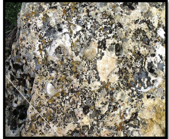
Şekil 17. Manazan Mağaraları Deniz Kabuğu fosilleri

Arkeolojik araştırmalar sonucunda, Geç Roma, Erken Hıristiyanlık, Bizans, Selçuklu ve Osmanlı dönemlerine ait buluntulara rastlandığı ifade edilmektedir (Şekil 17). Mağaralarının içerisinde bulunan seramik kalıntıları ve diğer bazı parçalar bu bölgede Roma ve Erken Hıristiyanlık dönemlerine ait yaşam belirtilerinin olduğunu göstermektedir [29].