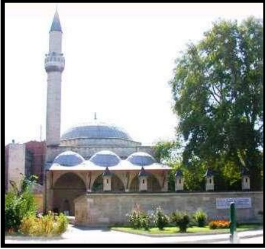
Şekil 5. Karaman Aktekke Camii

1370 yılında Alaaddin Bey tarafından yaptırılmış olan Aktekke Camii Karaman merkezdedir. Dönemin en yaygın yapı malzemesi olan kesme taş kullanımı yapıya doğal bir doku özelliği kazandırmıştır (Şekil 5). Yapısal açıdan değerlendirildiğinde caminin, merkezde yer alan bir kubbesi ve klasik Osmanlı örneklerinden olan yüksek minaresi bulunmaktadır. Caminin içerisinde Mevlâna Hazretleri'nin annesi, kardeşi başta olmak üzere yakınlarının mezarları vardır. Caminin iç kısımlarında Klasik Osmanlı Dönemi kalem işi bezemelerine rastlamak mümkündür [19].