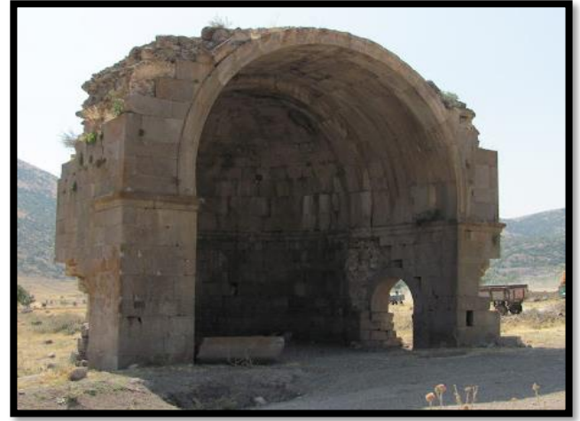
Şekil 9. Madenşehri Bölgesi Kalıntıları

Karaman'ın Karadağ bölgesi üzerinde yer alan Değle Ören Yeri'nde bulunan yapılardan, Bizans Dönemi ev mimarisi hakkında bilgilere ulaşmak mümkündür ( https://karaman.ktb.gov.tr/TR-129570/degle-oren-yeri.html ). 2 ya da 3 odalı yapılmış olan bu konutlar dini mimari yapılarla kıyasla sadece ihtiyacı karşılamaya yönelik, oldukça yalın ve sade bir şekilde inşa edildiği görülmektedir. Genellikle kesme taşla inşa edilmiş mezar yapıları olan, kaya mezarları, mezar kapakları bulunmaktadır. Ayrıca, yapılar arasında kaya mezarlarına dönüştürülmüş bir sunak bulunmaktadır. Yapılan kazılarda kaya üzerinde bir kabartma sahnesine ulaşılmıştır (Şekil 10).