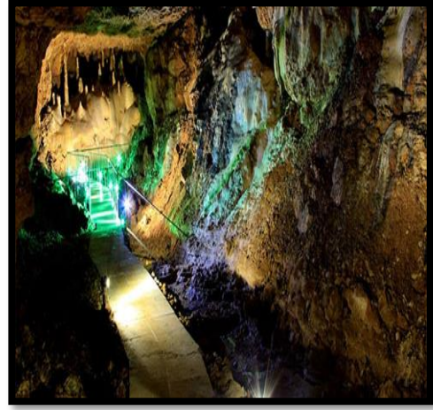
Şekil 23. İncesu Mağarası

23). Kaya sığınaklarının bulunduğu bölümde, Roma Dönemi'ne ait küçük bir yerleşimin bulunduğu dair izler mevcuttur.