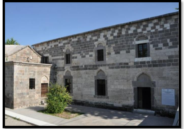
Şekil 3. Çeşmeli Kilise.

Karaman İl Merkezindeki Çeşmeli Kilise, Karadağ Binbir Kilise'de bulunan küçük bazilikaların bir örneğidir (Şekil 3). Bizans Dönemi'ne ait olan eserde, yapı ögesi olarak kullanılan kesme taşlar, bölge nitelikler taşımaktadır. Bizans Dönemi'ne ait olan yapı, 1980 yıllarına kadar cezaevi olarak kullanılmıştır (https://www.kulturportali.gov.tr/turkiye/karaman/gezilecek yer/c esmeli-kilise). Dış görünüşünü koruyarak iç mekâna çeşitli ayrıntılar eklenmiştir. 2007 yılında restore edilen kilise, Kültür ve Turizm Bakanlığı'na tahsis edilmiştir. Restore edildikten sonrası kilise günümüzde, çeşitli sanat etkinlikleri, sergiler, toplantılar, şiir ve müzik dinletileri gibi kültürel faaliyetlerin yapıldığı tarihi bir mekân olarak değerlendirilmektedir [18]. Bölgesel kalkına açısından sanatsal ve kültürel olarak önemli bir mekândır. Mevcut işlevselliğinin yanı sıra, çeşitli akademik çalışmalar yapılabilecek imkânları taşımaktadır. Ayrıca bölge halkının çeşitli amaçlarla yararlanabileceği bir yapıdır. Yapıyı ziyaretler sırasında ışık düzeyi, iç mekân özellikleri gibi unsurların pek çok etkinliğe uygun olduğu tespit edilmiştir.