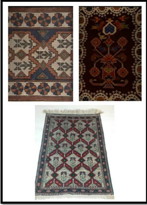
Şekil 19. Taşkale halısından örnekler

Bölgede, Kızıllar Halısı olarak dokunan halılarda, yaklaşık 40 desen kullanılmaktadır. Geçmişte halıdan başka, yastık, heybe, çanta, seccade v.b. ticari ve kalkınma amacıyla dokumalar yapılmıştır. Halılarda doğal ve kök boyalar ile kendi yetiştirdikleri hayvanların yününden ürettikleri dokuma iplikleri kullanılmaktadır (Şekil 19). Geometrik ve bitkisel desenlerin kullanıldığı Taşkale halılarında, motifler genellikle sarı ve kırmızı renklindedir.