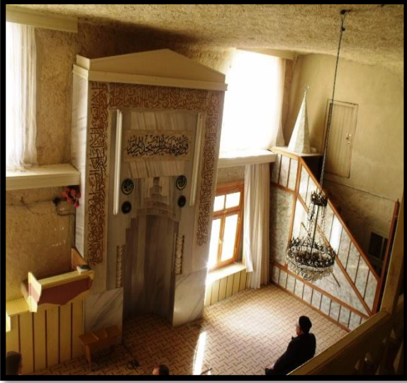
Şekil 21. Taş Mescit