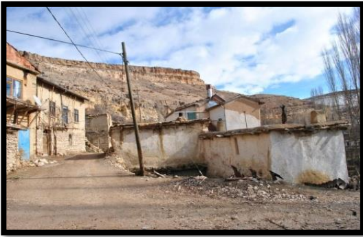
Şekil 22. Kızıllarağini Köyü

Taşkale köyüne yaklaşık 2 km. mesafededir (Şekil 22). Eski Türklerde güney tarafa kızıl yön denilmekte olduğundan, Asya'dan gelen Türk boylarının kurdukları köyler arasında kızıl takılı pek çok yerler veya yöreler vardır. Kızıllar adı Kuzey Asya Türk boylarından birisinin karakteristik adıdır [31]. Ağın sözü ise, öz Türkçe bir terimdir. Yakın olmak, bağlılık anlamlarındadır. "Kızıllarağini" ise kızılılara bağlı, onların bir kolu anlamına gelmektedir. Pek çok Türk boyları, geldikleri ana yurtlarındaki, şehir veya kasabalarının ya da oymaklarının adlarını Anadolu'da yeni kurdukları yurtlarına bir hatıra olarak vermişlerdir. Sibiry'a'dan gelen Türkler de Kızıllarağini'nin ismini kullanmışlardır. Hatta ulu önder Mustafa Kemal Atatürk'ün buradan Selanik'e göç ettiği bilinmektedir [31]. Bunun bilinirliğinin yaygınlaştırılması, turizm hareketliliğine olanak sağlayacaktır. Bu durum, Karaman'da yerel yönetimlerin çabalarıyla ivme kazanmıştır.