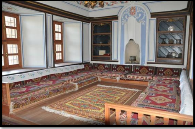
Şekil 4. Tartan Evi

tip yapılar, çeşitli açılardan bölge kalkınmasına katkı sağlayabilmektedir. Bu mimari yapılarda, mevcut işlevlerinin yanı sıra, yılın belli zamanlarında çeşitli turistik etkinliklere, akademik faaliyetlere veya farklı kültür-sanat etkinliklerine yer verilmektedir. Ayrıca çevre illerden ziyaretçiler davet edilip, yöresel gelenek ve görenekler de tanıtılmaktadır.