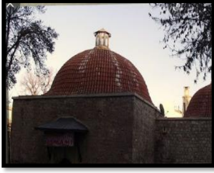
Şekil 7. Karaman Hamamlarından Örnek

Hamamların, Türklerde su kültürünün en önemli yapıları arasında yer alması, bu yapıların hem kullanım hem de mimari yapı özelliklerinin sürdürülebilirliği açısından önemlidir. Osmanlı Dönemi'ne ait hamam yapılarının bu nedenlerle bölgesel kalkınmaya katkı sağlayabilecekleri düşünülmektedir. Geçmişteki gelenek, görenek ve kültürel unsurların günümüze taşınması, geleceğe aktarılabilmesini de sağlamaktadır. Böylece kültürel unsurlar yaşatılabilecektir. Bölgesel kalkınmanın en önemli noktası tarihsel öğelerin canlı tutulabilmesiyle alakalıdır.