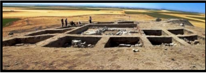
Şekil 11. Derbe Antik kenti

Üzerlerinde çok sayıda kalıntı bulunan tepelerden birisi de Karadağ'ın en yüksek noktasını oluşturan 2288 m yüksekliğindeki Mahalaç Tepesi'dir [24]. Bu bölgede kesme taştan inşa edilmiş bir kilise vardır. Bu kiliseye taş dehlizlerle bağlanmış olan bir mezar şapeli ile kilisenin batısında manastır ve sarnıçlar yer almaktadır. Mahalaç kilisesi olarak adlandırılan bu yapının özelliği, üç taraftan beşik tonozlarla desteklenen ortadaki kare mekânın üzerinin bir kule şeklinde yükselmesi ve üstünün kubbe ile örtülmesidir. 4-6. yüzyıllar arasına tarihlendirilmektedir [25]. Mahalaç kiliseninde büyük bir kaya üzerinde, Hitit Kralı Hartapus'un adının geçtiği Hitit Hiyeroglifiyle yazılmış bir kitabe bulunmaktadır (Şekil 12).