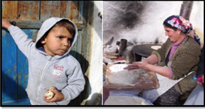
Şekil 18. Köy Halkı