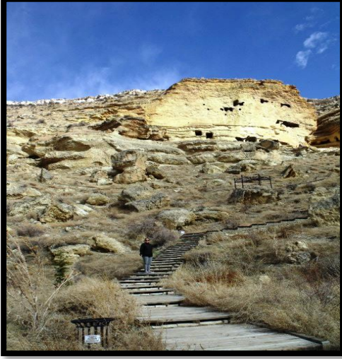
Şekil 15. Manazan Mağaraları

Her katın ortasında düzenli bir şekilde işlenmiş geniş ve uzun salonlar bulunmaktadır (Şekil 15). Dışa açılan pencerelerden içeriye ışık ve hava girmektedir. Bölgeye doğal bir güzellik kazandıran bu kültürel değer, çevresindeki alanın da elverişli olması nedeniyle, günümüzdeki işlevselliğinin yanısıra açık hava müzesi olabilecek imkânlarla da sahiptir. Çevresiyle birlikte anlam taşıyan bu mağara, çeşitli kültür-sanat faaliyetleri ve doğa yürüyüşleri gibi etkinliklerle daha fazla ziyaretçi kabul ederek, bölgesel kalkınmaya katkı sağlayacaktır.