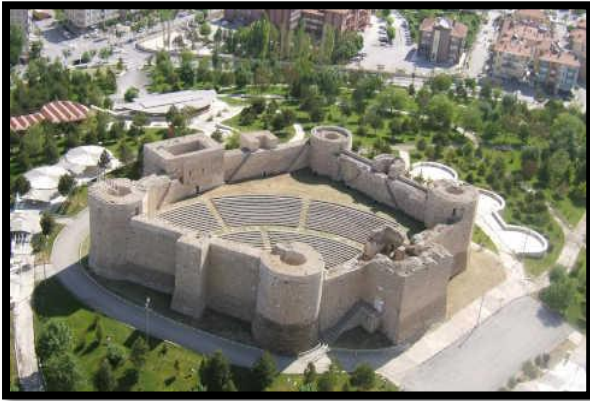
Şekil 2. Karaman Kalesi.

Ayrıca Karaman Kalesi ve etrafında yapılan çevre düzenlemeleri ve peyzaj çalışmaları, bölgeye tarihsel bir anlam ve kültürel bir önem kazandırmaktadır [17].