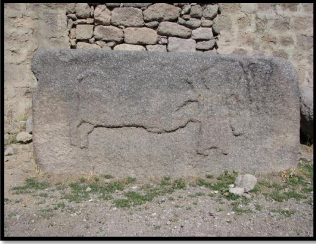
Şekil 10. Bizans Dönemi Kaya Mezarlarındaki Kabartma Sahne

https://karaman.ktb.gov.tr/TR-129570/degile-oren-yeri.html