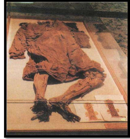
Şekil 16. Manazan Mağaralarından Çıkarılan Mumya

Manazan mağaralarında yapılan kazılar sonucunda çıkarılan mumya, halen Karaman Müze'sinde sergilenmektedir (Şekil 16).