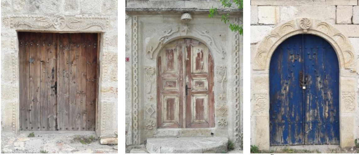
Şekil 16: Birçok Motifin Bir Arada Kullanıldığı Giriş Kapısı Örnekleri