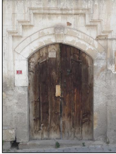
Şekil 7: Duayeri Mahallesi, Basık Kemer Biçimli Düzenlenen Avlu Kapısı