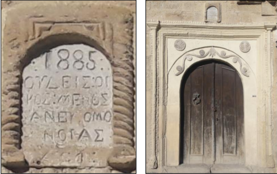
Şekil 6 : Duayeri Mahallesi, Yarım Daire Biçimli Düzenlenen Avlu Kapısı

Kapının çevresi farklı kademelerde düzenlenen silmeler ile çevrelenmiş olup kemer taşlarının üzerinde bitkisel ve geometrik motifler kullanılmıştır. Yarım daire biçiminde düzenlenen kemerlerin kilit taşı çoğu örnekte vurgulu ve volüt şeklinde yapılmış, hacimli olarak dışa doğru taşırılmıştır. Bazı örneklerde kemerin üzerinde dikdörtgen biçimli kartuş şeklinde kitabelik kısmı yer almaktadır. İncelenen 81 evin 34'ünde yarım daire kemer tipi kullanıldığı görülmektedir (Şekil 17-18). Ürgüp evlerinde en yaygın olarak kullanılan kapı tipidir. Bu örneklerden Duayeri mahallesi 120 ada, 2 parselde bulunan giriş kapısını incelediğimizde sarmal halat ile dikdörtgen biçimli kitabe görülmektedir. Kitabede; "1885. Hiçbir ev huzur olmadan ayakta durmaz 9 ." yazılıdır. Avlu kapısının çevresi beş adet iç içe geçmiş dikdörtgen silme ile çevrelenmiştir. Kapının iki yanında başlık kısımları 45 derecelik açı ile düzenlenmiş sütunçeler yer almaktadır. Kemer taşları üzerinde uçları volütlü dal kıvrımları yer alırken kilit taşı üzerinde ise palmet motifi kullanılmıştır. Kemerlerin iki yanında ise papatya tekeri motifi görülmektedir (Şekil 6).