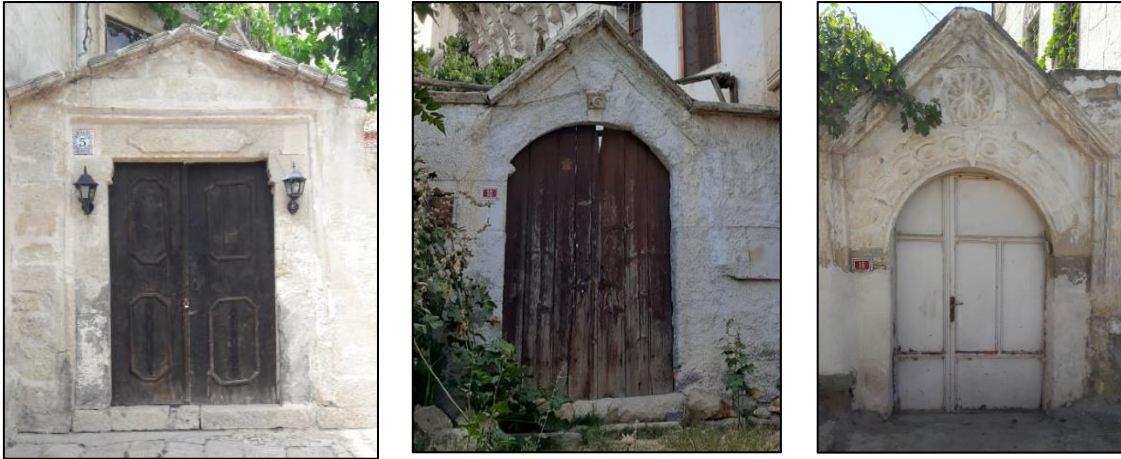
Şekil 4: Üçgen Alınlıklı Giriş Kapıları, Ürgüp, (Yazar Arşivi, 2019)

Ürgüp evlerinde genellikle kapının etrafı düz veya profilli silmeler ile dikdörtgen biçimde çevrelenmiştir. Çalışmada tespit edilen üç evin girişinde farklı olarak üçgen alınlık kullanıldığı görülmektedir (Şekil 4).