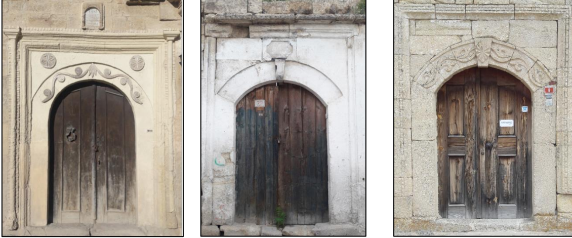
Şekil 3: Geleneksel Ürgüp Evlerinde Avlu Kapıları, (Yazar Arşivi, 2020)

Ürgüp evlerinde genellikle kapının etrafı düz veya profilli silmeler ile dikdörtgen biçimde çevrelenmiştir. Çalışmada tespit edilen üç evin girişinde farklı olarak üçgen alınlık kullanıldığı görülmektedir (Şekil 4).