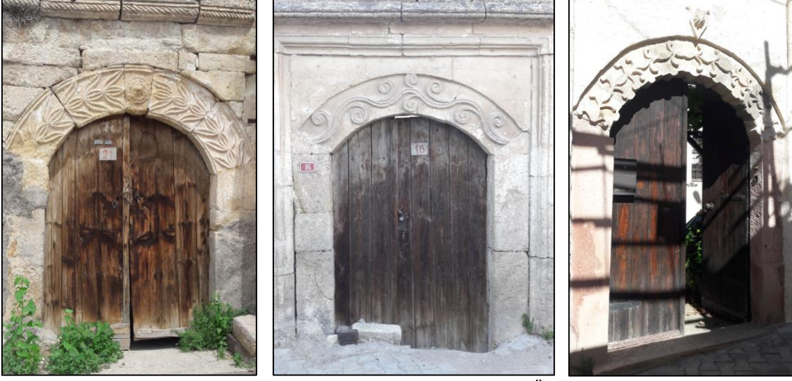
Şekil 9: Bitkisel Motiflerin Kullanıldığı Kapı Örnekleri

Yerleşimde en fazla görülen diğer bezeme ise kemer taşlarının sade bırakıldığı sadece kilit taşının hacimli şekilde volütle sonlandırıldığı örneklerdir. Bu iki bezeme incelenen kapı örneklerinde en fazla görülen örneklerdir (Şekil 10).