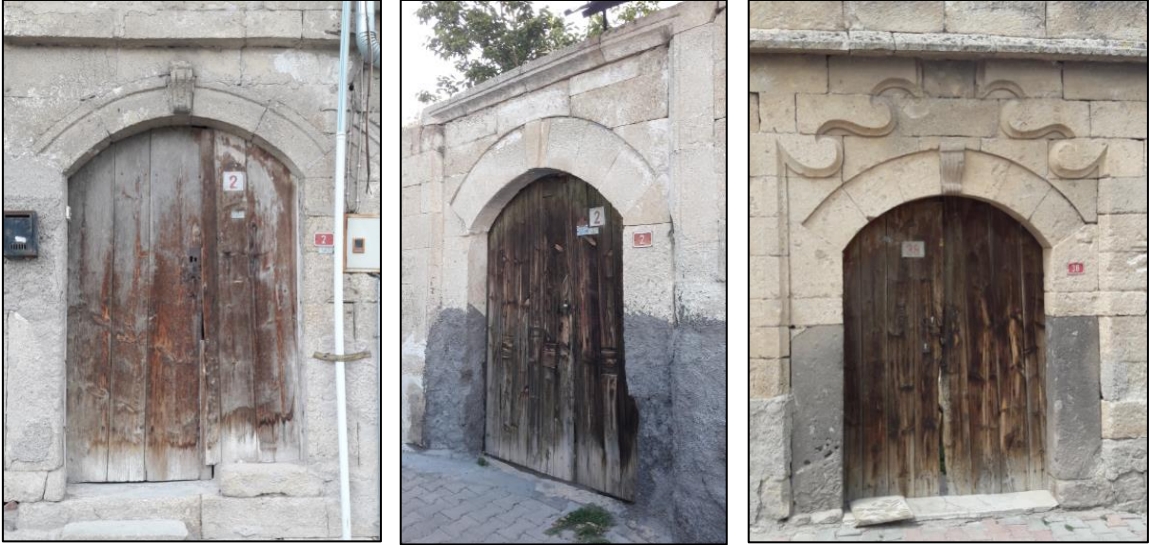
Şekil 10: Volütlü Kilit Taşları ile Tasarlanmış Dış Kapı Örnekleri

Yerleşimde en fazla görülen diğer bezeme ise kemer taşlarının sade bırakıldığı sadece kilit taşının hacimli şekilde volütle sonlandırıldığı örneklerdir. Bu iki bezeme incelenen kapı örneklerinde en fazla görülen örneklerdir (Şekil 10).