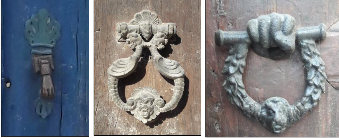
Şekil 13: İnsan Eli, Stilize Edilmiş Hayvan ve Bitkisel Motiflerin Kullanıldığı Metal Kapı Aksamları

Giriş kapılarında görülen diğer bezeme öğeleri ise demirden yapılan kapı tokmaklarıdır. İncelenen örneklerde çoğunlukla özgün kapı tokmaklarının söküldüğü veya değiştirildiği görülmektedir. Sade motiflerin de görüldüğü bu metal bezemelerin az sayıda örneğinde insan eli 17 , stilize edilmiş hayvan ve bitkisel motifler kullanılmıştır. Bu motifler bilekten itibaren görülen insan eli, bitkisel çelenk, stilize edilmiş aslan başı tasvirleridir (Şekil 13).