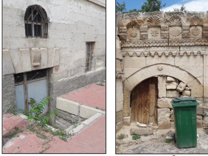
Şekil 14: Yol Kotundan Aşağıda Kalan Kapı Örnekleri

Bu yanlış uygulamalardan diğeri ise koruma bilincine sahip olamayan kişilerin kapıları özgün durumları dışında kullanarak kapatmaları veya pencereye dönüştürmeleri şeklinde olmuştur (Şekil 15).