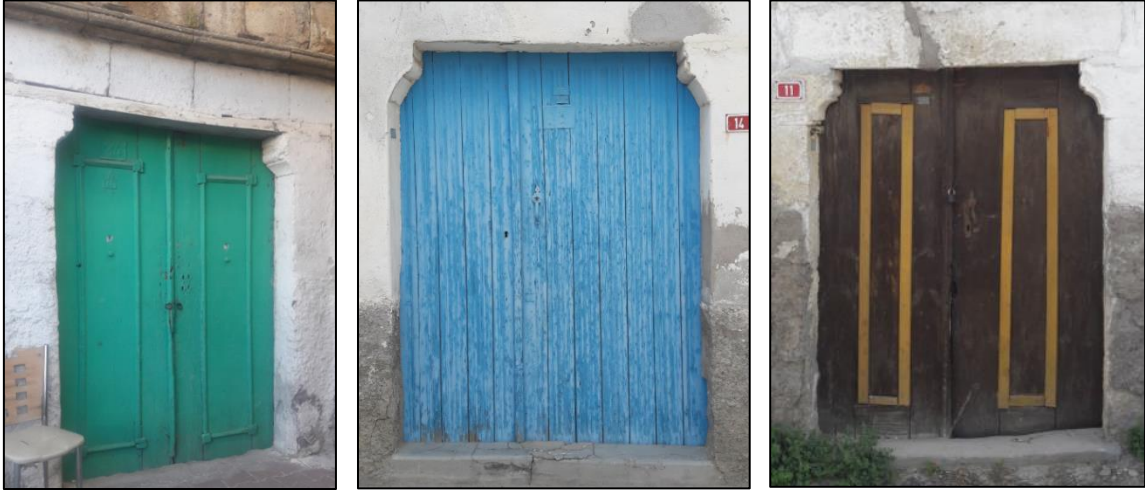
Şekil 8: Geleneksel Ürgüp Evlerinde Görülen Düz Lento Giriş Örnekleri

Geleneksel Ürgüp evlerinde görülen düz lento kullanımı sayı olarak kemerli örneklerle göre daha azdır. Genellikle sade olarak yapılan bu örneklerde çift ahşap kapı kanatlarının üzerine dikdörtgen biçimli atkı taşı konulmuştur. Bazı örneklerde düz lento kemerin üzerinde tepe penceresine de rastlanmaktadır. İncelenen 81 evin 17'sinde düz lento giriş tipi kullanılmıştır (Şekil 17-18). Bu örneklerde düz lentonun bitiş yerleri yarım sütun başlığı biçiminde hareketlendirilmiştir. Lento üzeri sade bırakılmış olup herhangi bir bezeme yapılmamıştır (Şekil 8).