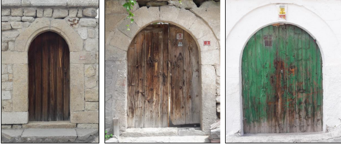
Şekil 11: Sade-Bezemesiz Tasarlanmış Kapı Örnekleri

Ürgüp evlerinin dış kapı taş bezemelerinde az sayıda da olsa geometrik motifli bezemeler mevcuttur. Çalışmada incelenen altı kapıda zikzak, üçgen, yarım daire, yıldız motifleri ile tasarlanmış kompozisyonlar görülmektedir (Şekil 12).