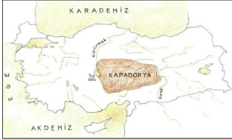
Şekil 1: Kapadokya Bölgesi Sınırları, (Sözen, 1998, s. 105)

Kapadokya Bölgesinin önemli bir yerleşimi olan Ürgüp sınırları ise, doğuda Kayseri, güneyde Niğde, kuzeyde Avanos yerleşimleri ile çevrelenmiş olup, Nevşehir ilinin 20 km doğusunda yer almaktadır (Anonim, 1983, s. 61) (Şekil 2).