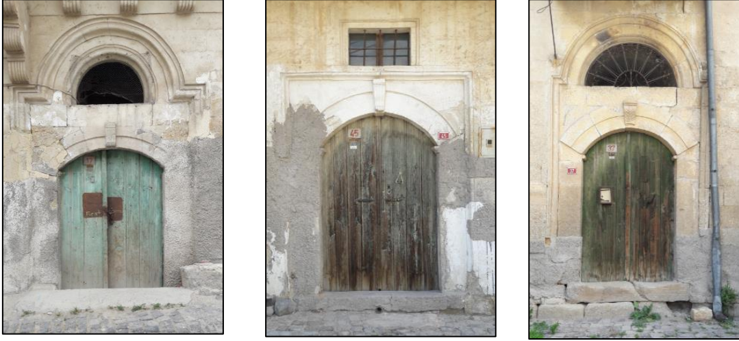
Şekil 5: Konuttan Doğrudan Sokağa Açılan Kapılar, Dereler Mahallesi, Ürgüp

Bu kapılar dış mekanda doğrudan sokağa açılırken evin içerisinde ise aralık 7 adı verilen mekana açılmaktadır. Bu kapılarında anıtsal nitelikli olduğu ve avlu kapıları ile benzer özellikler gösterdiği görülmüştür. Çalışmada incelenen 81 kapıdan 12 tanesi doğrudan sokağa açılmaktadır (Şekil 17-18). Doğrudan sokağa açılan kapı örneklerinde oval, dikdörtgen, dairesel tepe penceresi kullanımları bulunmaktadır. Avlu kapılarına oranla daha küçüktürler (Şekil 5).