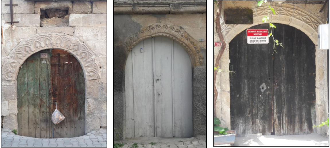
Şekil 12: Geometrik Desenlerle Tasarlanan Dış Kapı Örnekleri

Ürgüp evlerinin dış kapı taş bezemelerinde az sayıda da olsa geometrik motifli bezemeler mevcuttur. Çalışmada incelenen altı kapıda zikzak, üçgen, yarım daire, yıldız motifleri ile tasarlanmış kompozisyonlar görülmektedir (Şekil 12).