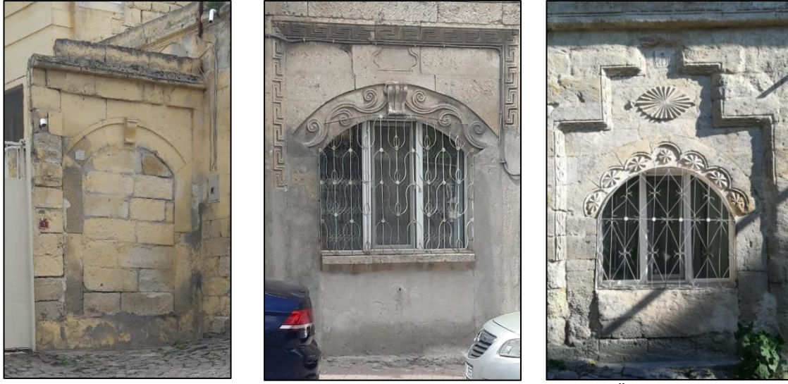
Şekil 15: Kapatılan veya Pencereye Dönüştürülen Giriş Kapısı Örnekleri

Bu yanlış uygulamalardan diğeri ise koruma bilincine sahip olamayan kişilerin kapıları özgün durumları dışında kullanarak kapatmaları veya pencereye dönüştürmeleri şeklinde olmuştur (Şekil 15).