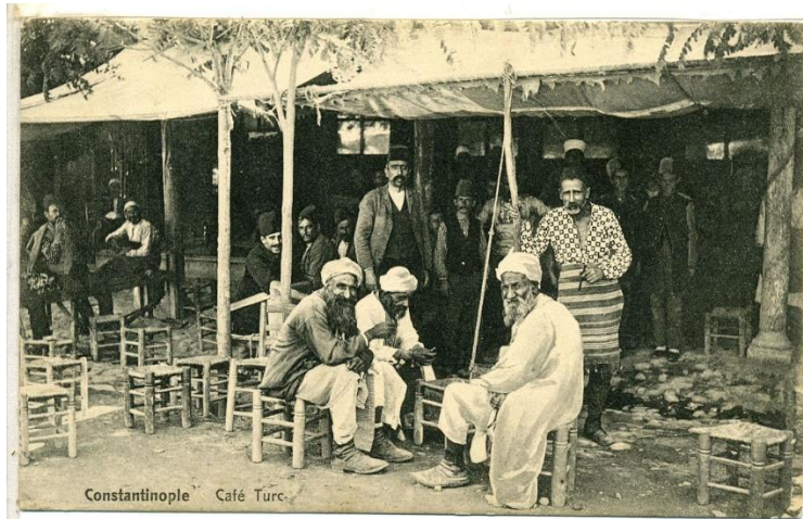
Resim 1. İstanbul'da geleneksel kahvehane (İ.B.B. Atatürk Kitaplığı, Krt_001946)

20. yüzyılın başında yapılan tespitler İstanbul'da mahalle aralarında veya cami yanında yer alan geleneksel kahvehaneler dışında Batı ülkelerindeki otellerin yemek salonlarıyla aynı kategoride tutulacak otel ve han kahvehanelerinin ortaya çıktığını göstermektedir. Müdavimlerine göre kahvehaneler nitelik kazanmış, küçük tüccar ve mütevazı sınıfların devam ettiği mekânlar haline gelmiştir (Deaver, 1995, s. 225-226). Modernleşme ile geleneksel eğlence anlayışındaki yapının değişimi bazı kahvehanelerin gazinolara dönüşerek yeni eğlence mekânlarına dâhil olmasını gerektirmiştir. Tanzimat'tan sonra kimi örnekler kahvehane-gazino ya da meyhane-gazino arasındaki ayırım kesinleşmeden ikili bir yapı içinde faaliyet göstermiştir (Gürbüz, 2020, s. 11). Çalgılı kahveler ile çalgılı ve şarkılı gazinolar arasında fonksiyon bakımından önemli bir fark yoktur. Bu mekânların çoğu, gündüz kahve, gece de meyhane ve çalgılı gazino olarak kullanılmaktadır. Aynı zamanda bir kısmı birahane olarak kullanılır ve böyle anılırdı (Aliji, 2019, s. 21). N. Meriç'e göre modernleşmeyle birlikte kahvehanelere müziğin girmesi kahvehanelerin "gazino" olarak adlandırılmasına neden olmuştur (Meriç, 2010, s. 143, 384-385).