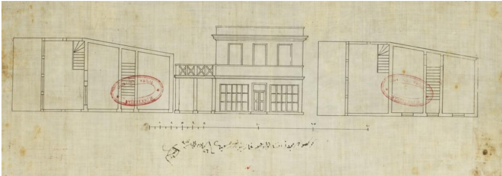
Resim 5. Göksu'da müceddeden inşa olunacak gazinonun resmidir. Fi 26 Kanunuevvel sene [1]307/7 Ocak 1892 (BOA., PLK.p., Dosya no: 242).

Arşiv belgelerinde çizimleri bulunan Göksu için tasarlanan bir gazino örneği yapının üst ve alt katında oluşturulan terasta oturma birimlerinin düzenleneceğini düşündürür. Böyle bir durumda yapının uzantısı olan alanların organize edilerek gazino için kullanıldığı söylenebilir (Resim 5) (BOA., PLK.p., Dosya no: 242). Eski Mühürdar Gazinosu böyle bir kullanıma örnek gösterilebilir. Bu gazino Moda'ya yakın bir yamaçta sona eren Mühürdar Caddesi'nin sonunda ve sol yanında orta büyüklükteki bir caddede kurulmuştur. Caddenin sağında ve denize bakan sırtta gazinonun kapalı büfesi ile birkaç masalık çıkması bulunmaktaydı (Giz, 1998, s. 62).