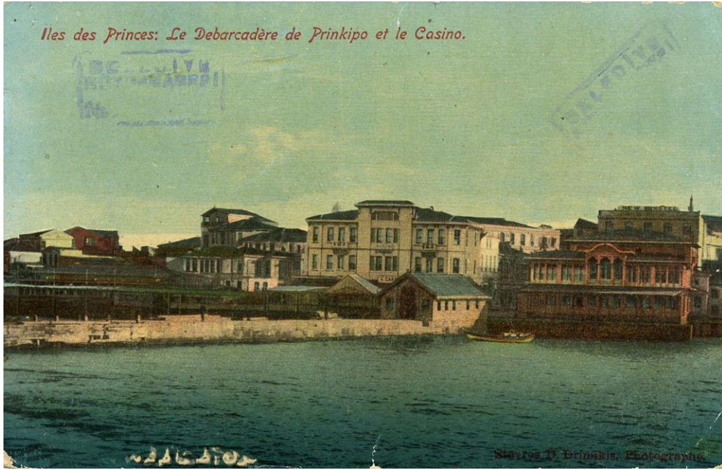
Resim 4. 1910 yılına ait bir kartpostalda Büyükada'da gazino.

Arşiv belgelerinde çizimleri bulunan Göksu için tasarlanan bir gazino örneği yapının üst ve alt katında oluşturulan terasta oturma birimlerinin düzenleneceğini düşündürür. Böyle bir durumda yapının uzantısı olan alanların organize edilerek gazino için kullanıldığı söylenebilir (Resim 5) (BOA., PLK.p., Dosya no: 242). Eski Mühürdar Gazinosu böyle bir kullanıma örnek gösterilebilir. Bu gazino Moda'ya yakın bir yamaçta sona eren Mühürdar Caddesi'nin sonunda ve sol yanında orta büyüklükteki bir caddede kurulmuştur. Caddenin sağında ve denize bakan sırtta gazinonun kapalı büfesi ile birkaç masalık çıkması bulunmaktaydı (Giz, 1998, s. 62).