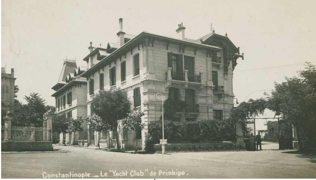
Resim 2. Büyükada Yat Kulübü (İ.B.B. Atatürk Kitaplığı, Krt_026501)

Anlaşılabileceği gibi gazinolar; meyhane, kahvehane, kulüp gibi pek çok yapının işlevleri ile birbirine karışan bir ortamda faaliyetlerini sürdürmüşlerdir. 19. yüzyılda batılı biçimdeki eğlence anlayışının yaygınlaşması halkın gazinolara ilgisini de arttırmıştır. Gazinolar özellikle içinde satılan müskirat sebebiyle oldukça fazla gelir getiren bir mekân olarak çoğu girişimcinin ilgisini çekmiştir. Buna rağmen devletin sıkı kontrolü altında tutulan gazinolarda içki satma hakkının kolaylıkla elde edilemediği bilinmektedir. Gazinoların varlık gösterdiği mekânlar ve açılış-kapanış saatleri ile eğlenceler sıkı bir denetime tabi tutulmaktadır. Bu makalede, batılı eğlence anlayışının ilgi çekiciliği ile bu ilgiyi kontrol etmeye çalışan yönetimin kararları arasında kalan Osmanlı gazinolarının mekânlarının ve eğlencelerinin neler olduğu ve ne tür müdahalelere uğradığı arşiv belgeleri bağlamında değerlendirilmiştir.