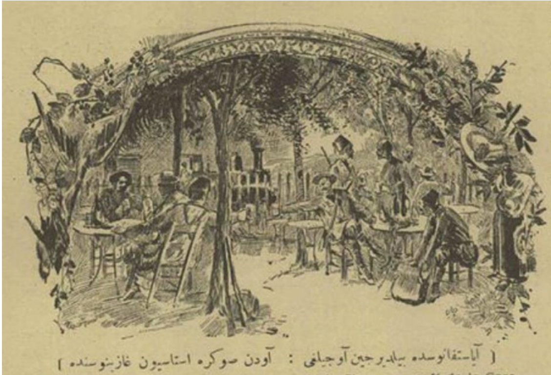
Resim 3. Yeşilköy'deki İstasyon Gazinosu'na ilişkin bir canlandırma resmin altında "Ayastefanos'da bildircin avcılığı: Avdan sonra istasyon gazinosunda" yazmaktadır (Servet-i Fünun, S. 394, 1898, s. 53).

görünümlü kısıtlı imkânlarla oluşturulmuş mekânlardır. Mutfak işlevi gören kapalı derme çatma bir baraka ile genelde çamların altına serpiştirilmiş tahtadan dört köşe küçük masalar, tahtadan iskemlelerden meydana gelen çitlerle çevrilmiş alanlardır. Çoğu kır gazinosunda laterna adı verilen ayaklı sandık biçimine, programlanmış melodiler çalabilen, bir kol vasıtasıyla kurulabilen mekanik bir çeşit çalgı ile bir dans pisti bulunurdu. Laterna İtalyan kökenli bir müzik aleti olup ilk defa 19. yüzyıl sonlarında Levantenler tarafından İtalya'dan getirilerek Bankalar Caddesi'ndeki mağazalarda satılmaya başlamıştır. 20. yüzyıl başlarından itibaren bu çalgının İstanbul'da ve Büyükkada'da çok rağbet görmüş olduğu düşünülmektedir (Akpınar, 2017, s. 95). Büyükkada'da eski kır kahvesi ya da gazinosu olarak kullanılan mekânlar bulunmaktadır (Resim 4). Bunlardan bazıları Dil Gazinosu (1-2), Aya Yorgi Gazinosu, Hristos Gazinosu, Belvü Gazinosu, Manol'un Gazinosu'dur 7 . Bazı gazinolar otellerle birlikte anılmaktadır ve otellerin parçası olarak hizmet vermiştir. Söz gelimi, Belvü Otel ve Gazinosu, Kadıköy'ün gazino olmaya en uygun yerine kurulmuştur. Fenerbahçe Yarımadası'nın girişinde ve Kalamış Koyu üzerinde dar, ancak düzgün bir bahçesi ve ahşap bir otel binası bulunmaktaydı (Giz, 1998, s. 62).