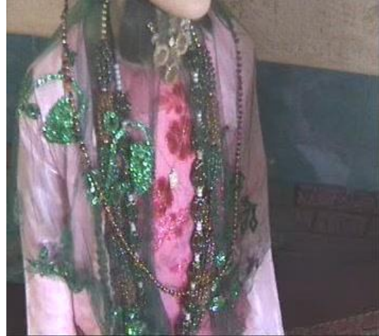
Geleneksel giysileri ve takılarıyla Kaşkaylı kızlar.

Günümüzde Kaşkay Türklerinde kadınların ve erkeklerin giydikleri geleneksel giyimlerin yerini çağdaş giyimler almıştır. Geleneksel giyimleri daha çok tören veya özel günlerde görmek mümkündür.