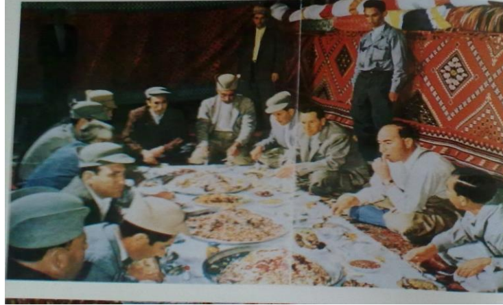
Kaşkay İlhanları bir İl yemeğinde. 4

İçecekler: Kaşkay ailesinin yaşantısında çay, en önemli içeceklerdendir. Çadırlarda veya çadır dışındaki ocaklarda sürekli Kaşkaylının çaydanlığında çay hazırdır. Kaşkay çadırında her zaman çay içmek mümkündür. Eskiden çeşitli törenlerde içmek için üzümden şarap hazırlarlardı. Ancak günümüzde bu içecek pek hazırlanmaz.