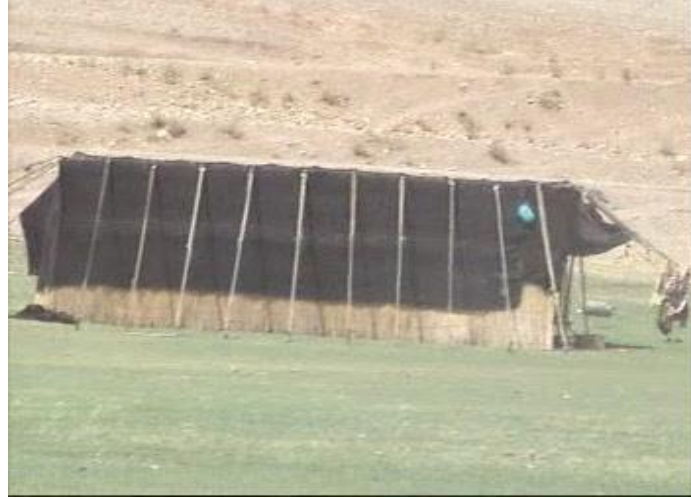
Kaşkay çadırı. (Muhittin Çelik. Özel Arşiv. 2005)