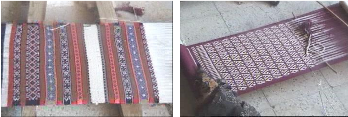
Dokuma tezgâhında bir cecim ve bir Kaşkay kilimi.

Kaşkay İlinde halı motifleri tayfa ve tirelere göre farklılıklar gösterir. Mesela, balık motifi, nazım, kirmani Keşküllü tayfasında sıkça görülür.