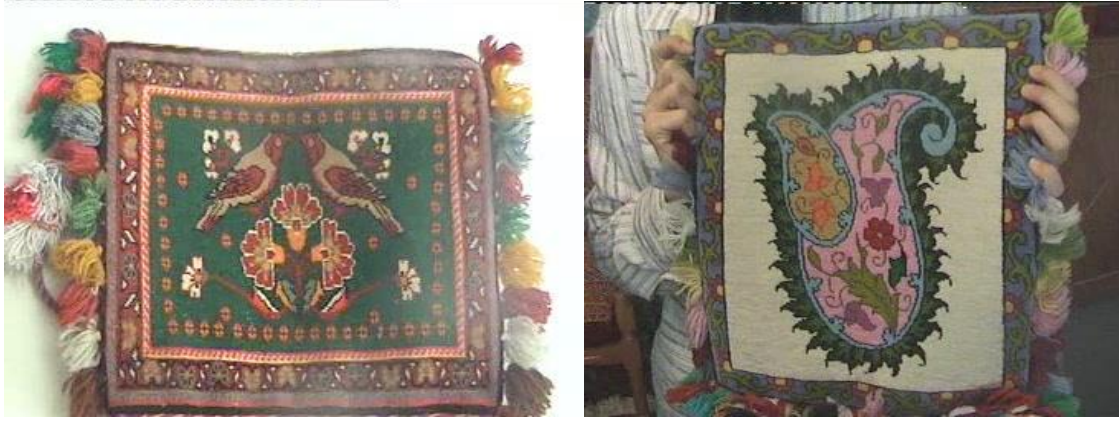
Kaşkay el dokuması çantalar.

Kaşkaylarda halı, kilim, cecim, çanta vb. dokumaları, atalarından kendilerine miras kalmıştır. Kaşkay halı ve kilimlerinin motifleri tarihi izler taşır. Kaşkay dokumalarında Orta Asya'nın izlerinin yanında Çin ve Safevi döneminin izlerine de rastlanır.