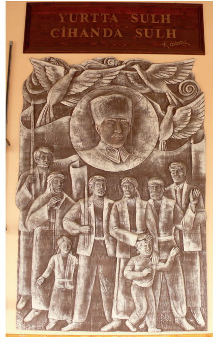
Pano6: “Yurtta sulh, cihanda sulh” Şamotoğlu Kil, Elle Şekillendirme, 192x 283 cm, 2008.

7.Pano: “Gözüm cepheye, kulağım İnebolu’da.” Milli Mücadele hareketi sırasında Batı Cephesi’nde askerî harekât devam ederken Kastamonu-Çankırı-Ankara hattı cephane ve askeri malzeme taşınmasında önemli bir güzergâh olmuştur. Mustafa Kemal Paşa bu sözünü Kastamonu’nun önemine vurgu yapmıştır (www.kastamonukulturturizm.gov.tr 2012).