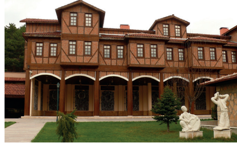
Resim1: Serender Otel'in genel görünümü

Bu makalede Adalet Bayramoğlu'nun Atatürk konulu panoları ele alınmıştır. Bu panoların her biri Atatürk'ün sözleriyle ilgilidir. Atatürk'ün çeşitli alanlarda yaptıkları Bayramoğlu'nun gözünde kendi sanatsal üslubuyla şekil bulmuştur. Aslında Atatürk'ün sözleri bu panolarla yazılı kaynaklardan çıkararak görselleştirilmiştir. Bu panolar Mimar Vedat Tek Kültür Merkezi ziyaretçileri ve Kastamonu halkı için Atatürk'ü hatırlatmakta ve Türk gençliğine bıraktığı emanetin geçirdiği zorlukları tekrar gözler önüne sererek canlandırma fırsatı sağlamaktadır. Bu yönüyle panolar tarihi ve panoramik olarak değerlendirilebilir. Böyle bir konunun seramik malzemesi olan kil ile çalışılmış olması seramik sanatı açısından da önemlidir.