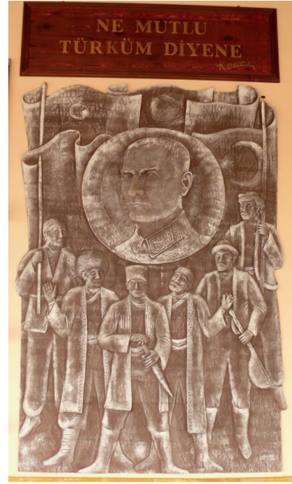
Pano5: “Ne mutlu Türküm diyene” Şamotoğlu Kil, Elle Şekillendirme, 194x282 cm, 2008.

6.Pano: “Yurtta sulh, cihanda sulh.” 20 Nisan 1931’de seçim dolayısıyla Atatürk’ün yayınladığı beyannamede dile getirilmiştir. “Cumhuriyet Halk Fırkasının müstakar umumî siyasetini şu kısa cümle açıkça ifadeye kâfidir zannederim: Yurtta sulh, cihanda sulh için, çalışıyoruz.” Bu söz, Atatürk dönemi Türk dış politikasının temel ilkelerinden birisi olmuştur (Atatürk’ün Tamim, Telgraf ve Beyannameleri IV, 1991:608).