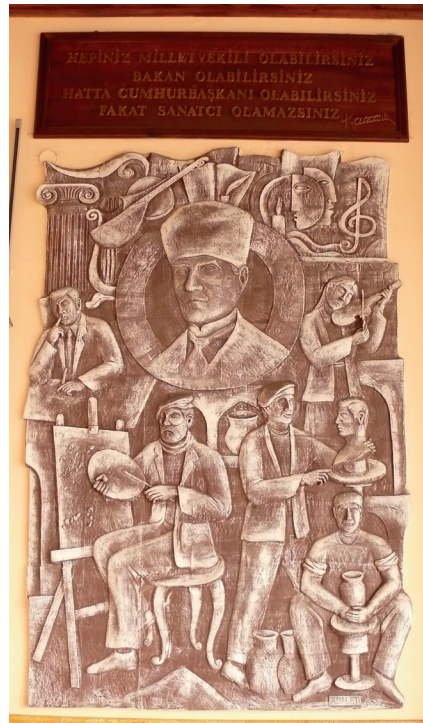
Pano2: “Hepiniz milletvekili olabilirsiniz, bakan olabilirsiniz, hatta cumhurbaşkanı olabilirsiniz fakat sanatçı olamazsınız” Şamotlu Kil, Elle Şekillendirme, 193x280 cm, 2008.