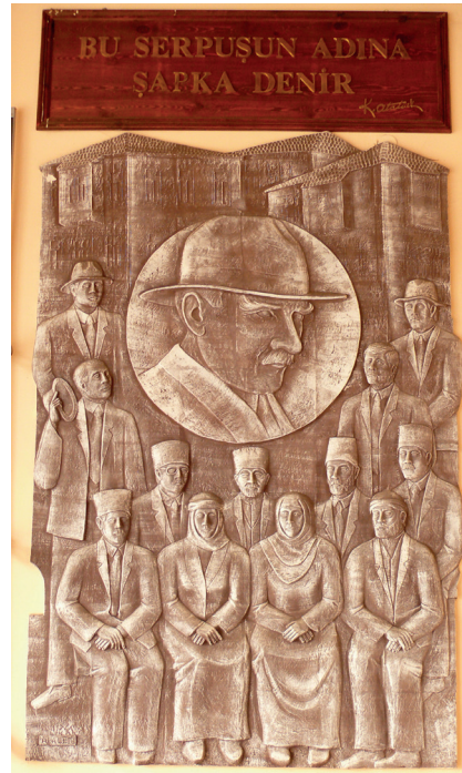
Pano12 “ Bu serpuşun adına şapka denir ” Şamotlu Kil, Elle Şekillendirme, 195x290 cm, 2008.

13.Pano: “ Hayatta en hakiki mürşit ilimdir. ” Bu söz, 22 Eylül 1924 tarihinde Samsun İstiklâl Ticaret Mektebi’nde öğretmenler tarafından verilen bir çay ziyafetindeki konuşması sırasında söylenmiştir. Atatürk’ün konuşmasının ikinci paragrafını oluşturan cümle şu şekildedir: Efendiler! Dünyada her şey için, medeniyet için hayat için, muvaffakiyet için en hakikî mürşit ilimdir, fendir (Atatürk’ün Söylev ve Demeçleri, 1997:202).