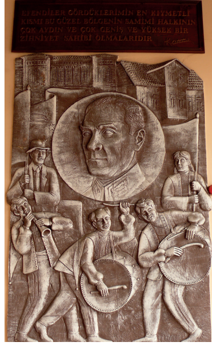
Pano1: “Efendiler gördüklerimin en kıymetli kısmı bu güzel bölgenin samimi halkının çok aydın ve çok geniş ve yüksek bir zihniyet sahibi olmalarıdır” Şamotlu Kil, Elle Şekillendirme, 194x290 cm, 2008.

3.Pano: “ Ya istiklâl, ya ölüm. ” Mondros Mütarekesi'nden sonra Atatürk'ün daha İstanbul'dan çıkmadan önce düşündüğü ve Samsun'da Anadolu topraklarına ayak basar basmaz uygulamaya başladığı mücadele kararını ifade eden sözüdür (Atatürk, 2009:39).