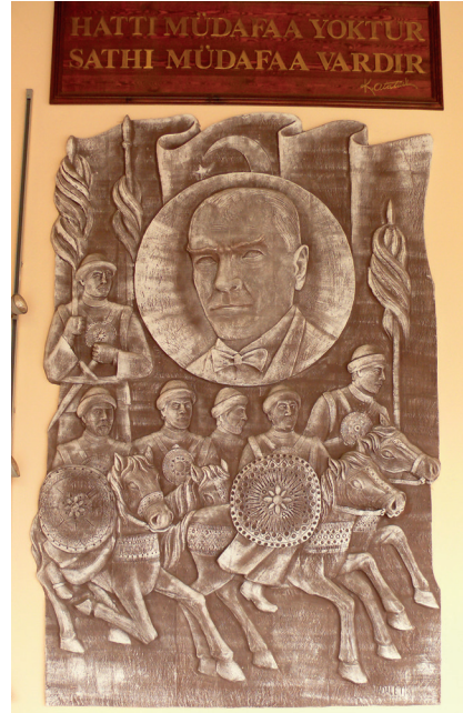
Pano11: “ Hattı müdafaa yoktur, sathı müdafaa vardır ” Şamotlu Kil, Elle Şekillendirme, 194x282 cm, 2008.

11.Pano: “ Hattı müdafaa yoktur, sathı müdafaa vardır. ” Sakarya Savaşı sırasında Sakarya Nehri doğusunda uygulanan askerî harekât mevzi savunması şeklindeydi. Atatürk bu sert savunma ilkesini bir ölçüde yumuşatmış fakat aynı zamanda bu tür askerî harekâttan beklenen amacı koruyan bir ilke geliştirerek, “ Hattı müdafaa yoktur, sathı müdafaa vardır. O sathı bütün vatandır ” Sözüünü söylemiştir (İlhan, 1987).