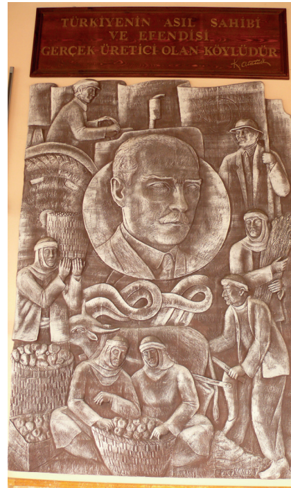
Pano4: “Türkiye'nin asıl sahibi ve efendisi gerçek üretici olan köylüdür” Şamotlu Kil, Elle Şekillendirme, 195x287 cm, 2008.

5.Pano: “Ne mutlu Türküm diyene.” Atatürk'ün Cumhuriyetin onuncu yılında, 29 Ekim 1933 tarihinde, Ankara'daki büyük törende yaptığı konuşmasından alınan bir sözüdür. Atatürk'ün Onuncu Yıl Nutku “Türk milleti! Ebediyete akıp giden her on senede, bu büyük millet bayramını daha büyük şereflerle, sadetlerle, huzur ve refah içinde kutlamamı gönülден dilerim. Ne mutlu Türküm diyene” cümleleriyle bitmektedir (Atatürk'ün Söylev ve Demeçleri, 1997:319).