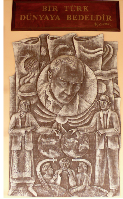
Pano9: “Bir Türk dünyaya bedeldir” Şamotlu Kil, Elle Şekillendirme, 190x280 cm, 2008.

10.Pano: “Türkiye Cumhuriyetini tesis eden Türk halkı medenidir, tarihte medenidir, hakikatte medenidir.” Atatürk'ün bu sözü 27 Ağustos 1925 tarihinde İnebolu Türk Ocağı binasında giyim ve şapka konusunda yaptığı konuşmadan alınmıştır. (Atatürk'ün Kültür ve Medeniyet Konusundaki Sözleri, 1990:89).