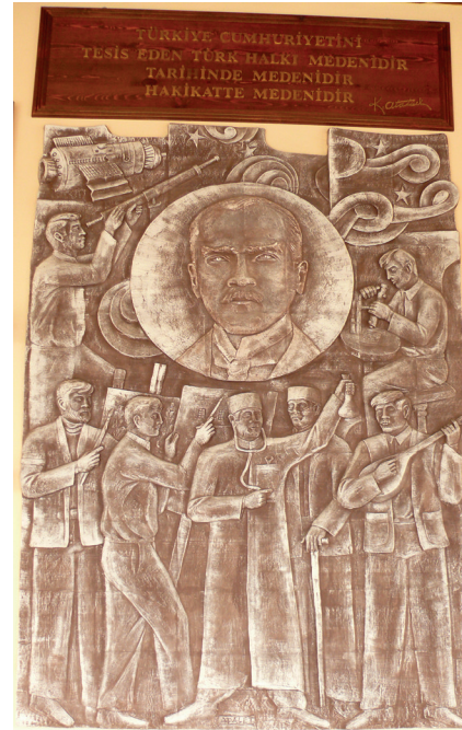
Pano10: “Türkiye Cumhuriyetini tesis eden Türk halkı medenidir, tarihte medenidir, hakikatte medenidir” Şamotlu Kil, Elle Şekillendirme, 194x288 cm, 2008.

11.Pano: “Hattı müdafaa yoktur, sathı müdafaa vardır.” Sakarya Savaşı sırasında Sakarya Nehri doğusunda uygulanan askeri harekât mevzi savunması şeklindeydi. Atatürk bu sert savunma ilkesini bir ölçüde yumuşatmış fakat aynı zamanda bu tür askeri harekâttan beklenen amacı koruyan bir ilke geliştirerek, “Hattı müdafaa yoktur, sathı müdafaa vardır. O sath bütün vatandır” Sözüünü söylemiştir (İlhan, 1987).