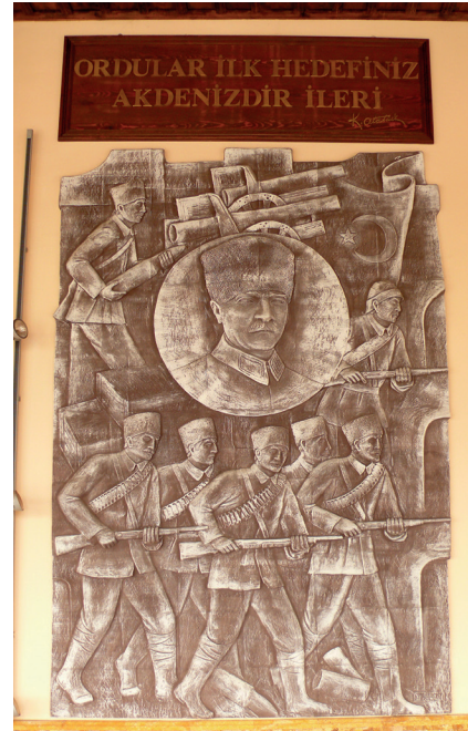
Pano8: "Ordular! İlk hedefiniz Akdeniz'dir, ileri!" Şamotlu Kil, Elle Şekillendirme, 194x282 cm, 2008.

9.Pano: "Bir Türk dünyaya bedeldir." 1925 yılında Atatürk'ün Kastamonu seyahati sırasında Kışla binasına yaptığı ziyarette söylenmiştir. Kışlaya uğramış ve koşulları gezerken bir koğuştaki levha üzerine yazılmış "Bir Türk on düşmana bedeldir", sözünü görmüştür. Bunun üzerine sert bir sesle, "Hayır! Bir Türk dünyaya bedeldir" demiştir (Atatürk İçin Anlatılanlar, 1987:38).