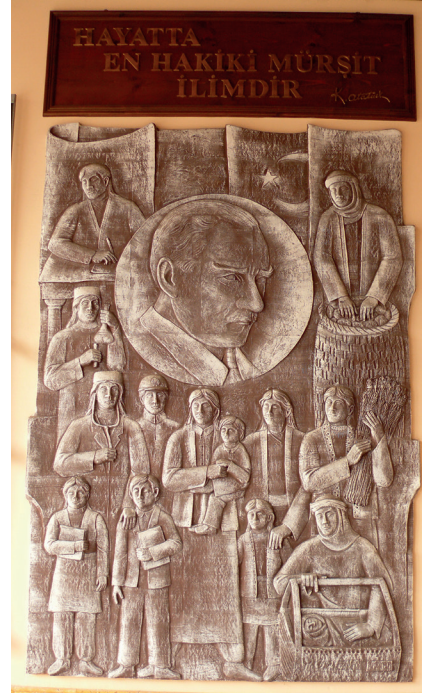
Pano13: “Hayatta en hakiki mürşit ilimdir” Şamotlu Kil, Elle Şekillendirme, 195x282 cm, 2008.