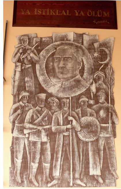
Pano3: “Ya istiklâl, ya ölüm” Şamotlu Kil, Elle Şekillendirme, 194x280 cm, 2008.

4.Pano: “Türkiye'nin asıl sahibi ve efendisi gerçek üretici olan köylüdür.” Atatürk 1 Mart 1922 tarihinde, TBMM'nin üçüncü toplanma yılını açarken yaptığı uzun konuşmada “Türkiye'nin sahibi ve efendisi kimdir?” diyerek bir soru sormuş ve cevap olarak da köylüyü milletin efendisi olarak tanımlamıştır (Atatürk'ün Söylev ve Demeçleri, 1997:240).