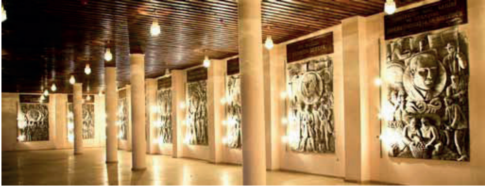
Resim3: Panoların genel görünümü

Seramik panolar, aşağıda sırasıyla, ön ve arka yapı elemanları ile değerlendirilmektedir. Arka yapı elemanı olarak içerik, ön yapı elemanları olarak kompozisyon, biçim, renk, perspektif, ışık-gölge, doku, hareket, boşluk-doluluk, denge, ritim olarak tek tek ele alınmaktadır.