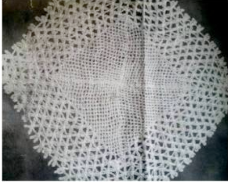
Şekil 1. Sabriye Arpaözü'nün çalışması; 130X160 cm. boyutlarında, Yeni Zelanda merinos yünü ve tiftik el örgüsünün birlikte kullanıldığı tepme keçe yaygı (Küçükkurt, 2014).

tekniklerini değişik materyalleri kullanarak geliştirmiş, örneğin; dantel, örgü gibi teknikleri geleneksel tepme keçe ile birleştirerek, sanatına yeni bir boyut kazandırmıştır (Şekil 1 ve 2).