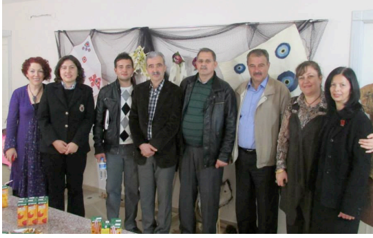
Şekil 8. Kasım 2013 de Topak Ev Sanat Grubu'nun açmış olduğu "Attık Yün Oldu Teptik Keçe Oldu" sergisinde Afyonkarahisar keçe ustaları ve sanat grubunun bazı üyeleri (Küçükkurt, 2013).