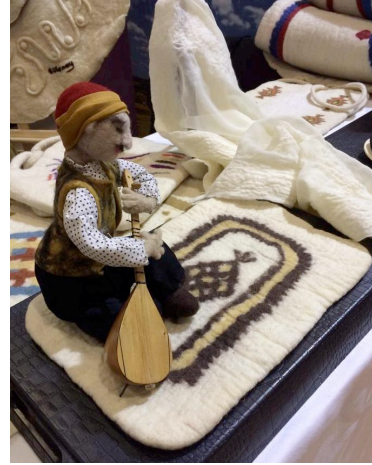
Şekil 6. Yalçinkaya'nın "Aşık" çalışması. Yükseklik 15cm. Yeni Zelanda merinos yünü. İğneli ve tepme keçe (Küçükkurt, 2014).