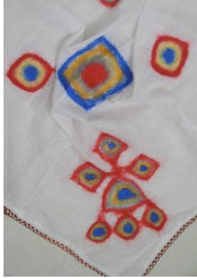
Şekil 16. Ülkü Küçükkurt. Saçbağı. 70x70cm. Yeni Zelanda merinos yünü ve tülbent. Tepme keçe (Küçükkurt, 2012).