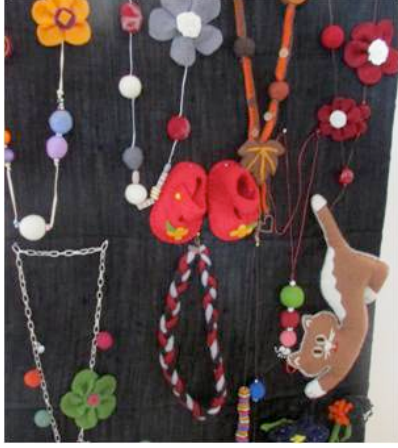
Şekil 10. Dilek Lökçü Yılmaz; çeşitli keçe takı ve oyuncaklar (Küçükkurt, 2013).

sınıfına sokamayız fakat keçe ile daha çok insanın tanışması, böylece keçeciliğin tanıtılması ve yaşatılması adına katkı sağladığı göz ardı edilemez bir gerçektir.