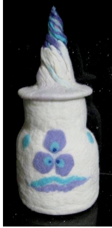
Şekil 5. Yalçinkaya'nın, Yeni Zelanda merinos yünü ile yaptığı 15X35 cm boyutunda boyutlu tepme keçe çalışması (Yalçinkaya, 2012).