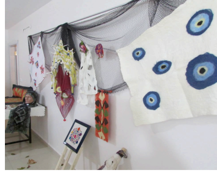
Şekil 9. "Attık Yün Oldu Teptik Keçe Oldu" sergisinden (Küçükkurt, 2013).