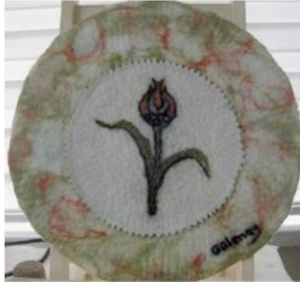
Şekil 7. Yalçinkaya, lale pano. Çapı:35cm. Yeni Zelanda merinos yünü. Tepme ve kertikli keçe (Küçükkurt, 2014).

Geleneksel Tepme keçe ile ilgilenen dokuz hanımın 2013 yılında kurduğu, "Topak ev sanat grubu" faaliyetlerine devam etmektedir. Yaptıkları çalışmaları çeşitli sergilerde ve fuarlarda izleyicileriyle paylaşan grup üyeleri, keçe eğitmenliği de yapmaktadır. Grup, Afyonkarahisar geleneksel keçe üretiminin tanıtılmasına, yaşatılmasına katkıda bulunmaktadır (Şekil 8, 9).