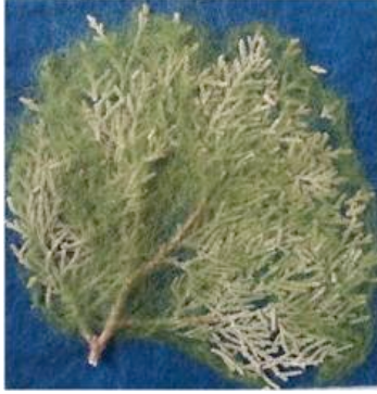
Şekil 14. Topak ev sanat grubu; Şükran Ercan; Dallar ve yünün birlikteliği. 15x15cm. Yeni Zelanda merinos yünü. Tepme keçe (Küçükkurt, 2014).