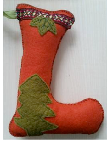
Şekil 11. Şükran Ercan; keçe oyuncak (Küçükkurt, 2015).