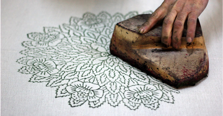
Resim 3. Yazmacılık sanatında ahşap baskı

Mermerşahi veya tülbent şeklinde adlandırılan pamuklu dokumadan 84 x 84, 90 x 90 ve 100 x 100 cm. gibi ebatlarda kare şeklinde kesilerek yapılan yazma, Anadolu'da çeşitli şekillerde tanımlanmıştır. 25 Türk kadınlarının inançları ve inançlarının şekillendirdiği gelenekleri çerçevesinde süsleyerek kullandıkları yazmayı, eskiden erkekler de feslerinin altında kullanırlardı. Çit, yemeni, çevre, çember gibi isimlerle tanımlanan yazmaya, eskiden püşide denmişse de en çok kullanılan yemeni kelimesi olmuştur. 26 Kelime anlamını Pakalın; "alaca boyalı, üzerine kalıpla renkli çiçek resimleri basılmış ince bez ve yazma çenber adıdır. Vaktiyle Yemen ve Hind'de yapıldıkları için bu adı almıştır" şeklinde açıklar. 27