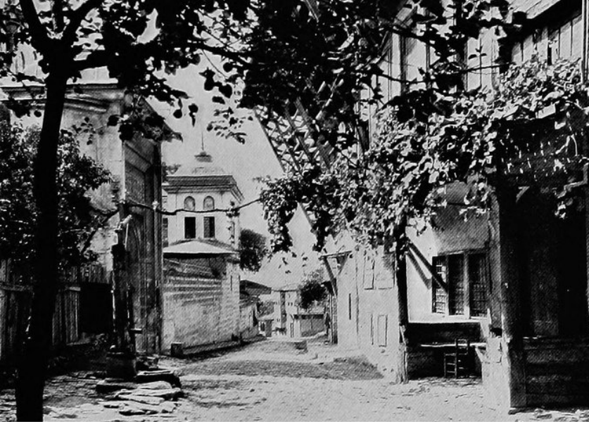
Resim 1. 20. yüzyıl başında Ayazma Camii karşısında Basmahane. (Dwight, 1915, 213-215).

Acıpınar, 1775 tarihli bir belgeye istinaden basmahanenin üç katlı, kârgir ve kemerli kapısıyla otuz oda ve beş mahzenden oluşan bir yapı olduğunu tespit etmiştir. Çalışmasında verdiği bilgilere göre yaklaşık 2.500 zirâlık bir arsa üzerine kurulan bina, Ayazma Camii civarında yer almaktaydı. 1894 depreminde yıkılınca, yerine yenisi yapılan bu basmahanenin Ayazma Camii'nin sol tarafında, bugünkü Mehmet Paşa Değirmeni Sokağı ile Tulumbacılar Sokağı arasında yer aldığını da ifade eden Acıpınar, Haskan'ın tespiti ve vakfiyede geçen ifadelerle basmahanenin gerçekten bu alanda kurulduğunu teyit etmektedir. 11 Dwight'ın 20. yüzyıl başında bu lokasyonda çektiği ve basmahaneyi işaret ettiği fotoğraf da uzun bir süre burada bulunduğunu göstermektedir.