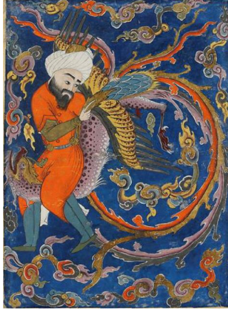
Görsel 3: Bukrat'ın (Hipokrat) Simurg tarafından Kaf Dağı'na taşınması, Falaṅame, 1604-17, TSMK, H. 1703, 38b. (Çakmakçı, 2011: 212).

bahsedilmektedir. Burada Bukrat, Simurg'un sırtında tasvir edilmiştir. Kaf Dağı'nın erişilmez yerlerine ilaç için şifalı otları bulmaya gitmektedir (And, 2008: 322; Doğan, 2019: 35).