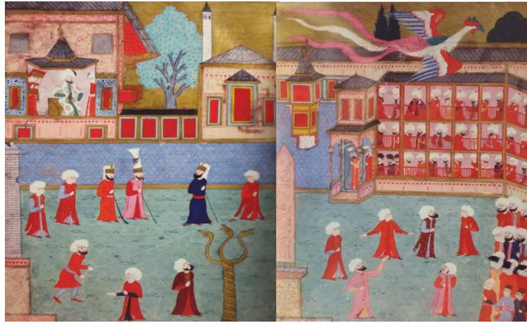
Görsel 1: Simurg biçiminde bir kuş uçurtması, Surname-i Hümayun, 1582, TSMK (Doğan, 2019: 88).

Hümâ kuşunun, gölgesinin üzerine düştüğü kişinin padişah olacağına dair duyulan inanç önemlidir. Hümâyûn kelimesinin hükümdar ve padişah anlamını kazanması devlet kuşu adıyla da bilinen Hümâ ve gölgesiyle ilgili inançlardan kaynaklanmaktadır. Devlet kuşu, cennet kuşu, talih kuşu adıyla da bilinen hümâ kuşu mutluluğun, devletin, hükümdarlığın simgesi kabul edilir. Bazı Türk lehçelerinde Kumay, Umay şeklinde de kullanılır (Batıslam, 2002: 187). Eski Türklerin Umay anası ile ilişkili olup olmadığı ise tartışmalı bir konudur.