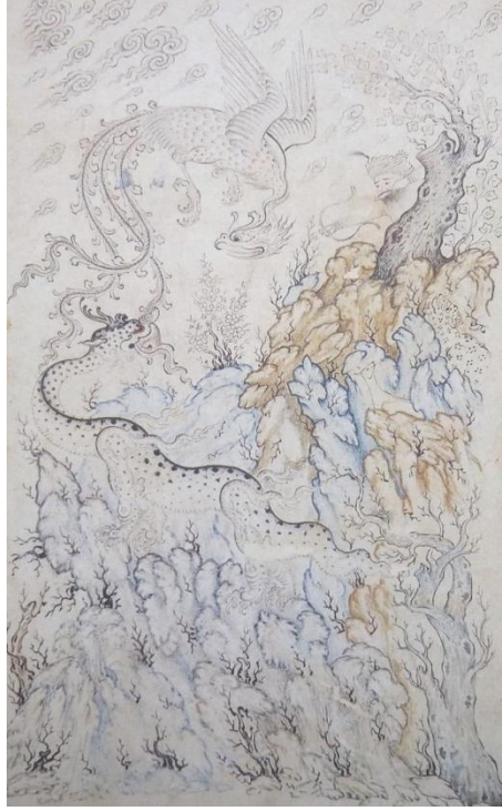
Görsel 2: Simurg ve Ejder mücadelesi, 1630-40, TSMK, H. 2163, f. 2. (Doğan, 2019: 86)

Simurg ile Ejder mücadelesi bilhassa Zerdüşt geçmişe sahip İran kültüründe iyi ile kötünün amansız mücadelesini temsil etmektedir. Mücadele sahnesiyle ilgili olarak Simurg motifinin minyatürler dışında çini, porselen, ahşap, maden, kilim gibi eserlerde de işlendiği bilinmektedir (Çakmakçı, 2011: 141).