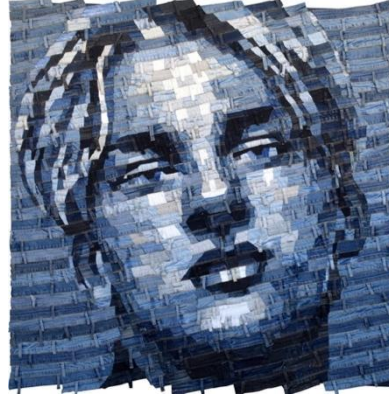
Görsel 8. Deniz Sağdıç, İsimsiz , Denim Pantolon Kemer Parçaları, 140 cm x 140 cm, (Sağdıç, Sanatçının arşivi, 2021)

Görsel 8'de yer alan portrede denim pantolonların kemer parçaları kullanılmıştır. Denim kemer parçalarının, göz yanılığine neden olacak bir düzen içinde sıralanması, eserde illüzyon etkisinin oluşmasına neden olmuştur.