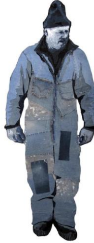
Görsel 6. Jim Arendt, Dad , 80 cm x 120 cm, (Arendt, Jim Arendt.Dad, 2014)

Görsel 6'da bulunan Dad isimli tablo Jim Arendt' in kendi babasının boydan resminin yeniden yorumlanmasıdır. Sanatçı, biyografisinde bahsettiği gibi işçi olan babasının üzerindeki işçi tulumunu, atık denim parçalarını bir araya getirilerek oluşturmuştur. Yer yer denim kumaşının eski ve yıpranmış görüntüsü, denim pantolonlarının arka kısmında bulunan applike cep detayları, işçi tulumunun sahip olduğu formu yansıtmaktadır. Görsel 5'deki lan tablosunda olduğu gibi, görsel 6' da bulunan Dad (Baba) tablosundaki yüz de detaylı bir şekilde atık denimlerle çalışılmıştır.