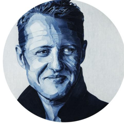
Görsel 2. Ian Berry, Michael Schumacher , 2019, Denim Üzerine Denim, 120 cm x 120 cm, (Berry, Michael Schumacher, 2021).

Senna ailesinin 1 denim pantolonları ile Ayrton Senna Sempres'nin ölümünün 20. yılının anısına oluşturulan portresi, denim üzerine denim parçalarının yerleştirilmesi ile oluşturulmuştur (Feeldesain, 2015). Sanatçı bir araya getirdiği atık denim giysileri parçalayarak renk ve ton farklılıklarına göre ayırarak, portre çalışmasına uygun parçaları bir araya getirmiştir (Görsel 1). Berry, portre çalışmalarının yanı sıra, atık denim giysilerden oluşturduğu Hotel California projesi gibi çeşitli eserlerin yer aldığı sergiler ve üçboyutlu enstalasyonlara sahiptir. Sanatçı, denim giysi atıklarını eserlerinde iki ve üç boyutlu formlarda ele alarak değerlendirmiştir.