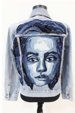
Görsel 7. Deniz Sağdıç, Tenim Denim , 2019, 50 cm x 60 cm, (Sağdıç, Başkalaşım, 2019:34)

AndAgain X Deniz Sağdıç Kapsül koleksiyonu üç parça ceketten oluşmaktadır. İstanbul' da elle uygulanan aplikeleri; sanatçı New York' ta diktirmiştir (Sağdıç, Deniz Sağdıç, 2021). Sağdıç'ın giyilebilir sanat eserleri olarak tanımladığı bu ceketlerin bir benzeri olan isimsiz bir eseri de Başkalaşım Uluslararası sergisinde yer almıştır (Görsel 7). Sağdıç bu eserde, denim ceket üzerine dikilmiş atık denim parçalarını kullanmıştır (Sağdıç, Başkalaşım, 2019:34).