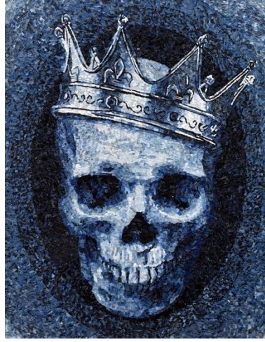
Görsel 12. Deniz Sağdıç, King , Kanvas Üzerine Mozaik Yöntemi ile Atık Denim Parçaları, 180 cm x 140 cm, (Sağdıç, Sanatçının arşivi, 2021)

Görsel 12’de yer alan “King” yapıtında, Türkiye’deki tarihi kalıntılarda sıklıkla karşımıza çıkan mozaik, denim atıkları ile potreye uyarlanmıştır. Kafatasının koyu denimler üzerine yerleştirilmesi, esere derinlik katmıştır. Mozaik etkisi kafatasının çevresindeki oval bölümde daha net görölmektedir.