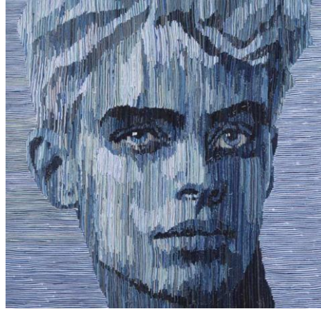
Görsel 9. Deniz Sağdıç, Tenim Denim , 2019, 100 cm x 100 cm, (Sağdıç, Başkalaşım, 2019: 33)

Görsel 8'de yer alan portrede denim pantolonların kemer parçaları kullanılmıştır. Denim kemer parçalarının, göz yanılığine neden olacak bir düzen içinde sıralanması, eserde illüzyon etkisinin oluşmasına neden olmuştur.