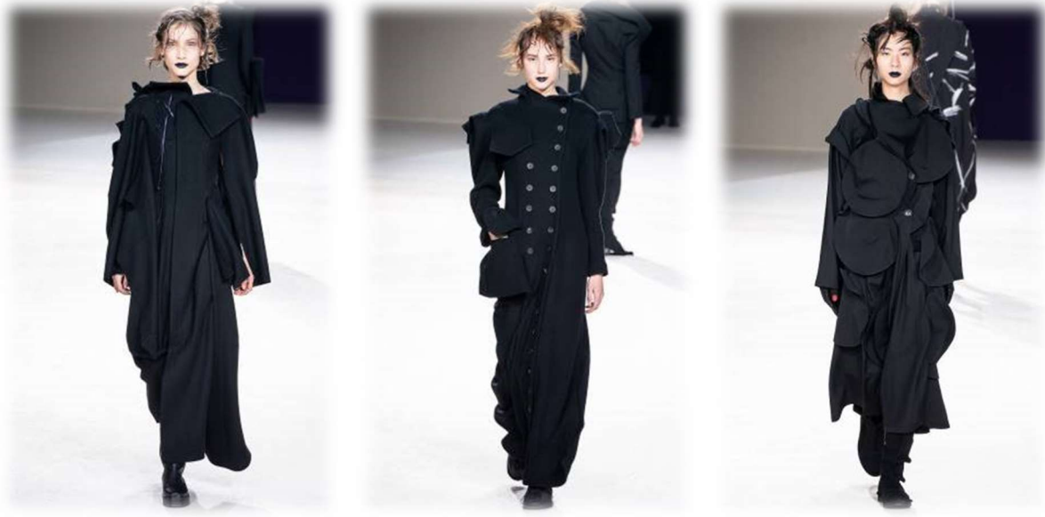
Resim 7. Yohji Yamamoto, Sonbahar 2019, Hazır Giyim Figure 7. Yohji Yamamoto, Fall 2019, RTW

Yamamoto'nun tasarladığı kıyafetlerdeki işlevsellik batı tarzının ötesinde estetik ve pratik bağlamda yeniliklerin ortaya çıkmasını sağlamıştır. Hangi tarihi dönemden bahsederseniz edelim, modanın belirleyici özü değişimdir. Moda süreci tarzların çeşitliliğini ve değişkenliğini açıklar (Kawamura, 2005).