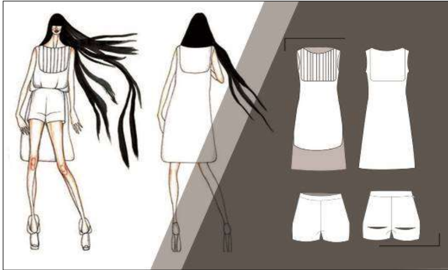
Şekil 3. Ayça Kaplan, 2021