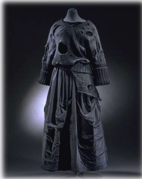
Resim 1. Rei Kawakubo/ Come Des Gorcons, Tokyo, 1982

İtalyan Tasarımı nasıl ki tasarımın ulusallaştırıldığı kült bir deyim ifade ediyorsa Japon Modası da aynı şekilde Yamamoto, Miyake, Kawakubo gibi isimlerle ulusallaşmıştır. Asimetrik, basit, hafif gibi sıfatlar; Japon moda tasarımcılarının Batı modasına bu anlamda getirdikleri öneme dikkat çekmektedir. Kawakubo tasarımlarında; gereksiz detaylardan arınarak kalanın güzelliğini dokularla sunan, temelini minimalizmden alan bir reddediş hedeflemektedir (Resim 1.).