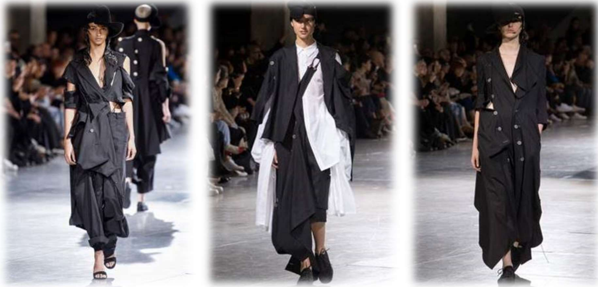
Resim 5. Yohji Yamamoto, İlkbahar 2018, Hazır Giyim Figure 5. Yohji Yamamoto, Spring 2018, RTW

Yamamoto'nun koleksiyonlarında siyah baskındır. Siyah rengi kendi ifade biçimiyle içselleştirmiş ve konuyla ilgili şunları söylemiştir: “Siyah kolay ve tembeldir, kibirli ve aynı zamanda mütevazıdır. Fakat bütün bunların ötesinde siyah ‘ben seni rahatsız etmiyorum, sen de beni etme’ der” (Terry, 2012). Siyah rengin baskın olduğu tasarımlarını bedeni gizlemek, cinsel kimliği ikinci planda bırakmak için kullanmaktadır. Yamamoto, onun tasarımlarını giyen kişiler ile kıyafetin kendisi arasında bir ilişki kurulduğunu düşünmektedir (Resim 5.). Tasarımlarında en çok önemseydiği şey, yaptığı form ve şekil değişikliklerinin karşı tarafa duygular ve fikirler olarak geçmesidir. Yohji Yamamoto, kullandığı kumaşlara da çok özen göstermektedir. Kumaş onun için her şey demektir. Yamamoto bu konudaki düşüncelerini “Çoğu zaman desen yapımcılarıma, ‘Sadece malzemeyi dinle, ne söyleyecek? Sadece bekle. Muhtemelen materyal sana bir şey söyleyecektir’ derim” şeklindeki sözleriyle açık bir şekilde ifade etmiştir (Marzel, 2012).