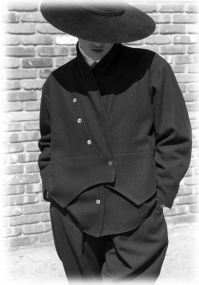
Resim 4. Yohji Yamamoto, Sonbahar, 1981, Paris