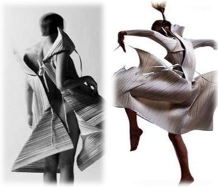
Resim 2. Issey Miyake, Pleats Please Serisi

kaynaklar ve enerji boşa sarf edilmemelidir. Tasarımları insanlar için olan bu tasarımcılara göre moda, araştırmadan ve geliştirmeden olamaz. İleri teknolojiyi işlerinde hakkını vererek kullanan ve özümsemiş bir toplumdaki gelen Japon tasarımcılar insanlık için kendi alanlarında faydalı noktalara ulaşmışlardır. “Tasarladıkları şekilsiz, bitmemiş giysiler, herkese kucak açabilecek kadar evrenselidir. Uzun-kısa, geniş-dar, beden, form, kesim, dikiş, pens, kup gibi detaylarda önyargılardan arınmıştır” (İşbilen, 2015). Yamamoto’nun siyahı cesurca ve kat kat, üst üste kullanışı, Miyake’nin pliseleri (Resim 2.) ve Kawakubo’nun kasıtlı delikleri “anti-estetik” olarak ifade edilirken, tasarım açısından ise, dahice, yenilikçi, farklı olarak nitelendirilmiştir. Japon tasarımcıların yarattıkları bu yeni akımlar, taviz vermeyen tutarlılıkları ve oldukça kararlı tavırları Japon tasarımını bir sonraki yüzyıla taşıyacak genç tasarımcılara örnek teşkil etmektedir (Kaya, 2004).