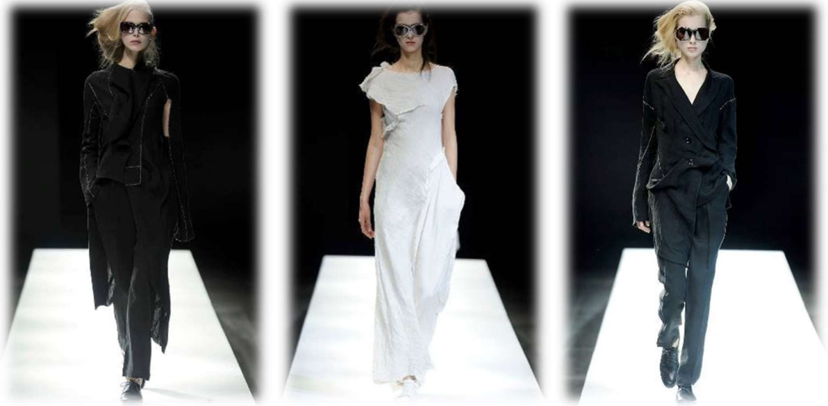
Resim 3. Yohji Yamamoto, İlkbahar 2009, Hazır Giyim Figure 3. Yohji Yamamoto, spring-2009, Ready to Wear

1980'li ve 1990'lı yılların ünlü tasarımcıları Miyake, Kawakubo ve Yamamoto; avangarde stratejileri sayesinde dünyanın en ünlü tasarımcıları arasında yer almışlardır. Moda sosyoloğu olarak bilinen Yuniya Kawamura Modaloji adlı eserinde, değişim ve yeniliğin modanın kapsadığı özellikler arasında olduğundan bahseder. Ona göre moda bilimi kurumların, tarz üzerinde eş zamanlı olarak yenilik yaratan değişimleri nasıl teşvik ettiğini ve bu değişimleri nasıl denetlediğini açıklamaya çalışır (Kawamura, 2005). Bu bağlamda 1980'li yıllarda 'Yeni Nesil' olarak adlandırılan Japon tasarımcıların ortaya çıkardıkları tasarımlar, moda dünyasında ciddi değişimlerin oluşmasına neden olmuştur. Bu tasarımlar ilk başta çok farklı çağrışımlara yol açsa da felsefi düzlemde farklı açılardan mesaj verme kaygısı taşımaktadırlar. Amerikan Vogue tarafından Nisan 1983'te yazılan makaleye kadar ciddi eleştirilerin odağı haline gelen Yamamoto ve Kawakubo avangart tasarımcılar olarak etkileri kabul edilince itibar kazanmışlar ve başarıları kabul görmüştür (English, 2011). Yamamoto tasarımlarında simetri-asimetri, ters-düz, yukarı-aşağı gibi tezat kalıplar üzerinden ilerlemiş ve puzzle gibi hareket ederek bütünü parçalara ayırarak tekrar birleştirmiştir (Resim 3.). Yamamoto'nun tasarımlarında avangart bir postmodernist etki bulunmaktadır.