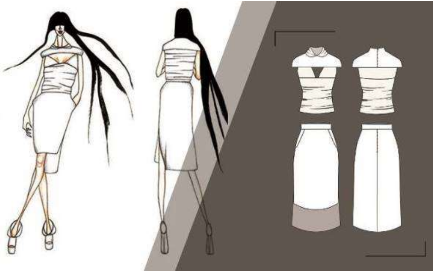
Şekil 1. Ayça Kaplan, 2021

Yamamoto'nun koleksiyonları incelenmiş ve tasarımlarındaki ifade biçimlerinden yola çıkarak avangart bir örnek koleksiyon hazırlanmıştır. Koleksiyonda, kalıp model uygulamalarında katmanlı kumaş kullanımları, standart kalıp tekniklerinde sıfır atık düşüncesiyle çevreye duyarlılık, benzersizlik, estetik çekicilik, kullanılabilirlik, dönüştürülebilirlik ve yapıbozum gibi ifade ilkeleriyle oluşturulan koleksiyon malzemelerin yeniden yapılandırılması ve yeniden oluşturulması, avangart stil, malzemeleri ve teknikleri karıştırma ve eşleştirme becerisi, sıfır atık üretimi düşüncesiyle tasarlanmıştır.