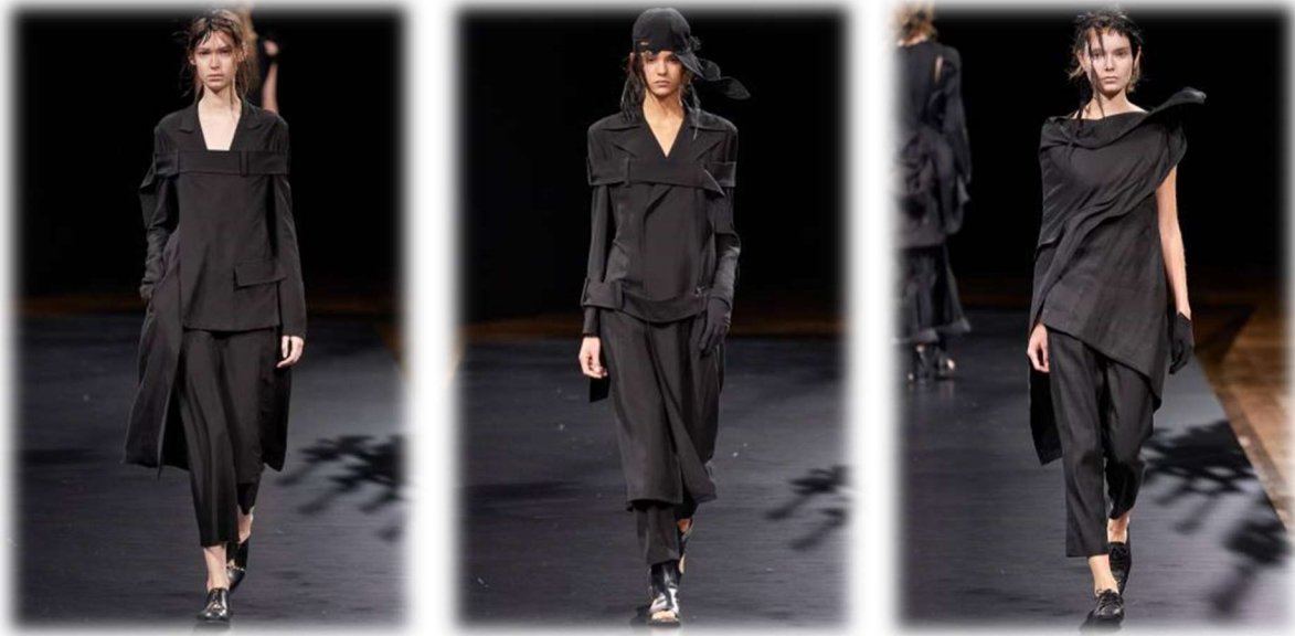
Resim 6. Yohji Yamamoto, İlkbahar 2021, Hazır Giyim Figure 6. Yohji Yamamoto, Spring 2021, RTW

Yamamoto'nun erkek ve kadın kavramlarını bulanıklaştıran/çoklu katmanları ve yoğun olarak başvurduğu asimetrik düzenler “merkezsizleştirme” olarak tanımlanabilir. Giysi modüllerinin yer değiştirmesi, kalıp ve hacmi karakteristik yaklaşımla birleştirdiği tasarımları minimalist ifadeler taşımaktadır (Resim 6.). Ona göre standart kalıpların içine sıkıştırılmış bu mengeneden çıkmanın yolu, yeni formsal araştırmalar ile mümkündür (Ambrose ve Harris, 2012).