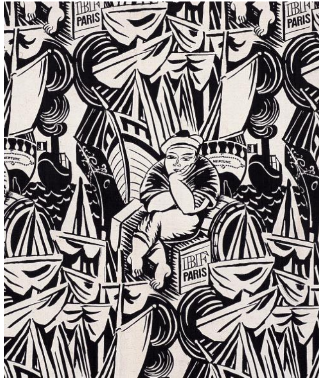
Şekil 15. “Neptün” 1920, Raoul Dufy

“Hunting” ve “Fishing” adlı tasarımlar; keten, pamuk üzerine ahşap kalıp monokrom baskılıdır ve birkaç renk varyantı bulunmaktadır. “Toile de Tournon” serisinde yer alan tasarımlardır (Şekil 13., 14.).