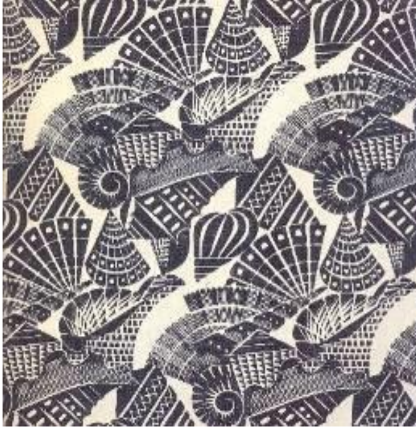
Şekil 17. Les Conques(1925), Raoul Dufy

"Les Conques" (1925), keten kumaş üzerine ahşap baskı tekniği ile üretilmiş ve Bianchini-Férier firması için tasarlanmıştır. Bu baskının büyük ölçekli motifleri, Wiener Werkstätte (Viyana Atölyesi) ve Münih Tasarım Okulu (Munich School of Designers) tarafından tasarlanan tekstillere yakındır. Bu kumaş Victoria Albert Müzesi koleksiyonunda yer almaktadır (Victoria & Albert Museum, 2002) (Erişim Tarihi: 02.01.2021).