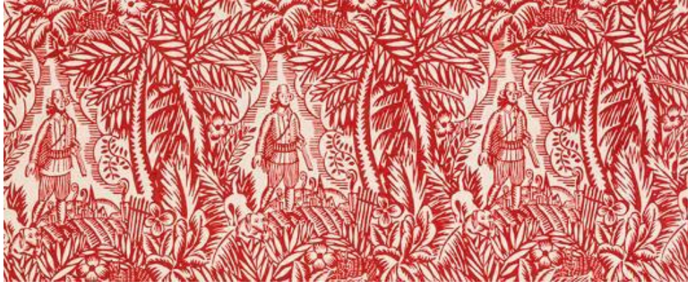
Şekil 13. "Hunting" 1918, Raoul Dufy

https://collections.lacma.org/node/212528 , Erişim Tarihi: 02.03.2021