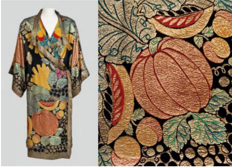
Şekil 7. Lame Dokuma Kumaş Tasarımı, Raoul Dufy