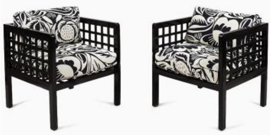
Şekil 5. “La Perse” Döşemelik Kumaş, Raoul Dufy

“La Perse” adlı çalışma Metropolitan Sanat Müzesi koleksiyonunda yer almaktadır. Bu çalışma, Poiret'in elbise ve ceket tasarımlarının yanı sıra ev tekstilinde; dekoratif yastık ve perdelik kumaş olarak da kullanılmıştır (Şekil 5.).