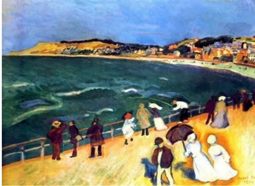
Şekil 1. “Promenade Sur La Jetée”, Tuval Üzerine Yağlı Boya, 1906, Raoul Dufy

Raoul Dufy 1877'de Fransa'nın Le Havre şehrinde doğmuştur. Sanatçı sanat eğitimine Paris'teki École des Beaux-Arts başlamıştır. Dufy 1900 yılında Paris'te École Nationale Supérieure des Beaux-Arts'ta izlenimci ressam Léon Bonnat'tan eğitim alarak resim sanatında uzmanlaşmıştır. Raoul Dufy, başlangıçta izlenimci sanat anlayışını benimseyerek, suluboya, yağlı boya resim çalışmaları yapmıştır (Coppel, 1999) (Şekil 1.).