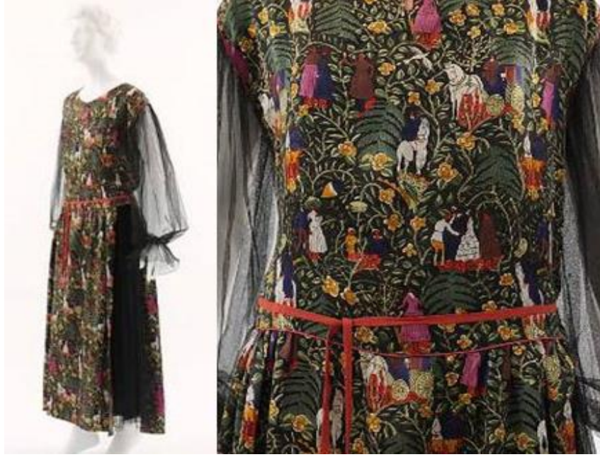
Şekil 6. "Bois de Boulogne", Raoul Dufy Baskı Kumaş Tasarımı ve Detayı

Dufy, bu tasarımında floral, insan ve hayvan motiflerinin yer aldığı “Boulogne Ormanı”nı betimlenmiştir. “Bois de Boulogne” Fransa’da yüzyıllarca Fransa krallarının av alanı olarak kullandığı ormandır. Kompozisyonda, tasarımı oluşturan figürler çok renkli ve eşit boyutlarda sıkışık olarak yerleştirilmiştir. Tüm bu ayrıntılar, Ortaçağ tapestry ile benzerlik göstermektedir. Bu çalışma, Newyork Metropolitan Sanat Müzesi koleksiyonunda yer almaktadır (Şekil 6.).