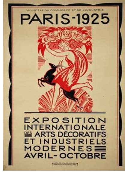
Şekil 9. Uluslararası Modern Dekoratif ve Endüstriyel Sanatlar Sergi Afişi