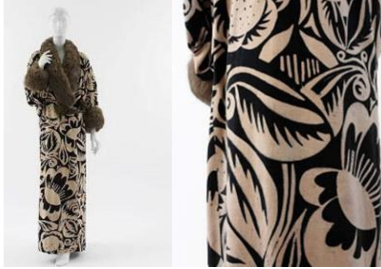
Şekil 4. “La Perse” (1911), Baskı Kumaş Tasarımı ve Detayı, Raoul Dufy