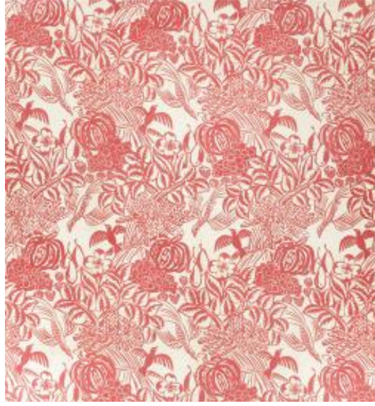
Şekil 12. "Fruits d'Europe" 1912, Raoul Dufy