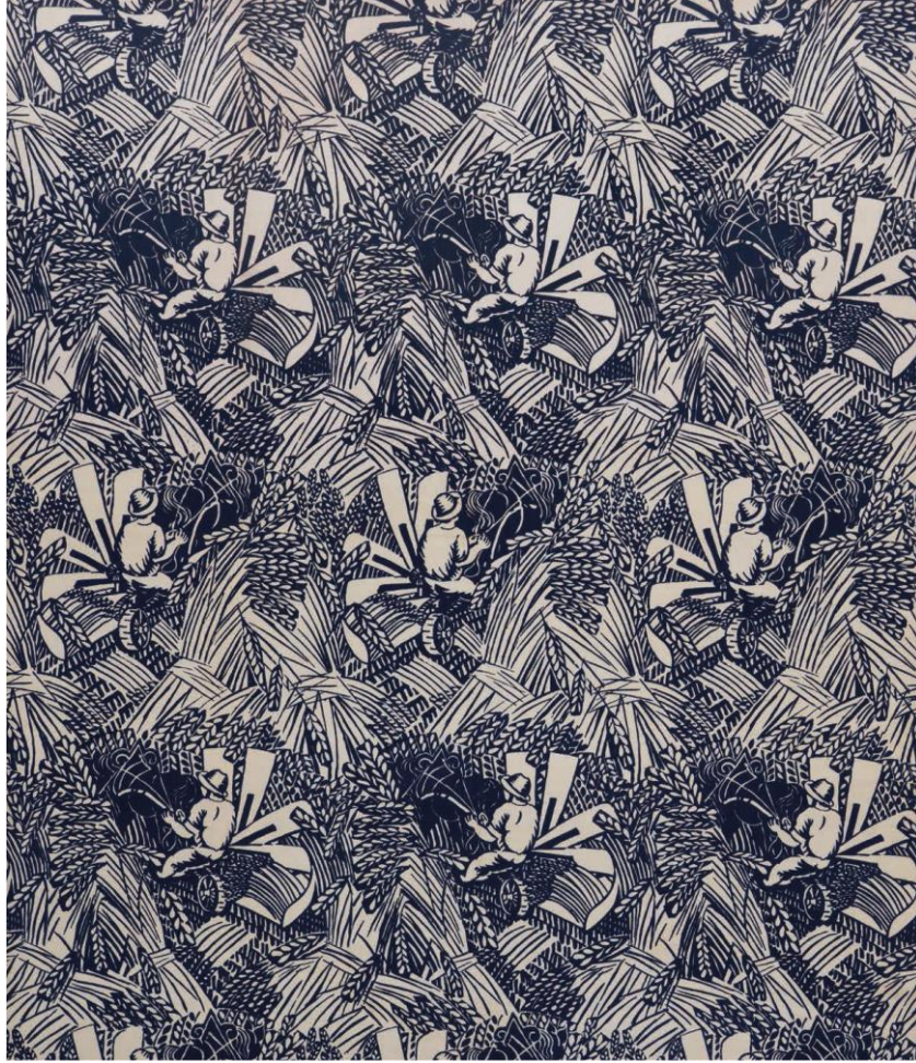
Şekil 16. “La Moisson” (1920) Raoul Dufy

“La Moisson” (1920); hasat ürünleri büyük buğday demetleriyle kamufle edilmiştir. Hareketli canlı formların, birbirleriyle keşişmesiyle fütürist etkili tasarımlar yaratılmıştır. Keskin kenarlı yapraklar desenleri, birbirine bağlayan desen öğeleriyle birlikte tekrarlanan motifler ritmik kavis oluşturmaktadır. Dufy’nin tasarımlarının karakteristik özelliği, desen içerisindeki yardımcı öğelerinin ölçekleri abartarak vurgulamasıdır (Şekil 16.).