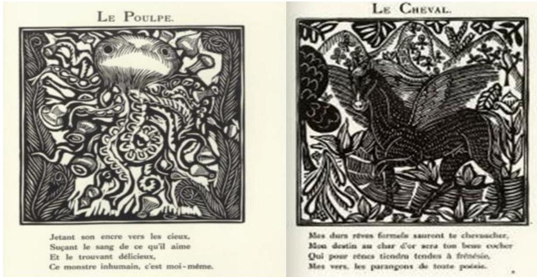
Şekil 2. Guillaume Apollinaire'nin "Le Bestiaire ou Cortège d'Orphée" şiir kitabının Raoul Dufy tarafından yapılan "Le Poulpe" ve "Le Cheval" (1911) isimli illüstrasyonlar

Figure 2. Guillaume Apollinaire's poetry book "Le Bestiaire ou Cortège d'Orphée", illustrations of "Le Poulpe" and "Le Cheval" by Raoul Dufy (1911)