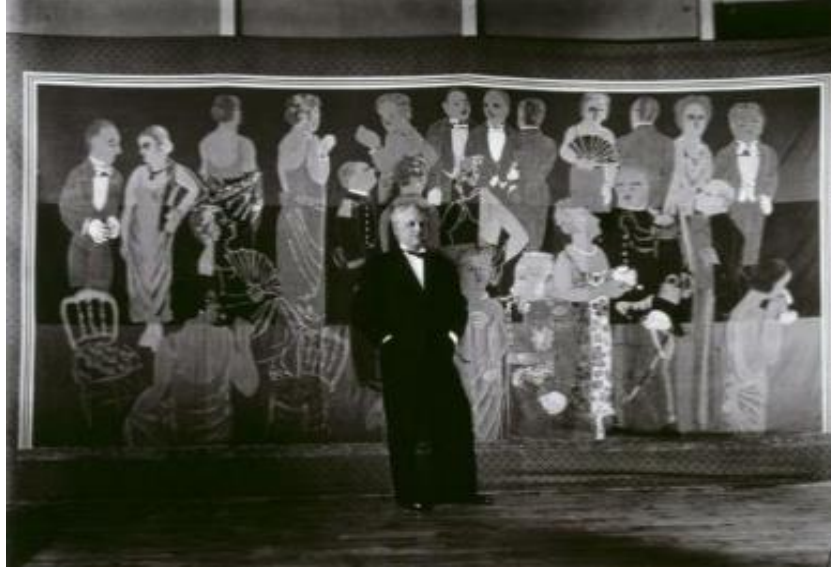
Şekil 10. Raoul Dufy'nin ondört adetten oluşan duvar tekstili Uluslararası Modern Dekoratif ve Endüstriyel Sanatlar Sergisi

Uluslararası Modern Dekoratif ve Endüstriyel Sanatlar Sergisi'nde duvar tekstili, nakışlı kumaşlar, tapestryler, sergilerin çoğunda hem büyük bir önem taşıyıp hem de lüks iç mekan dekorasyonunda olmazsa olmaz bir değere sahip olmuştur. Bu sergide Dufy, Poiret için ondört adet panelden oluşan dekoratif duvar tekstili tasarımları yapmıştır (Şekil 10.). Bu sergi çalışması Dufy'nin prestijini ve ününü daha da artırmıştır (Ginsburg, 1993, s. 85).