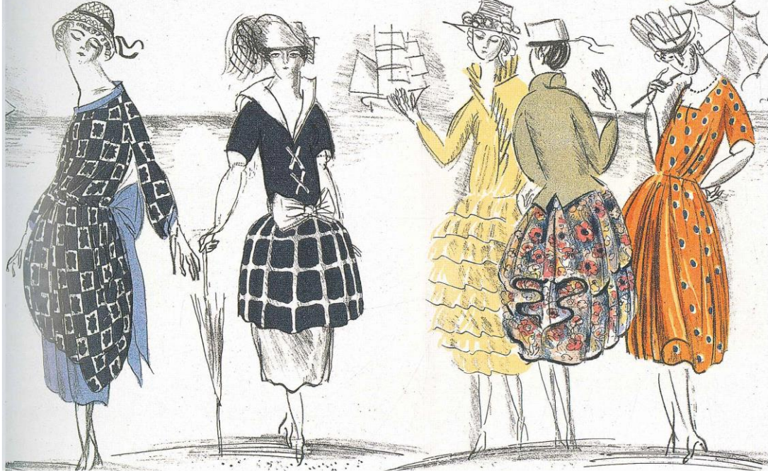
Şekil 8. Raoul Dufy'nin "1920 Yaz Elbiseleri" Moda İllüstrasyonları, Gazette du Bon Ton Figure 8. Fashion Illustrations of "1920 Summer Dresses" by Raoul Dufy, Gazette du Bon Ton (Hardy; 2006)