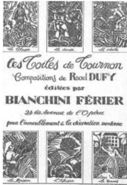
Şekil 11. “Toile de Tournon” Döşemelik Kumaş Koleksiyonu Afişi

Raoul Dufy, bu döşemelik kumaş koleksiyonunda geleneksel Toiles de Jouy kumaşlarını yeniden yorumlamış ve Apollinaire’s Bestiaire’in şiir kitabı için hazırlamış olduğu illüstrasyon ve ahşap kalıpları yaparken kazandığı deneyimlerini bu koleksiyonuna aktarmıştır. Aynı zamanda bu kumaş koleksiyonu, ahşap kalıp baskıcılığının yeniden gündeme gelmesini sağlamıştır. Bianchi Ferier firması, (Şekil 11.) Raoul Dufy’nin bu kumaş koleksiyonunu tanıtmak için reklam afiş yayımlamıştır (Hardy, 2006, s. 238).