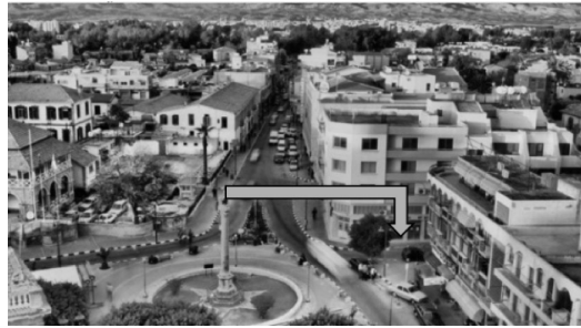
Şekil 2. Üniversite binasının bulunduğu, meydana çıkan sokak.