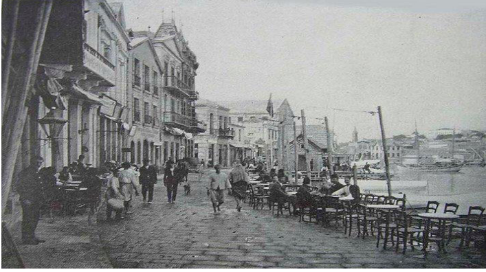
Midilli 1908 47

Damga romanının kahramanı İffet, babasının adına, Meşrutiyet İlan edildiği gün halkın sokaklarda “Kahrolsun Halis Paşa” (s. 33) sloganlarında rastlar. İffet, kendisini saltanat delisi olmayan... doğuştan demokrat (s. 43) olarak tanımladığı ve buna göre hareket ettiği hâlde babasının Midilli’ye sürülmesinden olumsuz anlamda etkilenir. Gösteri yapan halk tarafından konağın camları kırılır, ailesi darmadağın olur, mallarına el konulur ve İffet, babasıyla birlikte Midilli’de gönüllü iki buçuk yıl sürgün olarak yaşamak zorunda kalır.