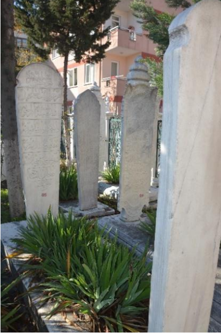
Şekil 13. Şerife Saide Hanımın Mezar Taşı

Ayak Şahidesi dikdörtgen gövdeli yarım yuvarlak kemer tepelikli tipolojidedir. Şahide iç yüzünde bitkisel tezyinat yer alır.