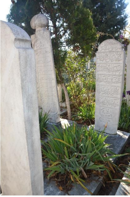
Şekil 1. Hatice Hatun'un Mezar Taşı