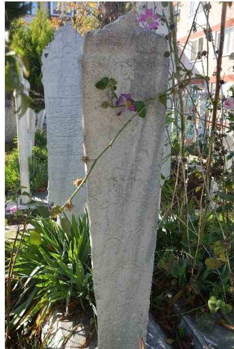
Şekil 19. Niyazi Kalfanın Mezar Taşı

Ayak taşı dikdörtgen gövdeli, sivri kemer tepelikli sonlanan bir tarzdadır. Başlık kısmı deforme durumda olduğundan tezyinatı net görülememektedir. Ön yüzde merkezde vazo içerisinde uzanan gül ağacı motifi görülmektedir. Yüzeyde oluşan aşınma süsleme detayını olumsuz etkilemiştir.