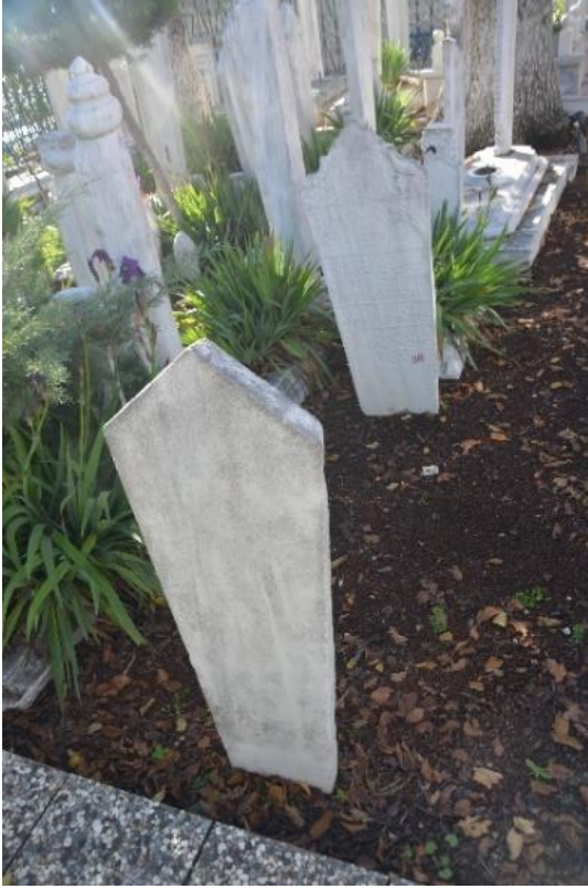
Şekil 14. Ruveys Hatice Hatun'un Mezar Taşı