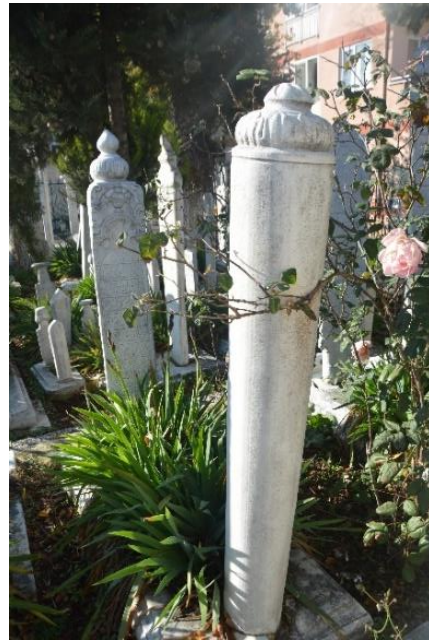
Şekil 4. Şerife Saide Hanımın Mezar Taşı

Ayak Şahidesi silindirik gövdeli ve hotoz başlıkla sonlanan bir görünümündedir. Sade görünümdeki ayak taşı tepelik kısmında yer alan bitkisel tezyinat haricinde hareketlilik görülmez (Şekil 4).