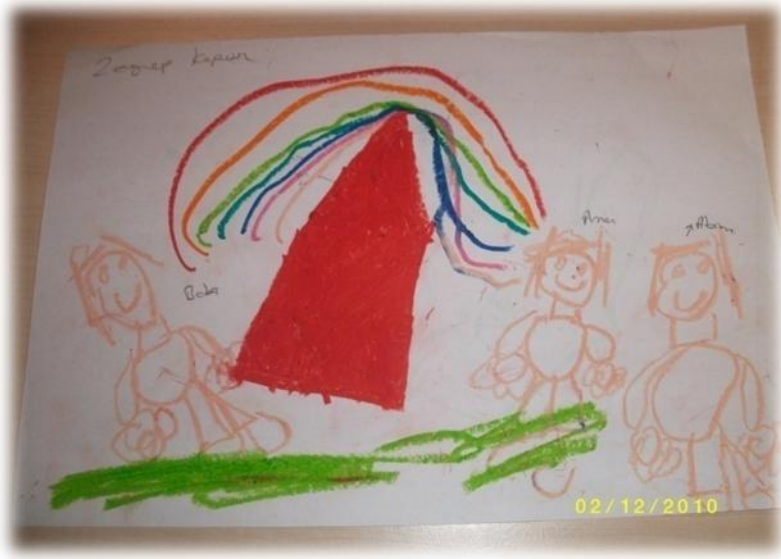
Resim 3. Ç2'nin saygı konusu için çizdiği resim Hikâyesi: Annemi babamı çizdim. Gezmeye gidiyorlar.

1A ve 2A öğretmenini değerlendirecek olursak, 1A öğretmeni konu öncesi ve konu sonunda her iki şekilde de değerlendirirken 2A öğretmeni sadece konu sonunda değerlendirmeyi tercih etmiştir. Burada çocukların hazır bulunuşluklarını da göz önünde bulundurarak çocuk konu işlemeden hangi durumda bilinmesi gerekmektedir.