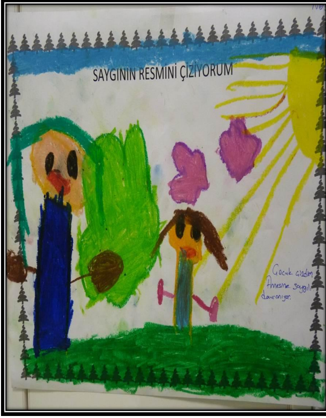
Resim 2. Ç1'in Konu Sonunda Çizdiği Resim (1 A Öğretmeni) Hikâyesi: Çocuk çizdim. Annesinin çantasını karıştırmıyor yani saygılı davranıyor.

1 A öğretmeni aynı çocuk için hem konu başında hem de konu sonunda "Saygının resmini çiziyorum" başlıklı resim çizdirmiştir. Buradaki resimleri incelediğimizde çocuk ilk resimde saygı konusundan bahsetmemişken ikinci resimde saygıdan bahsederek çizmiştir.