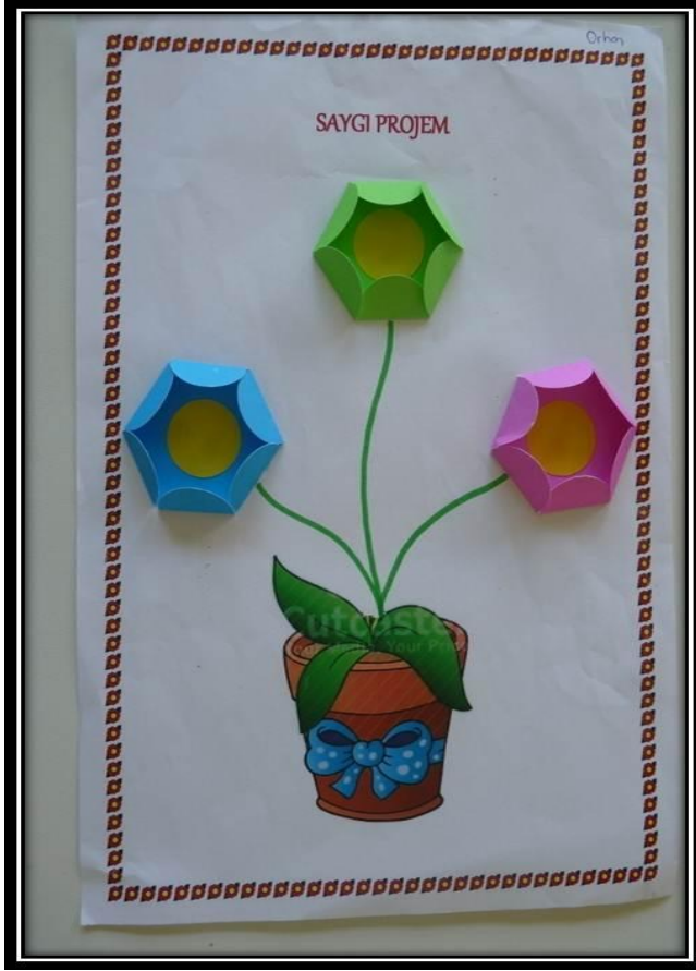
Resim 4. Aile eğitimi saygı projesi

tanımları ve onları keşfetmeleri gerektiğini düşünmektedir. Öğretmenlerin veliye notlar göndererek çocuklarıyla konuşarak ya da farklı etkinliklerle farkındalık uyandırmalarını önermektedir. 1A öğretmeni de saygı konusunu işledikten iki hafta sonra aileye bir çiçek projesi göndermiştir. Buradaki çiçeklerin yaprakları kapalıdır. Çocuk evde saygı davranışlarını gösterdikçe aile çiçeklerin yapraklarını açmıştır. Haftanın sonunda ise aile projeyi okula tekrar göndermiştir. Öğretmen çocukları toplayıp evde yaptıkları proje ile ilgili konuşmuş ve tüm çocuklara teşekkür etmiştir.