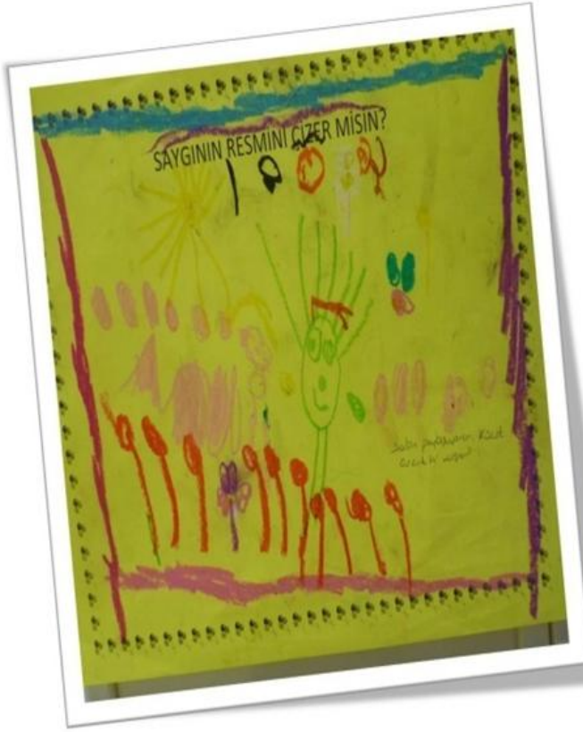
Resim 1. Ç1'in saygı konusu için ilk çizilen resim (1a öğretmeni) Hikâyesi: Balon paylaşan çocuklar çizdim.