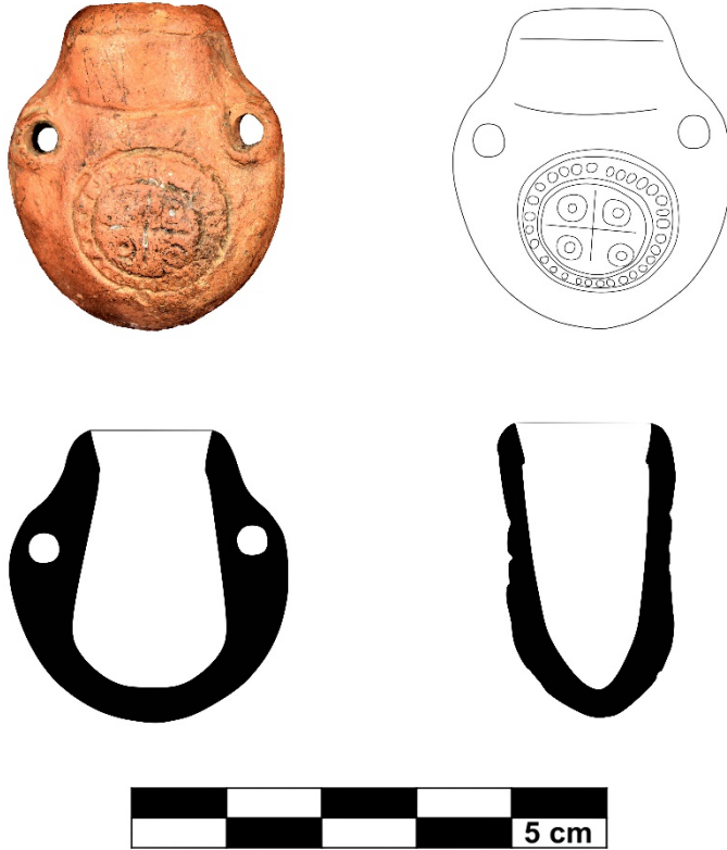
Şekil 2. 2 No'lu Ampulla

2 No'lu Ampulla'yı hem biçim hem de bezeme özellikleriyle yapılan analogi sonucunda, 1 No'lu Ampulla gibi 5. yüzyıl-7. yüzyıl başları arasında tarihlendirebilmek mümkündür.