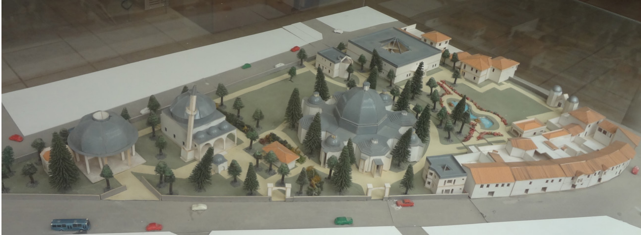
Fotoğraf 1: Süleyman Demirel Demokrasi ve Kalkınma Müzesi'nin İçinde Bulunduğu Demirel Külliyesi Maketi

Müze binası mimarisiyle ziyaretçilere bir mesaj vermekte ve birçok anlam ifade etmektedir. Bu mesaja bakıldığında müze binasının çatı kısmı, biri ortada diğer sekiz tanesi ise büyük kubbenin etrafında olmak üzere dokuz kubbeden oluşmaktadır. Bu kubbelerin anlamı Süleyman Demirel'in "Ben 6 kez gittim, 7 kez geldim ama sonunda Türkiye'nin 9. Cumhurbaşkanı oldum" ifadesini yansıtmaktadır. Küçük kubbelerin birisi giriş kubbesi olarak değerlendirilmekte olup diğer 7 küçük kubbe Süleyman Demirel'in yedi kez Başbakanlık yapmasını ifade etmektedir. Büyük kubbe ise Cumhurbaşkanlığını temsil etmektedir. Ayrıca büyük kubbeye bakıldığında Samanyolu Galaksisini andırmaktadır (Ispartahaber, 2018).