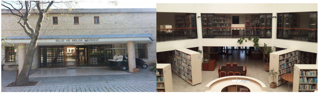
Fotoğraf 2: Süleyman Demirel Demokrasi ve Kalkınma Müzesi bünyesindeki Kütüphane

Süleyman Demirel'in özel kütüphanesi Türkçe ve yabancı dildeki 45.000 civarında kitaba ev sahipliği yapmaktadır ve kütüphanede kendi yazdığı kitaplar da mevcuttur. Ayrıca kütüphanede 1968 yılından bu yana yayınlanmış ve yayımlanmakta olan 32.000 adet ve ciltten oluşan yerli ve yabancı gazeteler ile dergiler de bulunmaktadır. Süleyman Demirel'in yaşamı boyunca biriktirdiği 6 milyon belge sistematik bir şekilde 10.000 klasör içinde toplanmıştır. Bu belgeler 1950 yılından beri dünyanın ve ülkemizin gelişimine ve değişimine ışık tutmaktadır (Siviloğlu, 2012). Süleyman Demirel'in özel kütüphanesi olmasından dolayı diğer hiçbir müze ve kütüphanede rastlanamayacak olması kütüphaneye ayrı bir değer katmaktadır. Kitapların kütüphane sistemine göre bibliyografik kayıtları yapılmış ve Dewey Onlu Tasnif Sistemi'ne göre açık olarak raflara yerleştirilmiştir. Kitapların kütüphane dışına çıkarılmasına izin verilmemektedir. Ayrıca kütüphane ziyarete kapalı olup sadece araştırmacıların girişine izin verilmektedir (Foto 2).