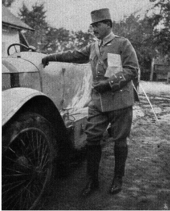
Ek 2: Üsteğmen Kont Alexander “Sascha” Kolowrat ( Sport im Bild , 11 (1915), s.143)