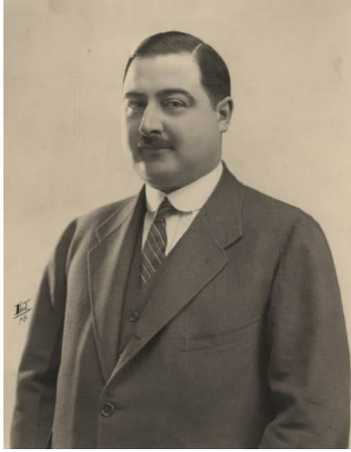
Ek 1: Kont Alexander “Sascha” Kolowrat-Krakowsky (1886-1927)