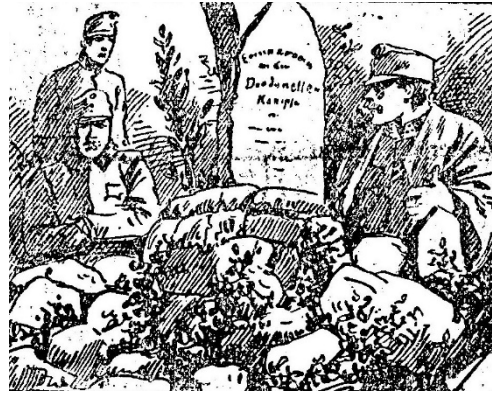
Ek 17: 36 Numaralı Batarya'nın hatırasına dikilen anıt taşın illüstrasyonu

( Allgemeine Automobil-Zeitung , 26 Mart 1916, s.1)