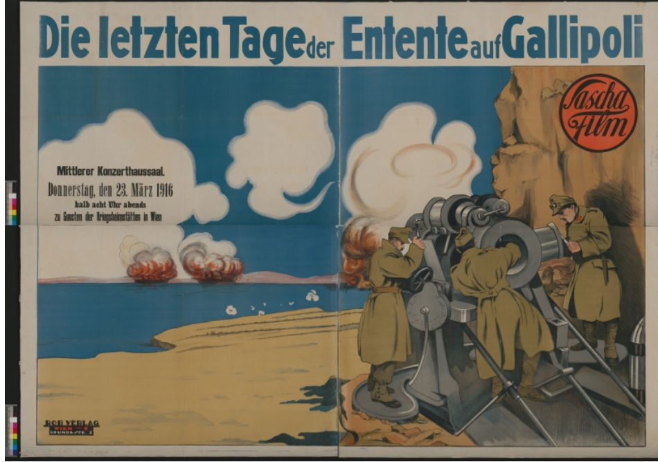
Ek 5: Filmin 23 Mart 1916 tarihli halka açık gösteriminin afişi