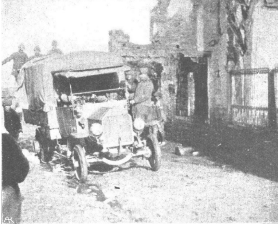
Ek 3: Kolowrat'a tahsis edilen bir sıhhiye otomobili ( Allgemeine Automobile-Zeitung , 26 Mart 1916)