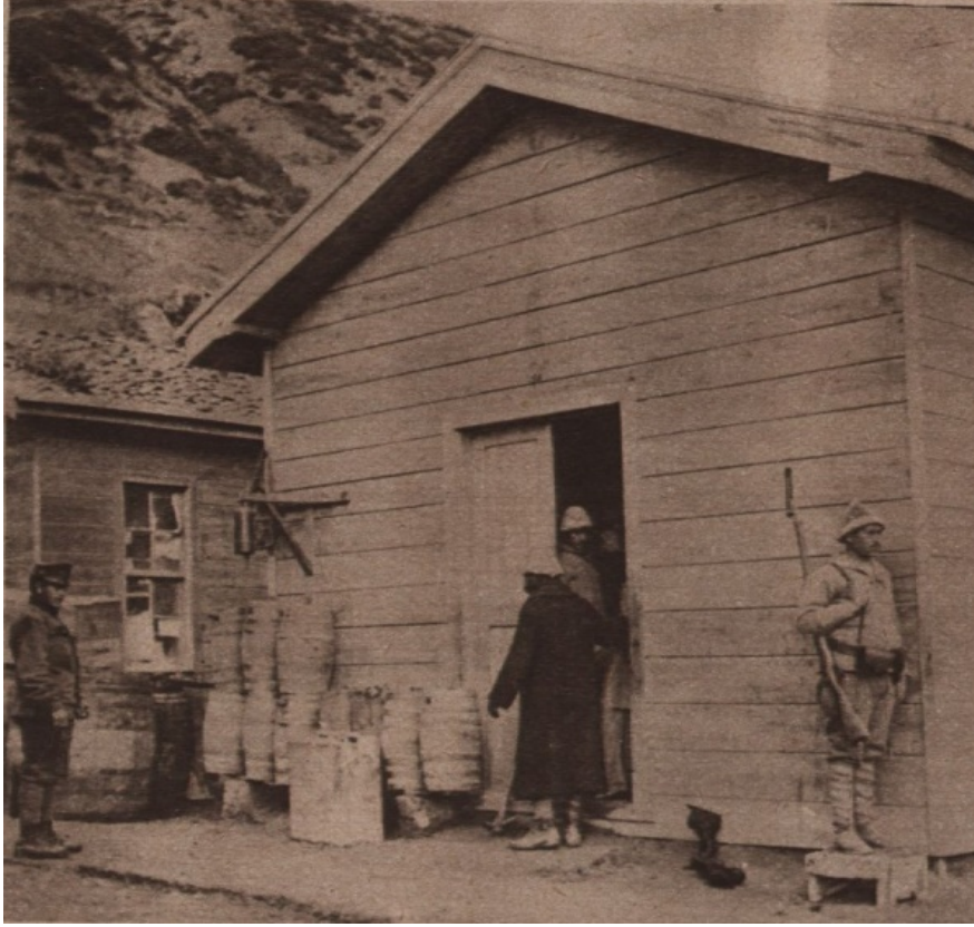
Ek 4: 9 Numaralı 24 cm'lik Motorlu Havan Bataryası Mürettebatının Barınağı ( Das Interessante Blatt , 24 Şubat 1916, s.6)