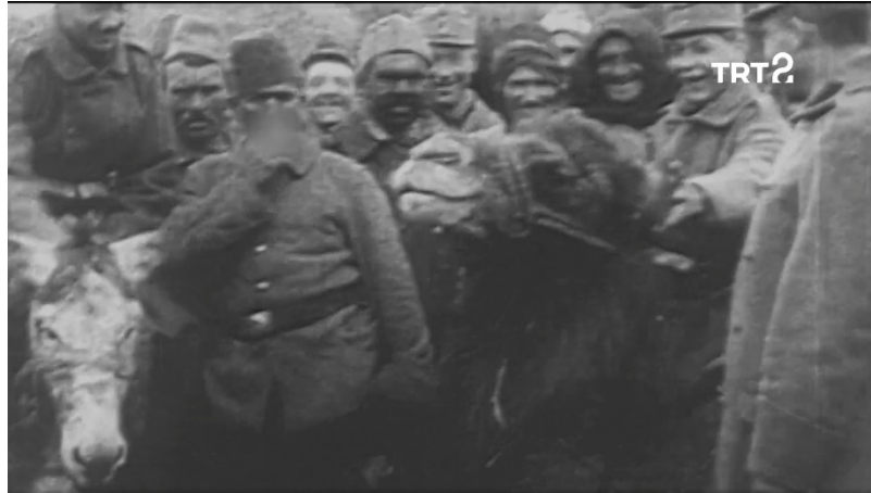
Ek 7-8-9: “Avusturya-Macaristan ordusu askerleri ve Osmanlı askerleri, bölgenin taşıma hayvanı olan tek hörgüçlü bir deveyi sürüyor.” ( Neuigkeits Welt Blatt , 14 Mart 1916, s. 8) ve illüstrasyonun çizildiği orijinal enstantane ( Tarihin Ruhu , 63. Bölüm)