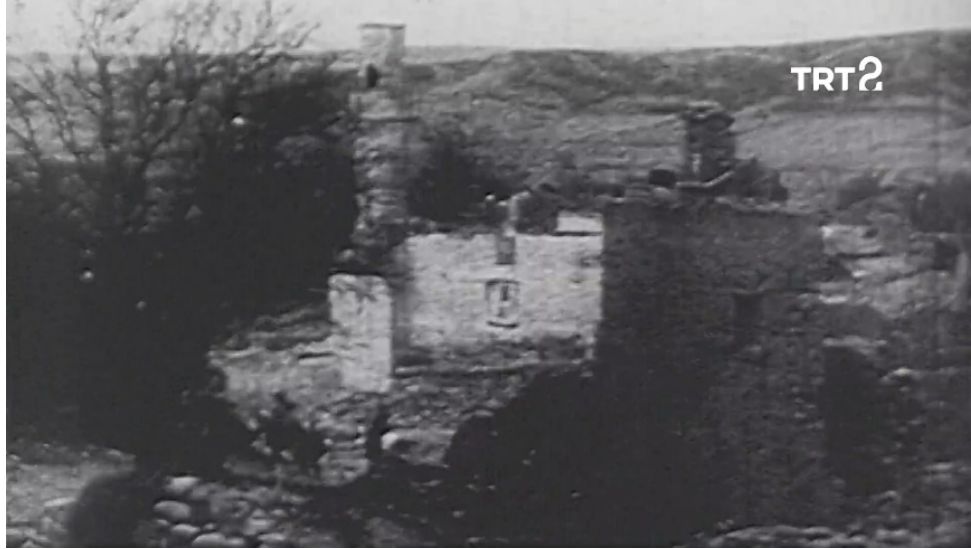
Ek 6: Tarhin Ruhü isimli belgeselde gösterilen filmde harap bir caminin kimin çektiği belli olmayan görüntüsü. Filmde Kolowrat'ın harap binaları çektiği sahnelerin olduğu bilindiğine göre, bu görüntüyü de kendisinin çekmiş olması muhtemeldir.