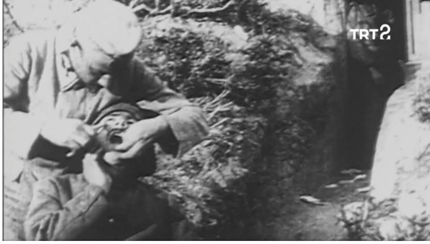
Ek 12: Filmdeki diş çekim sahnesi ( Tarihin Ruhu 63. Bölüm)