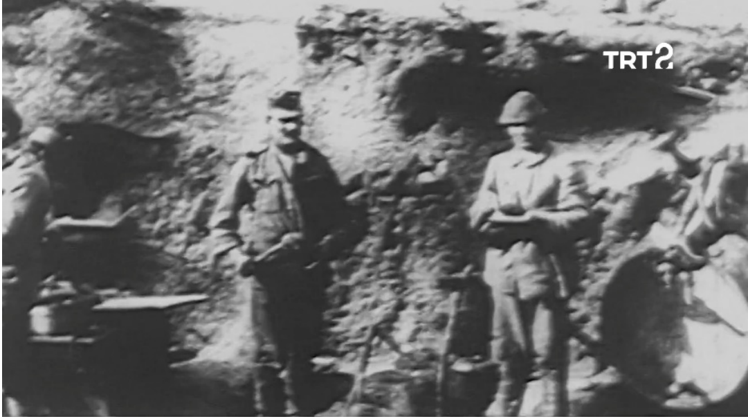
Ek 10-11: Yemeklerini Osmanlı askerleriyle paylaşan Avusturya-Macaristan Ordusu askerleri ( Tarihin Ruhu 63. Bölüm)