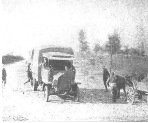
Ek 15-16 Kolowrat'ın filminde toprak ve gereçlerinin kamyonlarla nakledilirken gösterildiği sahne ( Tarihin Ruhu 64. Bölüm) ve aynı sahnenin bir Avusturya mecmuasında basılan fotoğrafı

( Allgemeine Automobil-Zeitung , 26 Mart 1916, s.1)