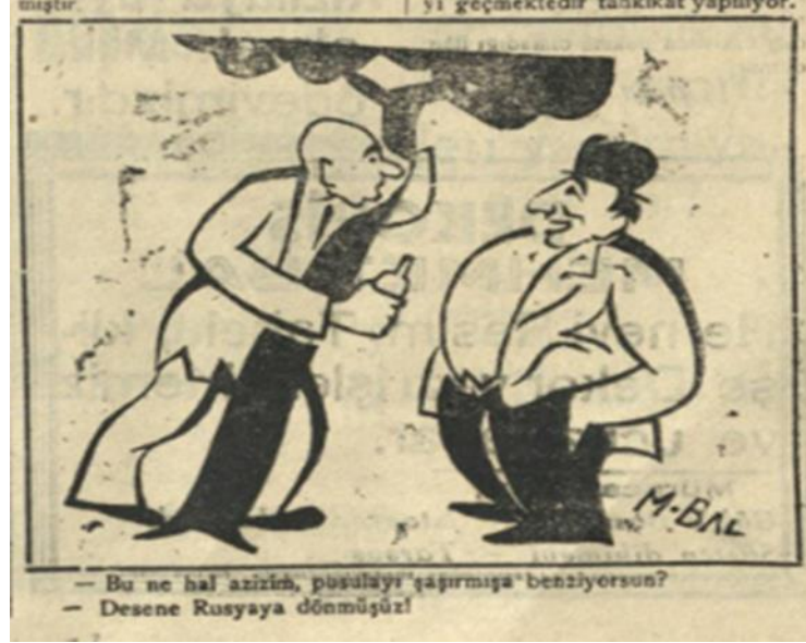
Resim 7: “Gazetenin uluslararası ilişkiler üzerine ilk karikatürü”, Gülek Gazetesi, S. 350, s. 1.

ABD, Rusların herhangi bir saldırısına karşılık Türkiye’yi askerî olarak güçlendirmek istiyordu. Bu kapsamda “ABD Deniz Heyeti” Mayıs ayı içinde Ankara’ya geldi. Görüşmeler kapsamında 120.000.000 dolarlık motorlu deniz ve kara araçları ABD’den alınacaktı. Ruslar bu görüşmeleri Birleşmiş Milletler (BM) Güvenlik Konseyine şikâyet etti. İngilizler Ortadoğu’da ABD ve Sovyetlerin menfaatleri neticesinde çarpışabileceğini iddia etti. Aslında bu durum uzun yıllardır Orta Doğu’da faaliyet gösteren İngilizlerin bölgeden çekilmesinden kaynaklanacaktı. Bölgede bulunan 125.000 İngiliz’in bölgeden bir plan dahilinde çekilmesi sonrası iki büyük devletin çekişeceğini ortaya koydu. Bu bölgedeki petrolün %56’sının İngiltere’ye, %36’sının ABD’ye ve %8’inin Fransa ve Hollanda’ya ait olması nedeniyle İngilizlerin bölgeden çekilmesinin tehlikeli olacağı belirtildi. Rusların ise bu bölgeden pay almak istemesi de farklı dengeleri ortaya çıkaracaktı. 99 Bu bağlamda ABD Haziran 1947’de Rusların Türkiye’ye saldırısına karşın Türklerin yanında savaşa gireceklerini açıkladı. ABD’nin desteği bir anlamda kendi çıkarlarını korumak adına olduğu da ortadaydı. Eylül 1947’de bir İngiliz filosundan sonra başka bir ABD filosu Türkiye’ye geldi. Dışişleri Bakanı Hasan Saka Amerikan yardımları konusunda Türkiye Büyük Millet Meclisinde (TBMM) sayıtlara izahat verdi. Amerikan yardımlarının BM tarafından da desteklendiğini belirtti. 100