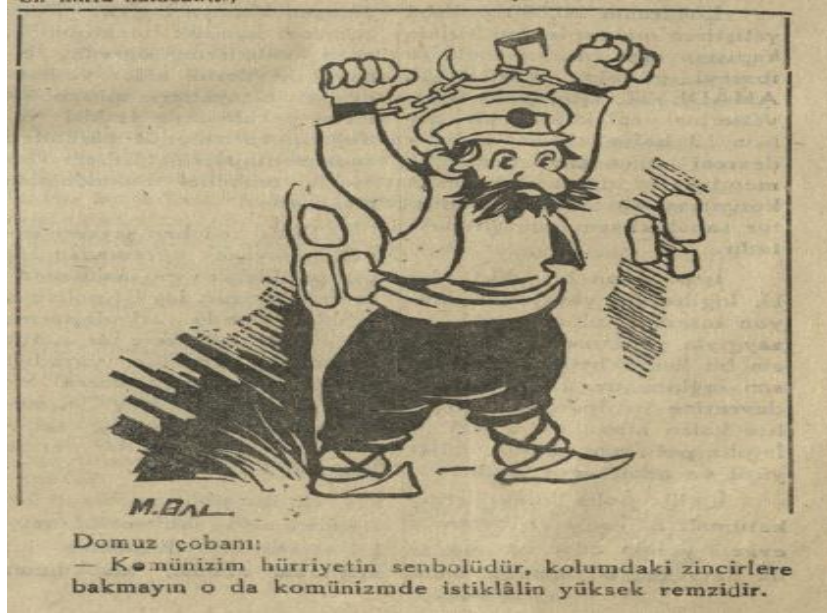
Resim 4: Gülek Gazetesi, S. 430, s. 1.

Gazete 430. sayısında komünizm meselesine ağırlık vermiş ve ülkenin bu tür bir beladan hızla uzaklaşması için haberler yapmaya başladı. Rusların bu konuda etkin olduğunu belirten bu tür olayların hemen kökünün kazılması gerektiğini de okuyucularına servis etti. Bu gelişmeler ile ilgili hakaret içeren şu karikatürü de okuyucularıyla paylaştı: