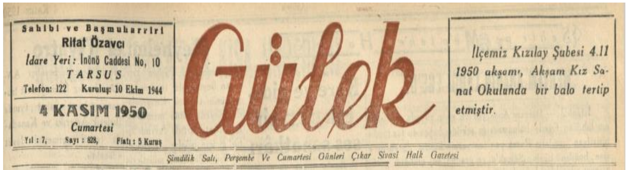
Resim 2: Gülek Gazetesi, S. 828, s. 1.

Gazetenin yayınlanması ile ilgili olarak iki önemli bilgi ilk sayısında verildi. İddialı olmaktan ziyade haberleri olduğu gibi aktaracağını bildiren gazete “Altı ok ışığı altında” ifadesiyle Cumhuriyet Halk Partisi (CHP) prensiplerine göre bir yayın politikası güdeceğini belirtiyordu.