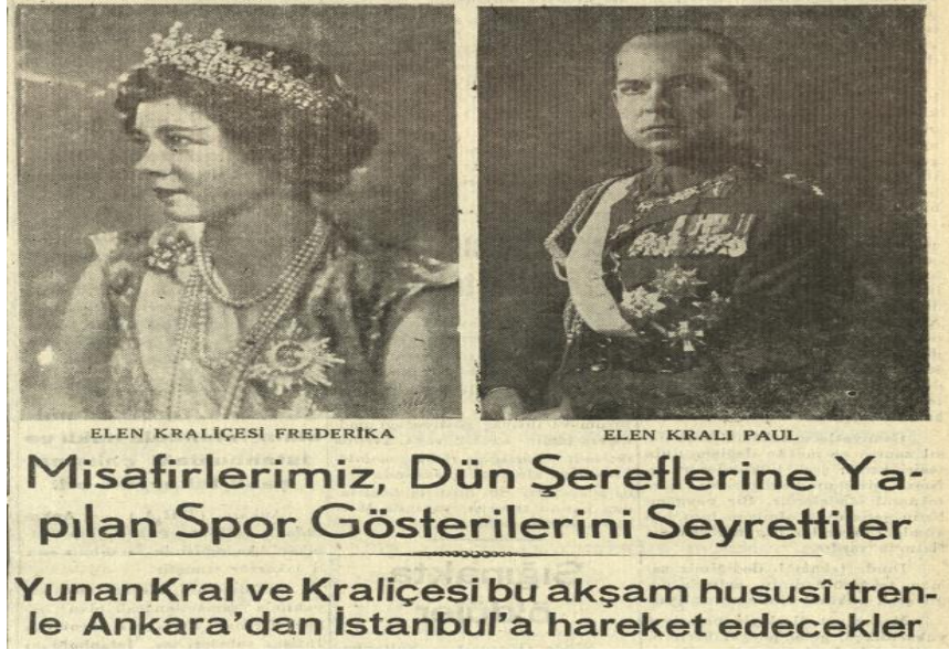
Resim 8: Gülek Gazetesi, S. 1074, s. 1.

İki ülke arasında güven ve iyi niyete dayalı ilişkiler yaşanırken Yunanistan menşei Akropolis Gazetesi, İzmir'in Yunanistan'a bağlanması ve Ayasofya'nın tekrardan kilise olarak faaliyete geçirilmesi noktasında istekleri olduğunu yazdı. Bu gelişme Türkiye'de şaşkınlıkla karşılandı. Gülek Gazetesi bu haberi manşetten verdi ve "İşte dostluk buna denir!...Akropolis'in yeni bir isteği var (!)" başlıklı bir haber yaptı. 109 Yunan başbakanı bu olaya "Ayasofya'nın kilise olarak tadil edilmesini talep eden gayri mesul bir gazetedir" şeklinde cevap verdi. Yunanistan Başbakan Yardımcısı Sofokles Venizelos Türk basınının bu olayı fazla önemsememesini isteyen bir açıklama yaptı. 110