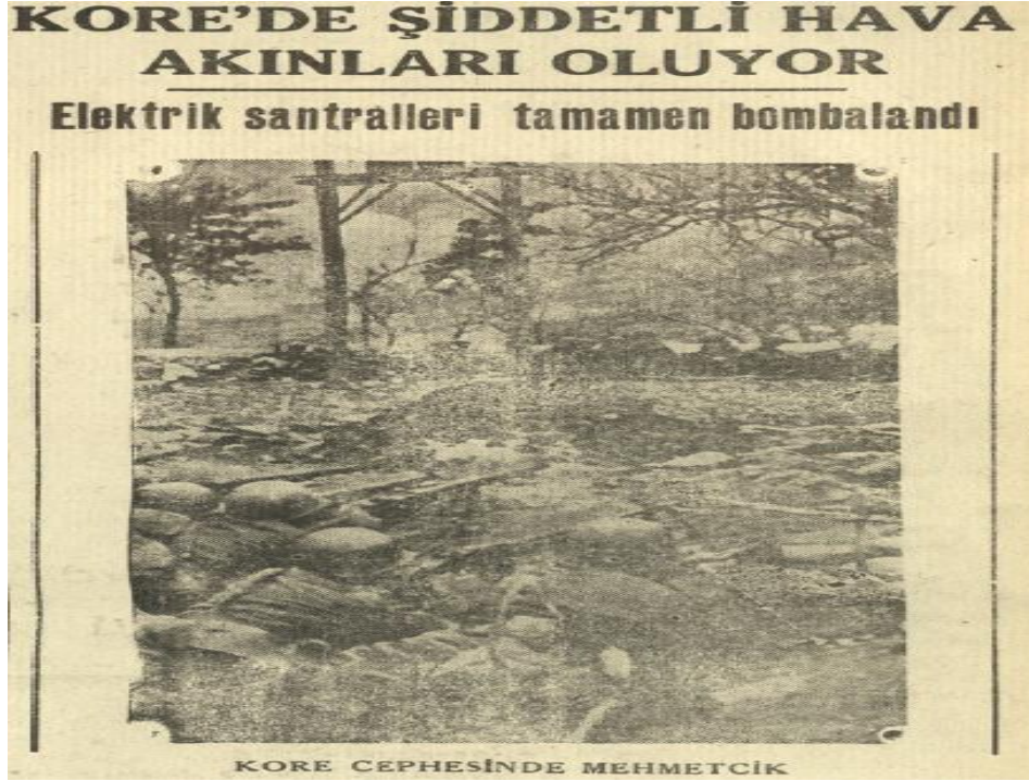
Resim 6: Gülek Gazetesi, S. 1095, s. 1.

1951 yılına gelindiğinde dünyanın ana gündemi Kore'deki savaştı. Komünist kuvvetlerle BM arasında yaşanan mücadeleler yoğun bir şekilde devam ederken Türkiye'nin ana gündemi Atlantik Paktı'na katılma süreciyle ilgiliydi. Gülek Gazetesi yoğun bir şekilde uluslararası ilişkileri gündemine aldı. Çünkü öncesinde ülke içindeki seçimler ve sonrasındaki gelişmeler ön plana çıkmıştı. Türkiye, Kore'deki mücadeleye Şubat 1951'de 600 asker daha göndererek destek verdi. 92 Mart 1951'de BM kuvvetleri Seul'u ele geçirdi ve Güney Kore bayrakları asıldı. 93 Bu esnada komünist kuvvetleri de karşı saldırılar düzenledi. BM Başkomutanlığı ve Uzak Doğu'daki Birleşik Kuvvetler Komutanı General Mac Arthur, Truman'ın emri ile görevden alındı. Yerine Korgeneral Ridgway getirildi. 94 1952 yılında da BM kuvvetleri üstünlüğü olsa da her iki tarafta mücadeleye devam etti. Kore Savaşı 1 Ekim 1953 tarihinde imzalanan ittifak antlaşması ile son buldu. 95