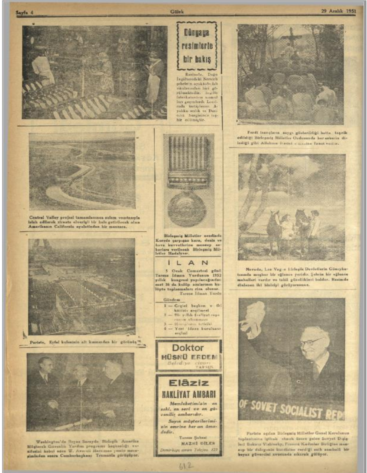
Görsel 5: Gülek Gazetesi, S. 1004, s. 4.