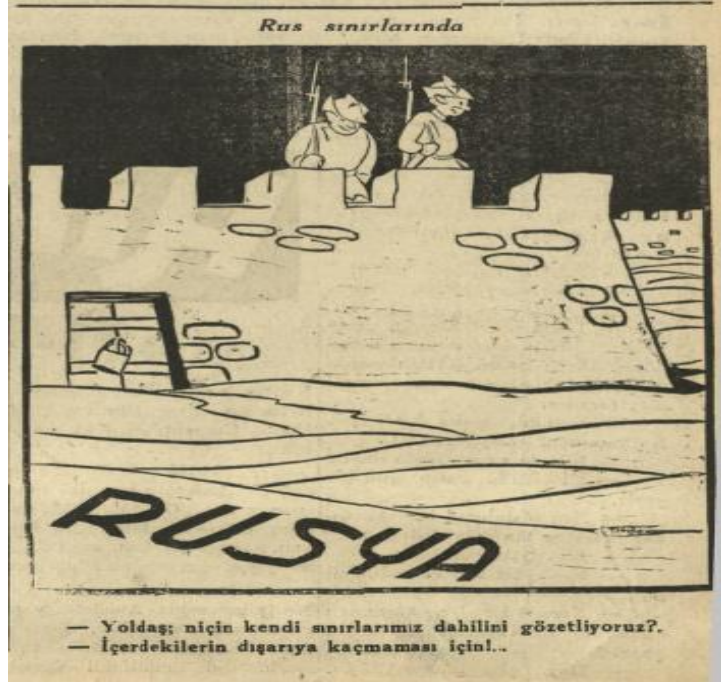
Resim 5: Gülek Gazetesi, S. 747, s. 1.

14 Nisan 1950 tarihinde ABD Başkanı Truman 5 yıllık icraatlarını anlatan bir demecinde dünyanın 1946 yılındaki durumdan çok daha iyi bir yerde olduğunu belirtti. Kendi ülkesi içinde aynı düşünceleri güdüyordu. Türkiye ve Yunanistan'ın komünizme karşı desteklemesini de başarı olarak nitelendirdi. 83 Şu anda dünyanın bir nebze de olsa durulduğunu konuşmasına ekledi. Bu gelişmelere rağmen Asya'da komünist faaliyetlerin bir an önce azaltılmasının gerekliliği de ortaya kondu. Rusların bu dönemde sakin kalmalarına neden olan olayın da ABD'nin hidrojen bombasını kullanıma hazır hale getirmesi olarak yorumlanıyordu.