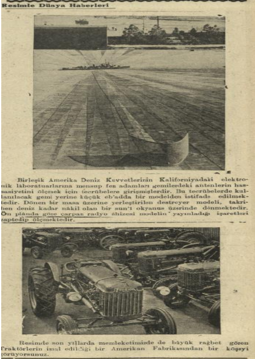
Görsel 4: Gülek Gazetesi, S. 776, s. 3.