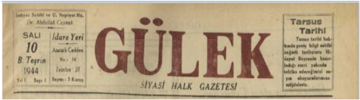
Resim 1: Gülek Gazetesi, S. 1, s. 1.