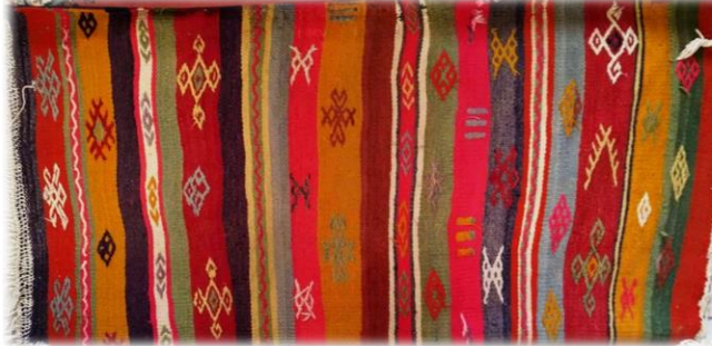
Fotoğraf 3. Cevizli mahallesi Düzençam Camisinde bulunan namazlık örneği

Çameli ilçesi Yaylapınarı mahallesinde bulunan namazlık, 1985 yılında Nesibe Bavuç tarafından yörede “düven” adı verilen mekikli tezgâhta dokunmuştur. 63 x 130 cm boyutlarında, çözgüsü pamuk, atkı ve desen ipi yündür. Enine bantlar halinde tasarlanmış, seyrek motifli cicim tekniği uygulanmıştır. Bitiracık, mekik, göz, çakmak yanışları ile süslenmiştir. Kırmızı, yeşil, pembe, mor, sarı, siyah, beyaz dokumada kullanılan renklerdir. Saçak boyu 8 cm’dir (Fotoğraf 2).