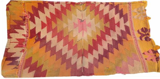
Fotoğraf 5. Çameli merkezde bulunan namazlık örneği

Çameli ilçesi Kızılyaka mahallesinde bulunan namazlık, 1980 yılında Ümmü Akman tarafından dokunmuştur. 90 x 148 cm. boyutlarında, çözgü ve atkı ipi yündür. Saçak boyu 16 cm'dir. Namazlık, inceli kalınlı enine bantlar halinde tasarlanmış, ilikli kilim, iliksiz kilim tekniği ile dokunmuştur. Pardi, koçboynuzu ve deve boynu yanırları ile süslenmiştir. Kırmızı, yeşil, mavi, sarı, mor, siyah, beyaz, pembe dokumada kullanılan renklerdir (Fotoğraf 4).