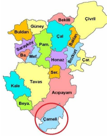
Harita 1. Denizli Haritası (URL 2)

Çameli, Denizli ilinin en güneyinde yer alan ilçesidir. Denizli'ye uzaklığı 107 km'dir. Rakım Çameli ilçesi Muğla ve Burdur illeri arasında; kuzeyinde Acıpayam, güneyinde Fethiye, doğuda Gölhisar ve batısında Köyceğiz ilçeleri ile çevrilidir (Harita 1). İlçenin yüzölçümü 73.800 hektardır. Genellikle orman alanı içinde çok dağınık, biraz dalgalı, pek az da yayla karakterli bir araziye sahiptir (URL 1). Başlıca ekonomik faaliyetler tarım, hayvancılık ve ormancılıktır (Anonim, 1982: 2176).