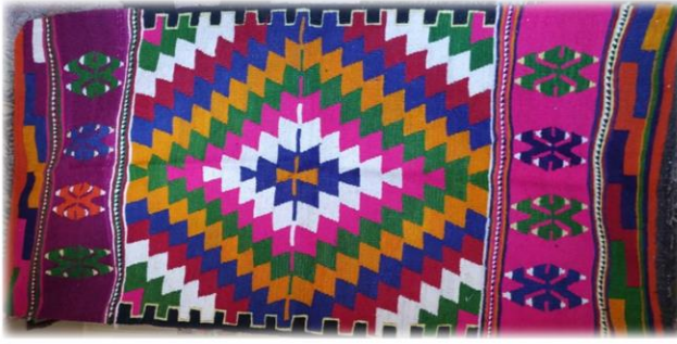
Fotoğraf 4. Kızılyaka mahallesinde bulunan namazlık örneği

Çameli ilçesi Kızılyaka mahallesinde bulunan namazlık, 1980 yılında Ümmü Akman tarafından dokunmuştur. 90 x 148 cm. boyutlarında, çözgü ve atkı ipi yündür. Saçak boyu 16 cm'dir. Namazlık, inceli kalınlı enine bantlar halinde tasarlanmış, ilikli kilim, iliksiz kilim tekniği ile dokunmuştur. Pardi, koçboynuzu ve deve boynu yanırları ile süslenmiştir. Kırmızı, yeşil, mavi, sarı, mor, siyah, beyaz, pembe dokumada kullanılan renklerdir (Fotoğraf 4).