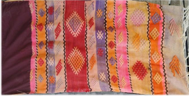
Fotoğraf 13. Cevizli mahallesinde bulunan namazlık örneği

İmamlar mahallesi camisinde bulunan namazlık, zili tekniği ile dokunmuştur. 74 x 120 cm boyutlarında, çözgü, atkı ve desen ipi yündür. Namazlığın iç zemini diyagonal şekilde yerleştirilmiş baklavalarla ve bu baklavaların içi ise dört göz yanlışları ile süslenmiştir. Dokumanın alt ve üst kenar suyunda sandık yanlışları, dokumanın başlangıç ve bitiş kısımlarında ise kaz ayağı yanlışları görülmektedir. Pembe, kırmızı, yeşil, sarı, beyaz dokumada kullanılan renklerdir. Saçak boyu 9 cm'dir (Fotoğraf 12).