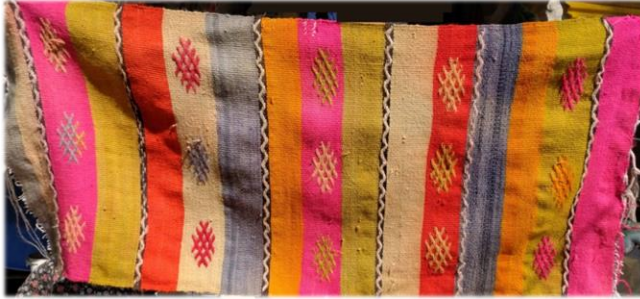
Fotoğraf 8. Cevizli mahallesinde bulunan namazlık örneđi

Çameli ilçesi Yumrutaş mahallesinde bulunan namazlık, 1970 yılında Şadiye Aslan tarafından dokunmuştur. 87 x 151 cm boyutlarında, çözgü, atkı ve desen ipi yündür. Namazlık, inceli kalınlı enine bantlar halinde tasarlanmıştır. Boynuz, bıtırak, şamdan, çakmak ve deve boynu yanışları ile süslenmiştir. Kırmızı, yeşil, mavi, sarı, siyah, beyaz, pembe dokumada kullanılan renklerdir. Dokumanın saçak boyu 20 cm'dir (Fotoğraf 7).