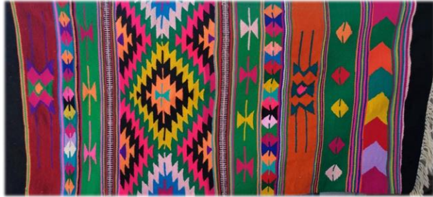
Fotoğraf 11. Kalinkoz mahallesinde bulunan namazlık örneği (Sultan Sökmen Arşivi, 2019)

Kolak mahallesi camisinde bulunan namazlık, Feride Can tarafından dokunmuş ve ölmeden önce kendisi camiye vermiştir (M. Akbaş, sözlü görüşme, 2019). 88 x 126 cm boyutlarında, çözgüsü pamuk, atkı ipi yündür. Kilimin orta yanışı olarak hayat ağacı yer almış, iç zemin boşlukları ise koç boynuzu yanışları ile süslenmiştir. Kilimi en kenarı ise eğri su yanışı ile çevrenmiştir. Turuncu, yeşil, mavi, sarı, siyah, beyaz, mor, kahverengi dokumada kullanılan renklerdir. Dokumanın saçak boyu 10 cm'dir (Fotoğraf 10).