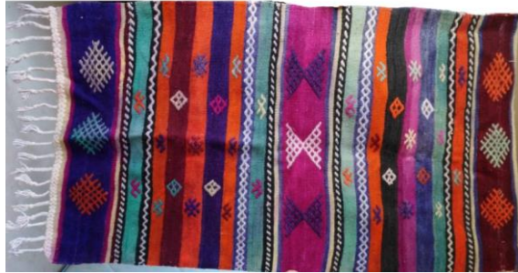
Fotoğraf 6. Çameli merkezde bulunan namazlık örneği

Çameli merkezde bulunan kilim parçası, Ümmü Akman tarafından 1970 yılında dokunmuştur. 70 x 100 cm boyutlarında, çözgü ve atkı ipi yündür. Kilim parçası kenarları kıvrılarak dikilmiş olup namazlık olarak kullanılmaktadır. Pardi ve koçboynuzu yanırları ile süslenmiştir. Kırmızı, yeşil, sarı, siyah, kahverengi, beyaz, pembe dokumada kullanılan renklerdir (Fotoğraf 5).