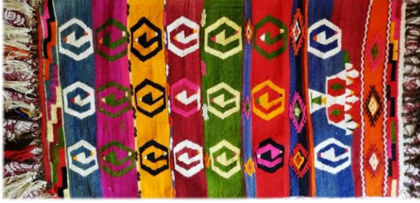
Fotoğraf 7. Yumrutaş mahallesinde bulunan namazlık örneđi

Çameli merkezde Hatice Ongun'un evinde bulunan namazlık, Ümmü Akman tarafından 1970 yılında dokunmuştur. 85 x 135 cm boyutlarında, çözgüsü pamuk, atkı ve desen ipi yündür. Cicim namazlık, enine bantlar halinde tasarlanmıştır. Eğri su, bıtırak, zincir, dört göz, kurdele, zincir, kaydırmacık, kurbağa dokumada görülen yanışlardır. Dokumada kullanılan renkler yeşil, turuncu, siyah, kahverengi, beyaz, mor, pembedir. Saçak boyu 15 cm'dir (Fotoğraf 6).