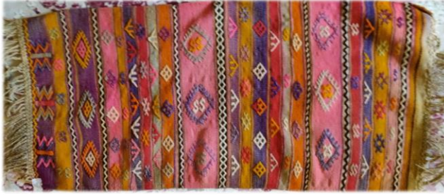
Fotoğraf 9. Cevizli mahallesinde bulunan namazlık örneği

Cevizli mahallesinde bulunan namazlık, Medine Hız tarafından 1960 yılında dokunmuştur. 58 x 105 cm boyutlarında, çözgü, atkı ve desen ipi yündür. Dokumanın saçak boyu 15 cm'dir. Enine bantlar halinde tasarlanmış, seyrek motifli cicim tekniği uygulanmıştır. Enine bantlar, bıtırak, bıtıracık, zincir, dörtgöz, eğri su, kaydırmacık, tavuk ayağı, kelebek, çakmak yanışları ile süslenmiştir. Pembe, yeşil, mavi, sarı, siyah, beyaz, mor dokumada kullanılan renklerdir (Fotoğraf 9).