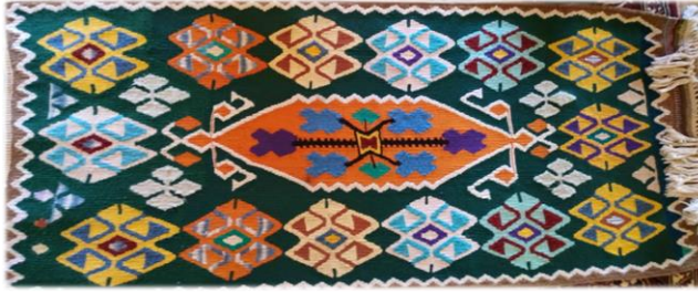
Fotoğraf 10. Kolak mahallesi camisinde bulunan namazlık örneği (Sultan Sökmen Arşivi, 2019)

Cevizli mahallesinde bulunan namazlık, Medine Hız tarafından 1960 yılında dokunmuştur. 58 x 105 cm boyutlarında, çözgü, atkı ve desen ipi yündür. Dokumanın saçak boyu 15 cm'dir. Enine bantlar halinde tasarlanmış, seyrek motifli cicim tekniği uygulanmıştır. Enine bantlar, bıtırak, bıtıracık, zincir, dörtgöz, eğri su, kaydırmacık, tavuk ayağı, kelebek, çakmak yanışları ile süslenmiştir. Pembe, yeşil, mavi, sarı, siyah, beyaz, mor dokumada kullanılan renklerdir (Fotoğraf 9).