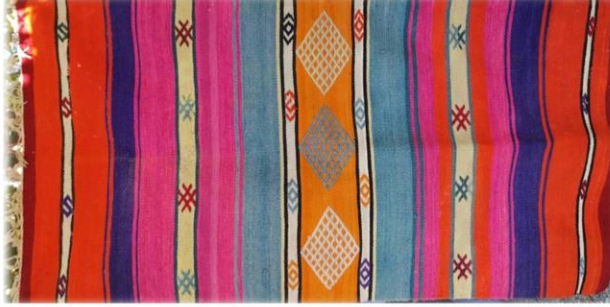
Fotoğraf 2. Yaylapınarı mahallesinde bulunan namazlık örneği

Çameli ilçesi Yaylapınarı mahallesinde bulunan namazlık, 1985 yılında Nesibe Bavuç tarafından yörede “düven” adı verilen mekikli tezgâhta dokunmuştur. 63 x 130 cm boyutlarında, çözgüsü pamuk, atkı ve desen ipi yündür. Enine bantlar halinde tasarlanmış, seyrek motifli cicim tekniği uygulanmıştır. Bitiracık, mekik, göz, çakmak yanışları ile süslenmiştir. Kırmızı, yeşil, pembe, mor, sarı, siyah, beyaz dokumada kullanılan renklerdir. Saçak boyu 8 cm’dir (Fotoğraf 2).