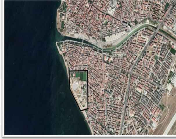
Görsel 2. Çanakkale Hamidiye Tabyaları Konumu.

Çanakkale Hamidiye Tabyası, Çanakkale Boğazı'na sıfır noktasında bulunmaktadır (Görsel 2, 3). Alana Cumhuriyet bulvarından ve Atatürk Caddesinden geçerek Aziziye Caddesi mevkiinde erişilmektedir. Ulaşım çift yönlü olarak yapılmaktadır.