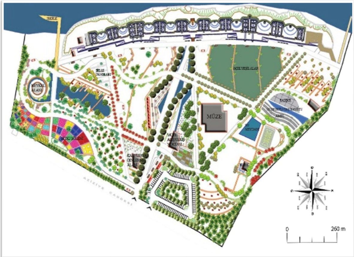
Görsel 4. Çanakkale Hamidiye Tabyaları Peyzaj Tasarım Projesi.

Alanda, tabyalara doğru giden bir ana aks tasarlanmıştır. Tasarlanan ana aks üzerinde, ziyaretçiler için alışveriş noktası oluşturulmuş ve alışveriş noktasının kuzeybatı yönüne doğru, tarihi eşyaların sergilendiği müze alanı konumlandırılmıştır. Müzenin kuzey yönünde küçük bir su meydanı tasarımı yapılmış olup su meydanının yanına geleneksel sporların yapıldığı (okçuluk, at biniciliği vb.) bir adet spor sahası düşünülmüştür. Alanın kuzeybatı kısmına gösteri mekânı olarak amfi tasarlanmıştır. Amfi içerisinde ise, su efektli taş havuz tasarımı yapılarak amfi ile sahne kısmı ayrılmıştır (Görsel 4, 5).