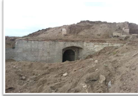
Restorasyon öncesi görünüm