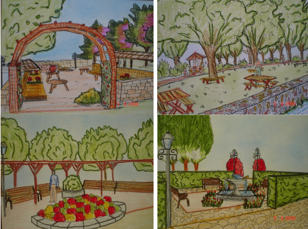
Görsel 5. Alandaki Hediyelik Eşya Satış Birimleri, Serbest Dinlenme Alanları ve Oturma Alanları ile Bitkisel Tasarımlardan Görünüm.

Alanın güneybatı yönünde, gelen ziyaretçilerin tabyaların tarihi konusunda bilgi alacakları, geçişi aksatmayacak şekilde oluşturulan bilgilendirme noktaları ve bilgi panoları konumlandırılmıştır. Alanda bilgi panoları ile bitki şöleni olarak adlandırdığımız alanların arasında geniş bir su alanı tasarımı yapılmıştır. Tasarlanan su alanının güney yönünde heykel alanı konumlandırılmıştır. Ayrıca alanda kuzeybatı ve güneybatı yönlerinde olmak üzere boğaza uzanan iki adet iskele tasarlanmıştır (Görsel 4).