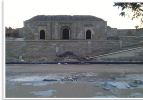
Restorasyon sonrası görünüm