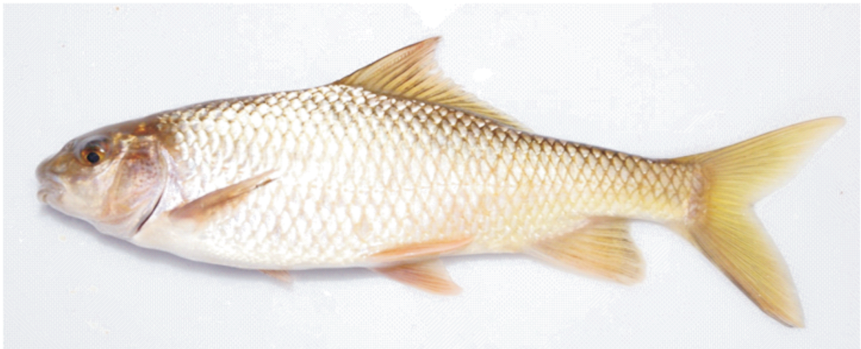
Şekil 2. Ziyaret çayında yakalanan Cyprinion macrostomum örneği.