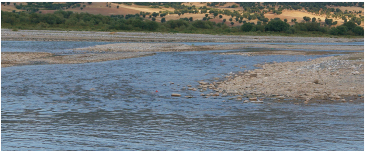
Şekil 4. Cyprinion macrostomum bireyelerinin yakalandığı Kahta Çayı, Doluca Köyü yakınlarından bir görünüm.