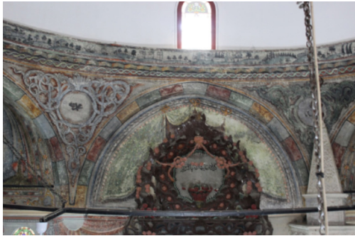
Resim-9: Koçarlı Cihanoğlu Camii Harim Güney Duvarı Süsleme Detayı.