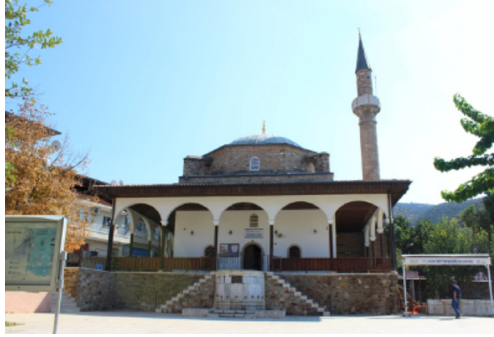
Resim-1: Koçarlı Cihanoğlu Camii Genel Görünüm.