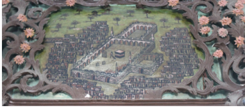
Resim-13: Koçarlı Cihanođlu Camii Mihrabı Süsleme Detayı.