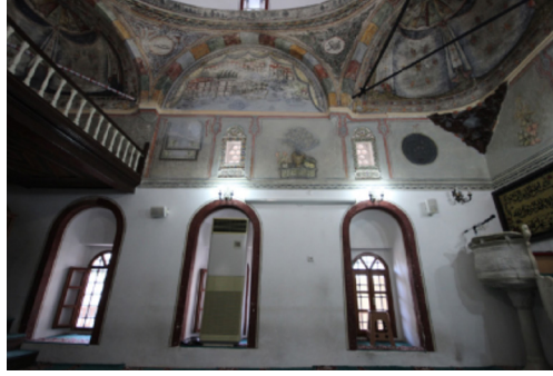
Resim-3: Koçarlı Cihanoğlu Camii Doğu Duvarı Süslemeleri.