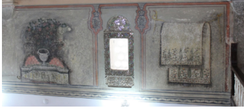
Resim-17: Koçarlı Cihanoğlu Camii Batı Duvarı Süsleme Detayı.