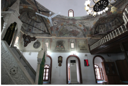
Resim-14: Koçarlı Cihanođlu Camii Harim Batı Duvarı.