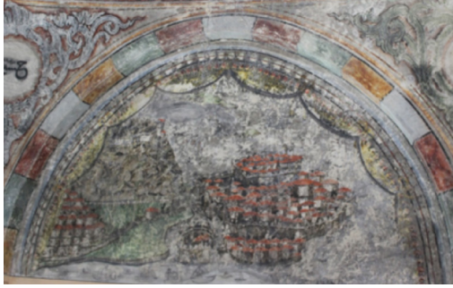
Resim-15: Koçarlı Cihanođlu Camii Batı Duvarı Süsleme Detayı.