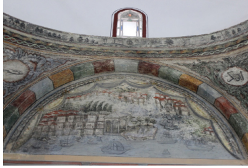
Resim-4: Koçarlı Cihanoğlu Camii Doğu Duvarı Süsleme Detayı.