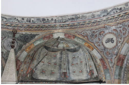
Resim-10: Koçarlı Cihanoğlu Camii Harim Güney Duvarı Süsleme Detayı.