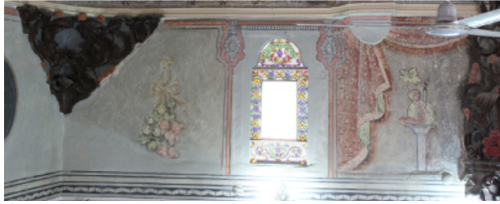
Resim-8: Koçarlı Cihanoğlu Camii Harim Güney Duvarı Süsleme Detayı.