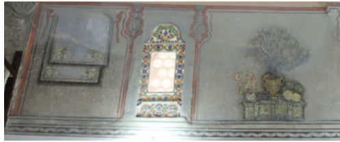
Resim-5: Koçarlı Cihanoğlu Camii Doğu Duvarı Süsleme Detayı.