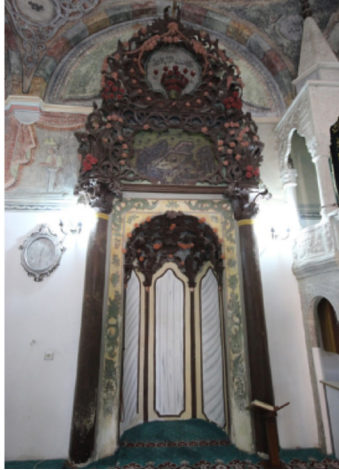
Resim-12: Koçarlı Cihanoğlu Camii Mihrabı.