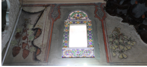
Resim-11: Koçarlı Cihanoğlu Camii Harim Güney Duvarı Süsleme Detayı.