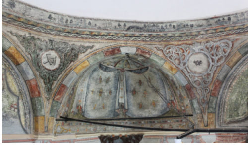
Resim-7: Koçarlı Cihanoğlu Camii Harim Güney Duvarı Süsleme Detayı.