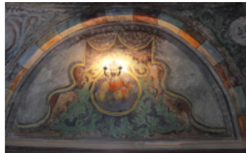
Resim-19-20: Koçarlı Cihanoğlu Camii Kuzey Duvarı Süsleme Detayı.