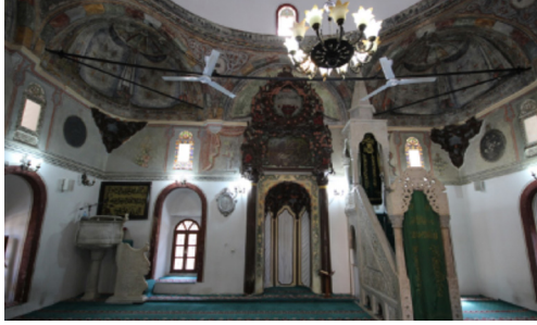
Resim-6: Koçarlı Cihanoğlu Camii Harim Güney Duvarı.