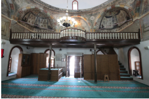
Resim-18: Koçarlı Cihanoğlu Camii Kuzey Duvarı ve Kadınlar Mahfili.