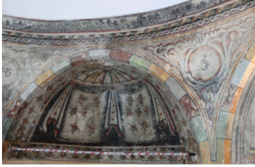
Resim-16: Koçarlı Cihanoğlu Camii Batı Duvarı Süsleme Detayı.