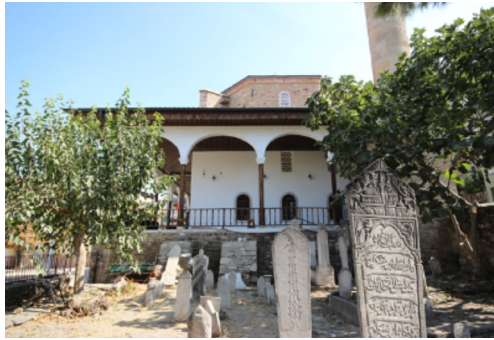
Resim-2: Koçarlı Cihanoğlu Camii Haziresi.