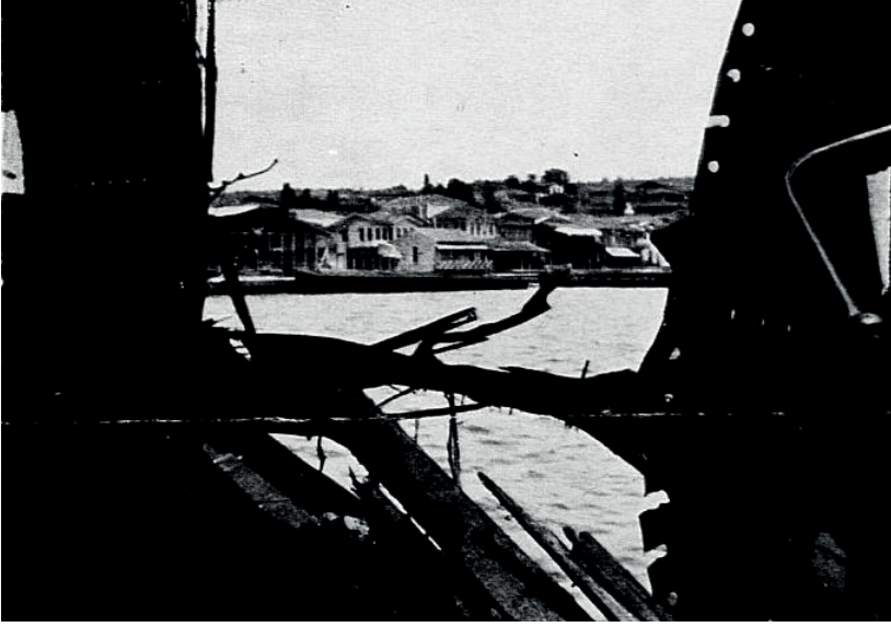
Ek-4. Alman-Osmanlı Sağlık Misyonu tarafından Zeynep Kamil Hastanesi yakınlarındaki bir Ermeni Okulu'nda yürütülen sağlık çalışmaları (Hasta Salonu).