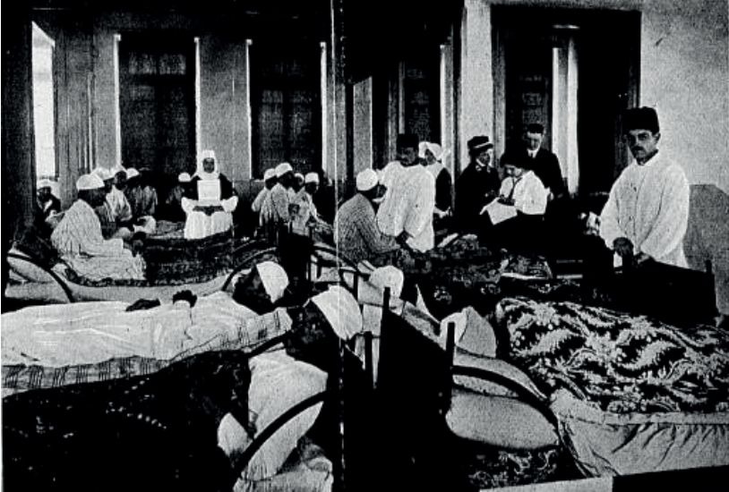
Kaynak (Ek 3-4): Leipziger-Illustrierten Zeitung, Nr. 3761, Leipzig, den 29. Juli 1915, s.146-147.