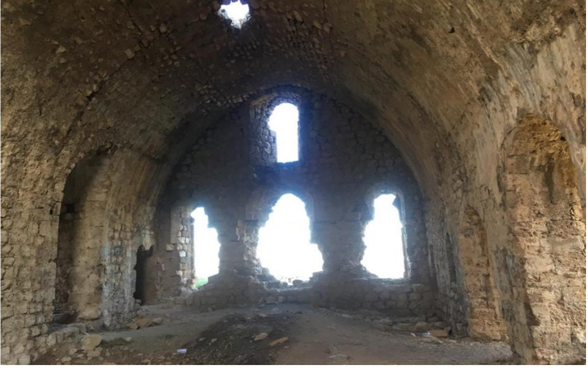
Resim 5: Salonun içten başka bir görüntüsü..