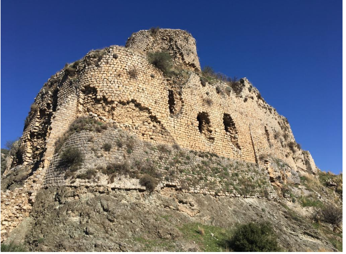
Resim 1: BaĖrâs Kalesi'nin dıştan görüntüsü