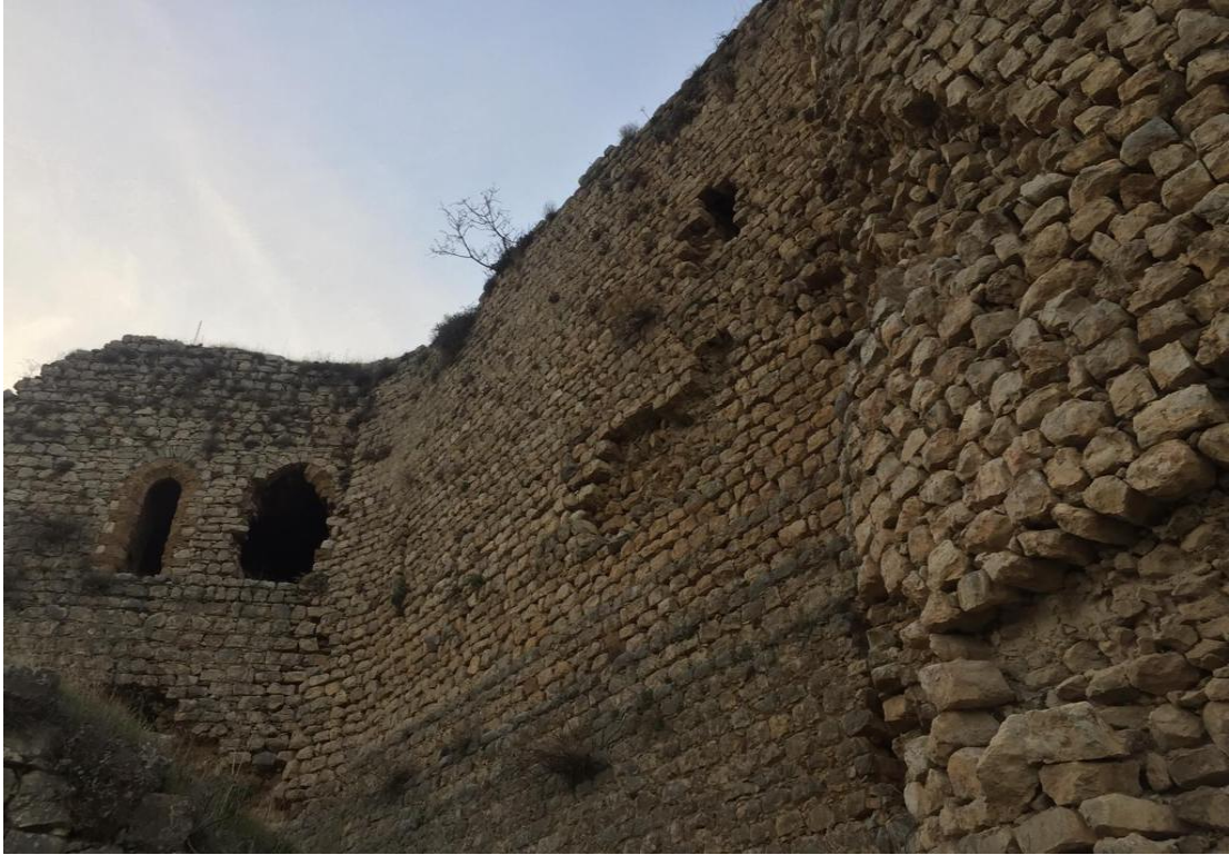
Resim 6: Kale duvarlarının dıştan görüntüsü.