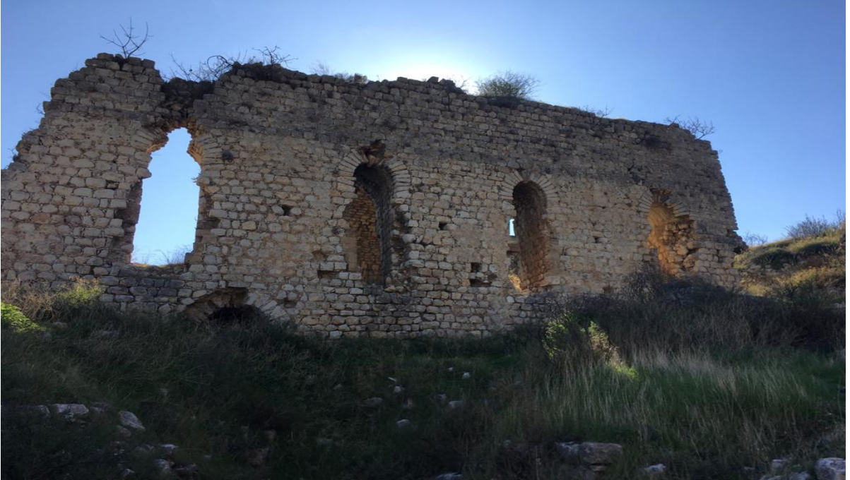
Resim 2: Tapınak Şövalyeleri döneminde inşa edilen şapel. (kendi arşivimden).