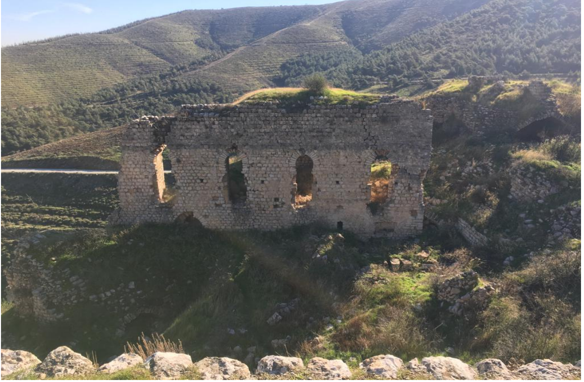
Resim 3: Şapelin kalenin tepesinden görüntüsü.