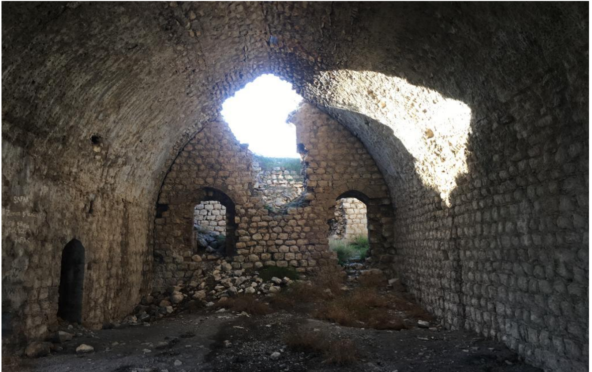
Resim 4: Kalenin salon bölümü. (kendi arşivimden).