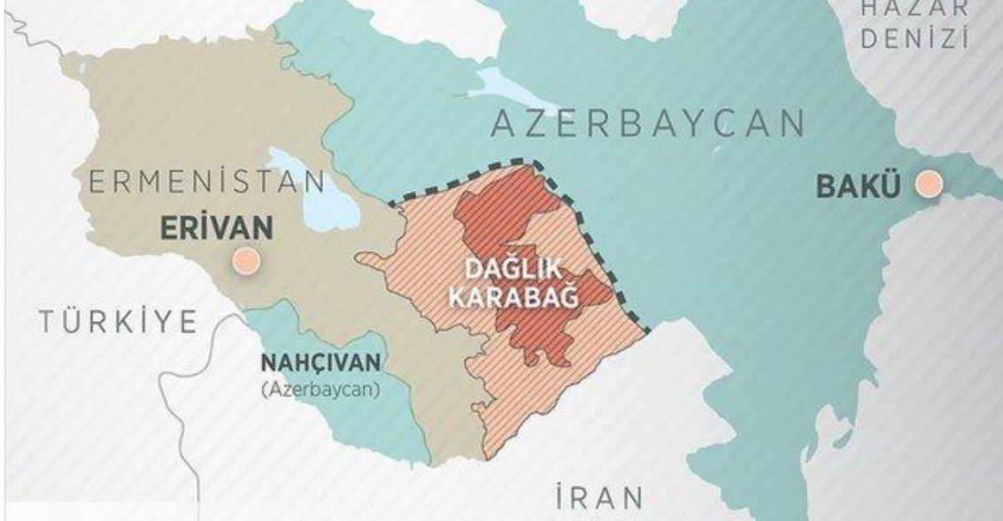
Harita 1: Dağlık Karabağ Bölgesi