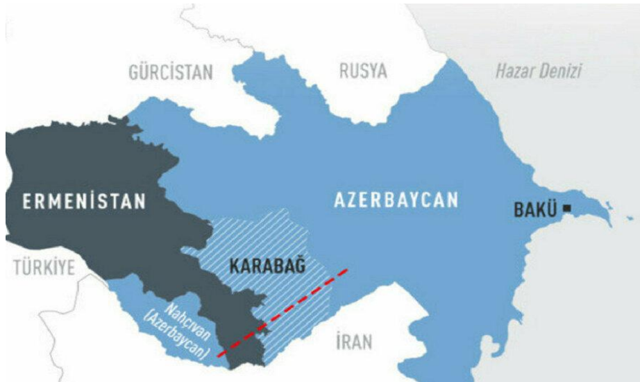
Harita 3: Zengezur (Nahçıvan) Koridoru