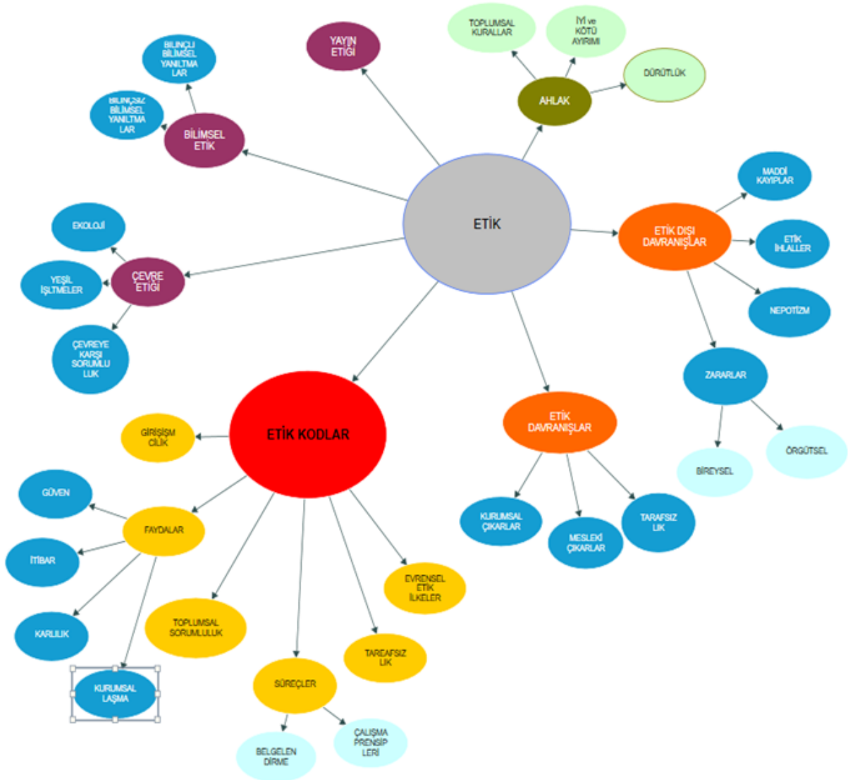
Şekil 2: Kavram Haritası

Şekil 2’de yer alan kavram haritası incelendiğinde “etik” kavramının “ahlak, yayın etiği, bilimsel etik, çevre etiği, etik davranışlar, etik dışı davranışlar ve etik kodlar” ile bağ kurduğu görülmektedir. Ford ve Richardson’a (1994) göre örgüt büyüklüğü ile etik algısı ve ahlaki değer yargıları arasında bir ilişki söz konusudur. Diğer pek çok araştırmada da etik ve ahlak kavramlarının birbirleriyle yakın ilişki içinde oldukları hatta birbirlerinin yerine kullanıldıkları ifade edilmektedir (Gül ve Gökçe, 2008: 379). Araştırmanın konusu olan etik kodlar detaylı olarak incelendiğinde “girişimcilik, faydalar, toplumsal sorumluluk, süreçler, tarafsızlık ve evrensel etik ilkeler” ifadelerinin “etik kodlar” çatısı altında yer aldığı görülmektedir. Daha detaya inildiğinde ise “faydalar” başlığı altında “güven, itibar, karlılık ve kurumsallaşma” ifadelerinin; “süreçler” başlığı altında ise “belgelendirme ve çalışma prensipleri” kavramlarının yer aldığı görülmektedir.