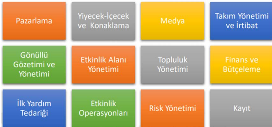
Şekil 1. Uluslararası spor organizasyonlarında gönüllülerin rolleri.

Spor organizasyonlarında görev alan gönüllülerin alabileceği görevler Şekil 1'de gösterilmiştir.