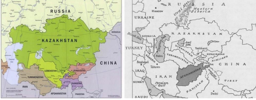
Şekil-1. "Klasik" Orta Asya Siyasi Haritası ve Afganistan Merkezli Orta Asya Haritası