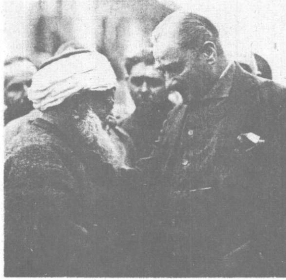
Resim 3: Amasya Müftüsü Kamil Efendi ve Atatürk 22 Kasım 1930

Millî Mücadelenin başlarında Mustafa Kemal Paşa'nın Amasyalı iki din adamı ile ilişkileri hakkındaki yukarıdaki malumat Mustafa Kemal, din ve din adamları arasındaki ilişkinin normal seyrini göstermektedir. 25