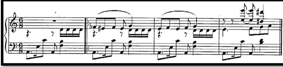
Şekil 4. Saray dansçılarının dansı

Akan kadın danslarının zarif sözleri "Saray dansçılarının dansı" (III perde).