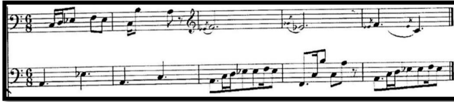
Şekil 1. Sahne saray zindanındaki monolog

Kara Karayev, yalnızca bir peri masalından bir karakter değil, aynı zamanda gerçekten var olan kötülüğün somutlaşmış biçimindeki sinsi tiran Vezir'in imajını ortaya çıkarmak için grotesk türünde genelleme yöntemini kullanır. İkinci perdenin ikinci sahnesinin tamamını Vezir tasvirine ayırmıştır (sahne saray zindanındaki bir monologdur). Bu resim iki bölümden oluşmaktadır: bir pandomim (vezir Şah'ın hazinelerine hayrandır) ve bestecinin azaltılmış ve büyütülmüş mod ve karpisli ritim unsurları kullandığı güç ve zenginlik için susuzluk dansı.