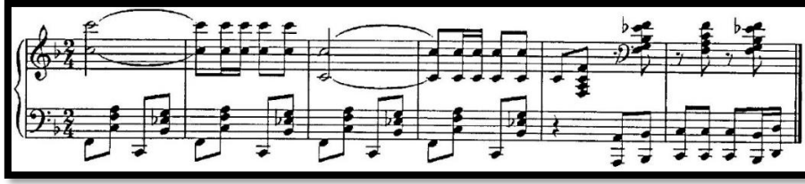
Şekil 3. "Cengi" halk dansı

Akan kadın danslarının zarif sözleri "Saray dansçılarının dansı" (III perde).