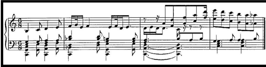
Şekil 5. Adagio

Balenin lirik-psikolojik çizgisi "Ayşe - Behram" çizgisidir. Bu lirik çizginin konusu düette somutlaştırılmıştır. İlk perdenin ikinci sahnesindeki kahramanların Adagio'su. Adagio'nun müziği, Karayev'in en etkileyici ve güzel örneklerinden biridir: