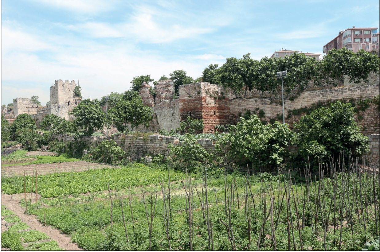
Fotoğraf 3: 2017’de İstanbul Kara Surları (Yazar tarafından 2017 yılında çekilmiştir). En arkadan öne doğru sırayla ana sur hattı, ağaçlar, dış sur kalıntıları, hendek duvarı kalıntıları ve en önde tarihi bostanlar görülmektedir. / A photo of the Istanbul Land Walls taken in 2017 by the author. From the back to the front, the main wall, trees, the remains of the outer wall, the moat, and the historic vegetable gardens are visible.

alanları gibi peyzajın diğer bileşenlerinin korunmasını da beraberinde getirmiştir. Bunlardan en kırılgan ve geçici karaktere sahip olan tarihi bostanlar, resmi miras söyleminde miras kategorisinde kabul edilmediğinden, koruma uzmanları ve sivil toplum ile alan yönetimi ve ilgili belediyeler arasında uzun tartışmalara konu olmuş, buna karşın 2013 yılından bu yana geçen süreçte tarihi bostanların korunmasına ilişkin paydaşlar arası veya toplumsal bir uzlaşmaya varılamamıştır.