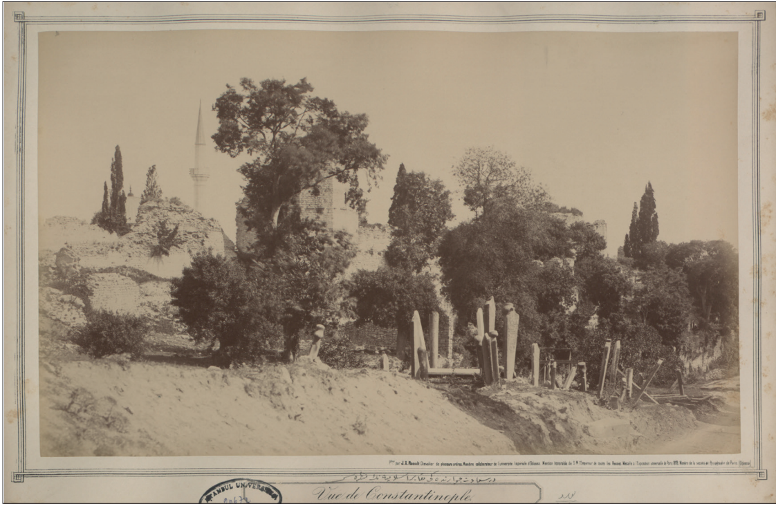
Fotoğraf 1: 19. yüzyılın sonlarında İstanbul Kara Surları'nın sur dışından görüntülediği bir tarihi fotoğraf (İstanbul Üniversitesi Nadir Eserler Kütüphanesi). En arkadan öne doğru cami kubbesi ve minaresi, ana sur duvarı ve kulesi, dış sur duvarı, ağaçlar ve mezarlık seçilebilmektedir. / A historical photograph of the Istanbul Land Walls from outside the walls in the late 19th century (Istanbul University Rare Works Library). From the back to the front, the mosque dome and the minaret, the main wall and towers, the outer wall, trees, and a cemetery are visible.