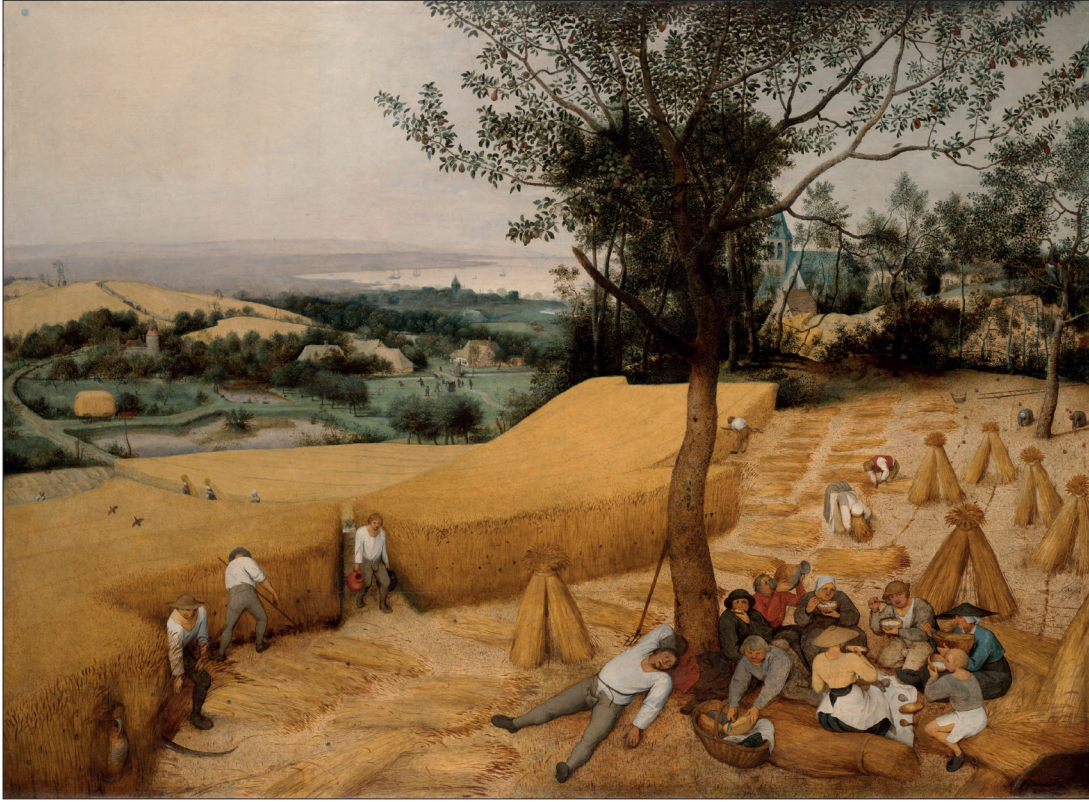
Şekil 2: Pieter Bruegel, Hasatçılar (The Harvesters), 1565 (Kaynak: https://upload.wikimedia.org/wikipedia/commons/1/13/The_Harvesters.jpg ). / Pieter Bruegel, The Harvesters, 1565 (Source: https://upload.wikimedia.org/wikipedia/commons/1/13/The_Harvesters.jpg ).

Buna karşın, içkin düzen, Bohm'un (2005) kuantum fiziğine getirdiği yorumla, bileşenlerin –birbirleri arasındaki mesafeye bakılmaksızın- tümünün içkin olarak birbirleriyle ilişkilerinin olduğu ve bütünü her bir parçasının bütünü bilgisiyle sarmalanmış olduğu bir düzeni ifade eder. Bu bakışla peyzaj öğelerinin her biri, birbirlerine yakınlıkları/uzaklıkları ya da fiziksel konum ve ilişkilerinden bağımsız olarak birbirleriyle ilişkilidir, birbirlerinin bilgisini içerir ve kapsar.