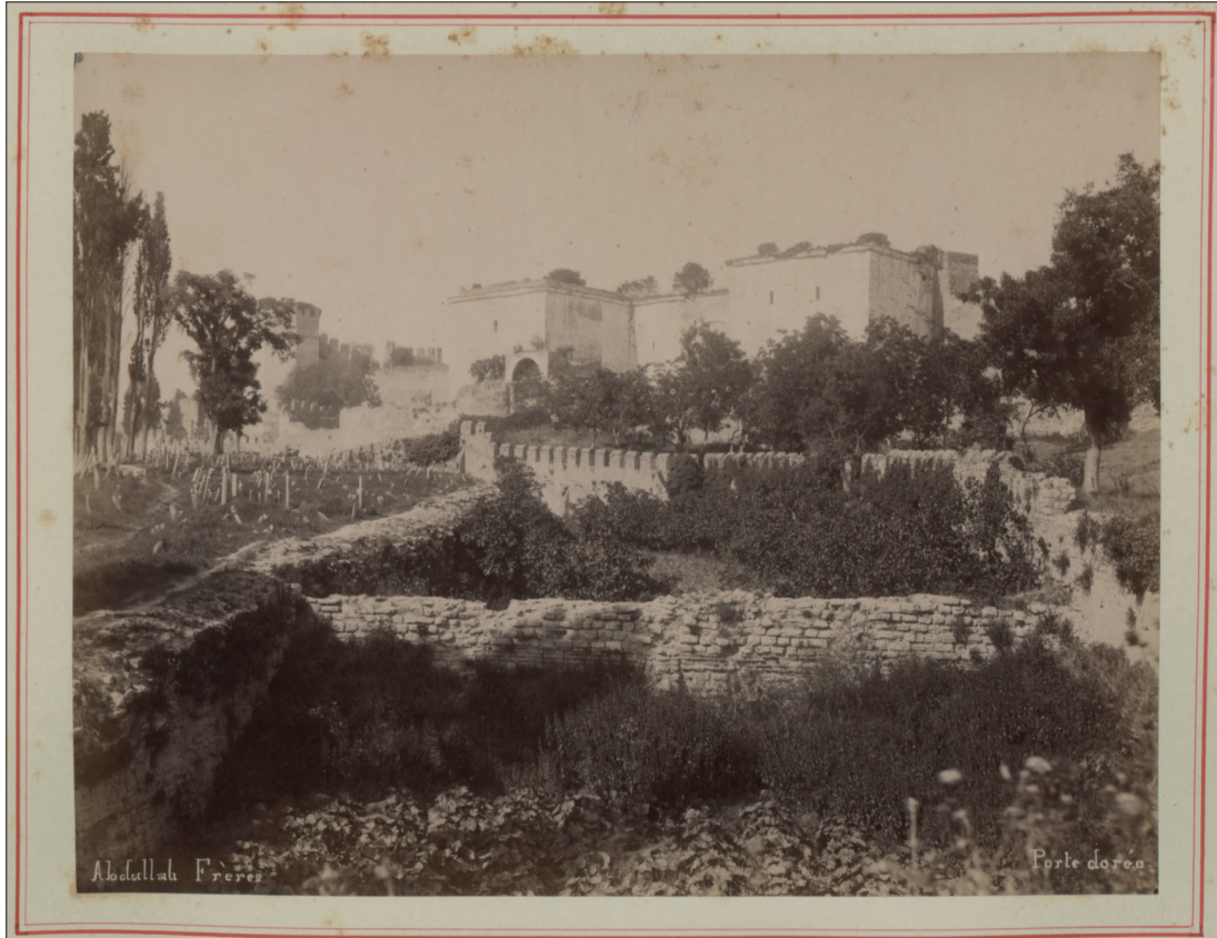
Fotoğraf 2: 19. yüzyılın sonlarında İstanbul Kara Surları üzerindeki Altın Kapı'nın sur dışından görüntülediği bir tarihi fotoğraf. En arkadan öne doğru Altın Kapı, ağaçlar, hendek ve içinde bostanlar ve solda mezarlık görülmektedir. / A historical photograph of the Golden Gate on the Land Walls of Istanbul in the late 19th century. From the back to the front, the Golden Gate, trees, the moat, and the historic vegetable gardens are visible. A part of a cemetery is seen on the left.