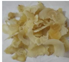
Resim 1: Kitre (Geven) (A. Şenel, 2020)

Ebrû-sabır ilişkisinin önemli aşamalarından birini malzemelerin hazırlanması oluşturur. Geven bitkisinden elde edilen ve adına kitre denilen kurutulmuş bitki özü (Resim 1) ıslatılır. Birkaç gün ara ara yoğrulur, sonra bez torbalardan süzülür. Bu işleme “kitre sıkma” denir. Pürüzsüz, homojen bir sıvı elde edilinceye kadar sıkma işlemi tekrarlanır.