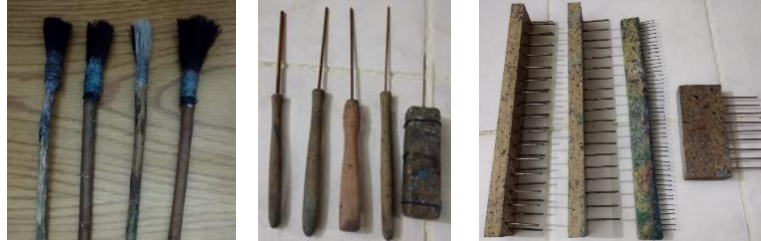
Resim 3: Fırçalar, Bizler, Taraklar (A. Şenel, 2020)

Bir başka ebrû malzemesi fırçadır. Fırçalar, at kuyruğundan elde edilen kılların gül dalına sarılmasıyla hazırlanır. At kuyruğu ıslandığında, kılları birbirine yapışmaz, böylece boyalar istenilen biçimde tekneye serpilebilir. Gül dalı da esnek oluşundan dolayı tercih edilir. Tekneye serpilmiş boyalara şekil vermek için biz ve tarak denilen malzemeler kullanılır (Resim 3).