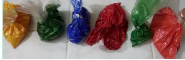
Resim 2: Muhtelif Renklerde Toz Boyalar (A. Şenel, 2020)

Günümüzde boyaları ezilmiş olarak temin etmek de mümkün olmaktadır. Ancak kitrede olduğu gibi boyalarda da hazır malzeme kullanmanın sabır öğrenimine bir katkısı yoktur.