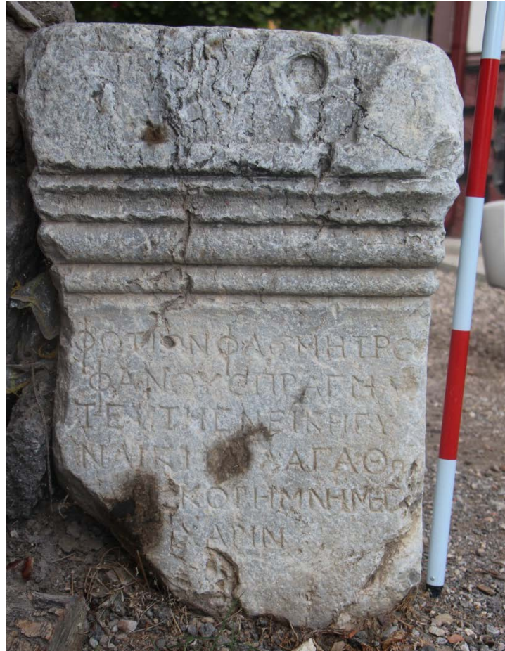
Ek 8. Çimşit köyü, yazıt (Mitchell, 1982, no. 182).