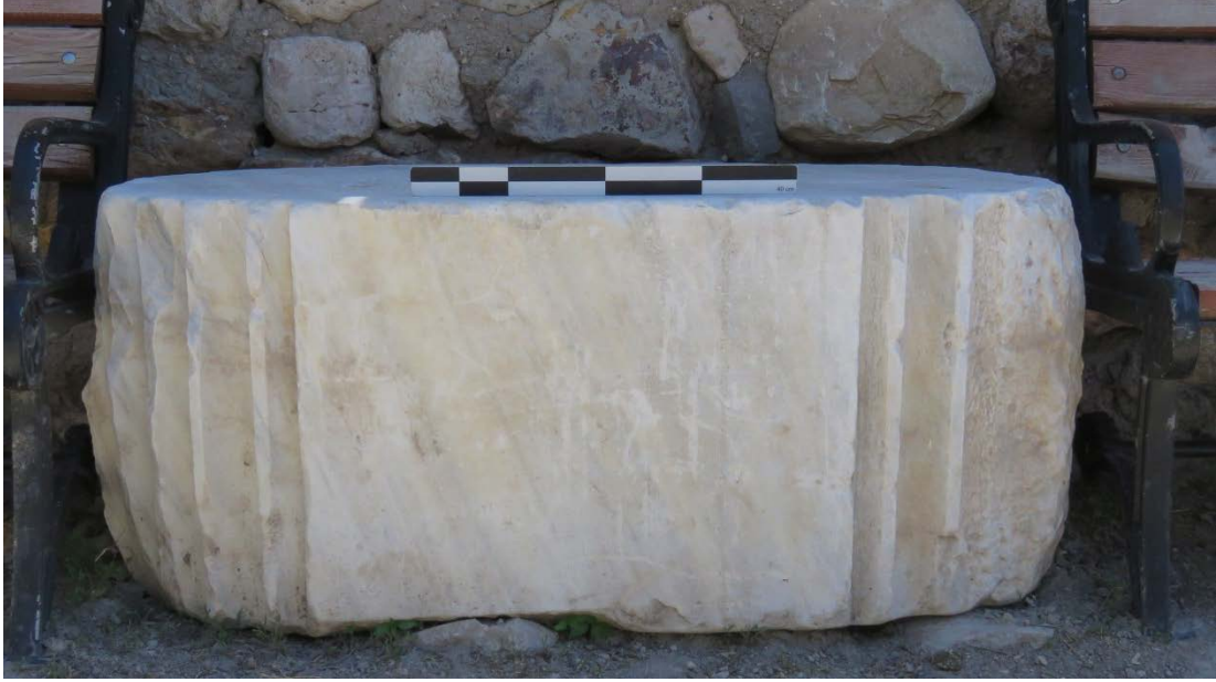
Ek 4. Karalar Köyü içinde tespit edilen mermer çift sütun plaster.