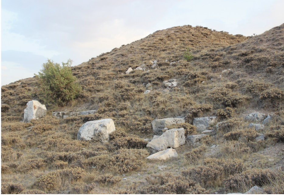
Ek 6. İkiztepe B tümülüsünün 1933 yılındaki ve günümüzdeki hâli (Arık 1933, 133, şekil 30).