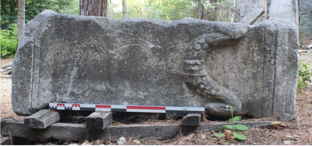
Ek 11. Örencik Köyü eski okul bahçesinde duran sunak.