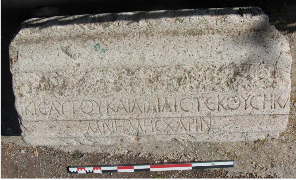
Ek 7. Emirgazi köyü, yazıt (Mitchell, 1982, no. 185).