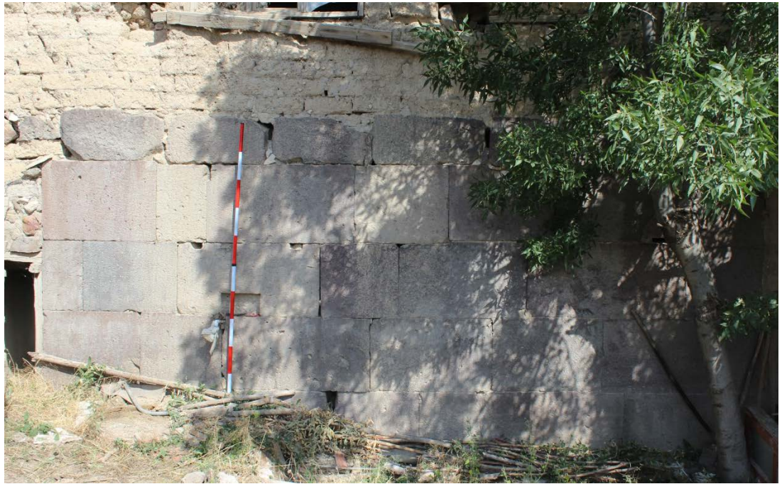
Ek 5. Karalar Köyü içinde tespit edilmiş Hellenistik duvar.