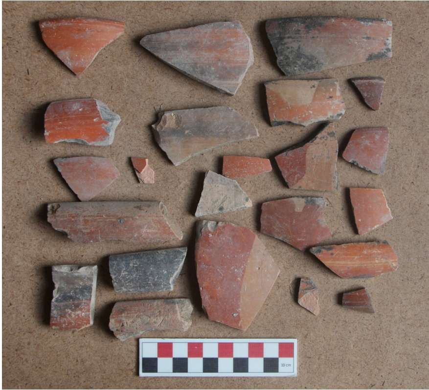
Ek 3. Karalar Asarkaya civarında tespit edilmiş seramik buluntular.