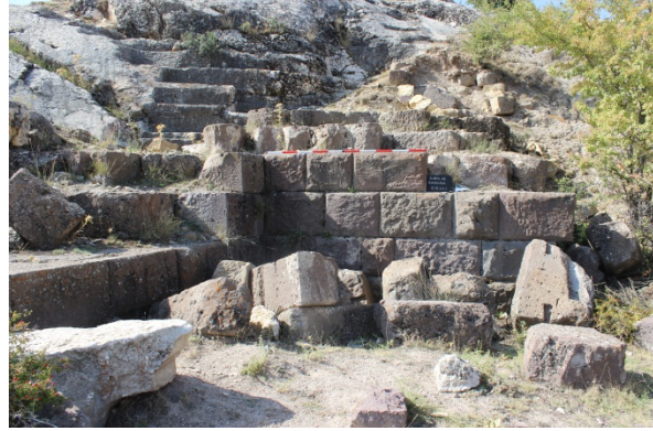
Ek 2. Karalar Asarkaya Hellenistik duvar.