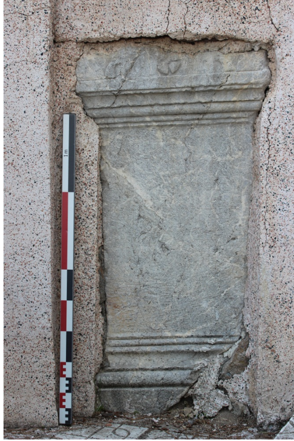
Ek 12. Güvenç Köyü camii duvarında yer alan Sunak.