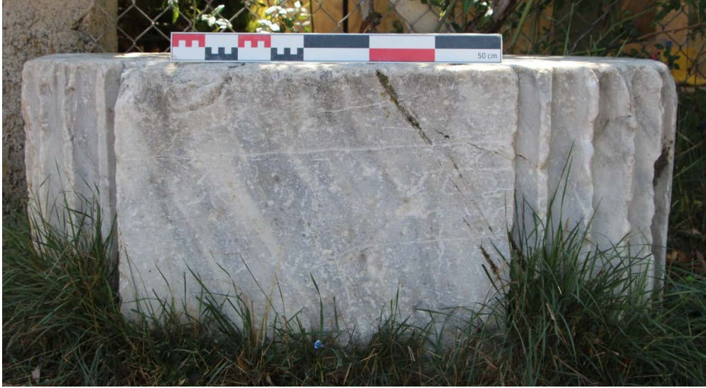
Ek 9. Bitik köyü, mermer çift sütun plaster.