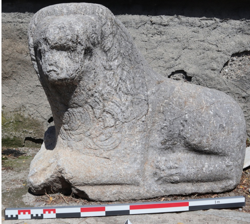
Ek 10. Bitik Köyü, Aslan heykeli.