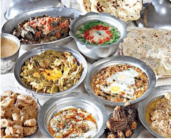
Şekil 12. Balkan Mutfağına ait yöresel lezzetler

Akdeniz Mutfaklarından esinlenen Balkan Mutfağında genellikle hamur işi ve et yemekleri ön plandadır.