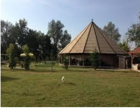
Şekil 7. Neris Kır Bahçesi, Konuralp.

Zuhal'in Yeri: Konuralp Atlı Kemer'de yer alan işletmede yöresel köy kahvaltısı, Konuralp Bölgesinin yöresel tatları ile Kasaba Pirinci ile yapılan Yufkalı Konuralp Pilavı yerli ve yabancı turistlerin deneyimlemesi için faaliyet gösteren bir aile işletmesidir.