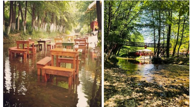
Şekil 6b. Eye A Eko Turizm Çiftliği, Konuralp.

Yürüyüş parkuru, yöresel yemek tadımı ve konaklama imkanı ile özellikle yaz aylarında ekoturistlerin uğrak mekanları arasında yer almaktadır.