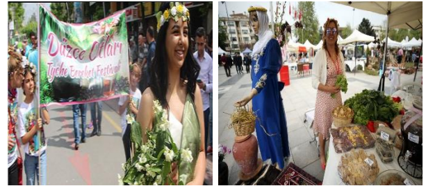
Şekil 17. Düzce Otları Tyche Bereket Festivali

Her yıl düzenlenen Düzce Otları Tyche Bereket Festivali'nin yanı sıra 2018 yılı itibarıyla de bölgede yetişen Balkabağından yapılan lezzetlerin sergilendiği "Düzce Kabağı Lezzet Şenliği" 2019 yılından itibaren "Düzce Kabak ve Kestane Festivali" adıyla düzenlenerek yöreye ait ürünlerin tanıtımı gerçekleştirilmektedir. Düzce Valiliği, Düzce Belediyesi, Düzce Üniversitesi ve Kent Konseyi Kadın Meclisi iş birliği düzenlenen festivallerde balkabağından yapılan yiyecekler sergileniştir. Aynı zamanda yemek yarışmasının da düzenlendiği