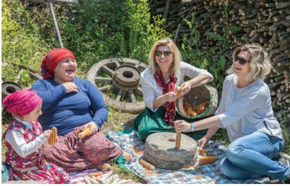
Şekil 5a. Kemerkasım, Konuralp.

Kemerkasım Düzce'nin merkeze bağlı Konuralp mahallesindedir.