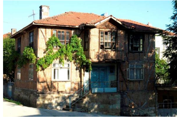
Şekil 9. Dadalı Köyü, Akçakoca.

Dadalı Köyü: Tarihi dokusu ile Akçakoca'nın en eski köylerinden biri olan Dadalı Köyü genellikle Manav Türkleri'nin yaşadığı bir köydür. Doğu Marmara Kalkınma Ajansı (MARKA)'dan destek alarak Türkiye çapında ekoköy turizmüne model olan Dadalı Köyü'nde özellikle kadınlar ön plandadır.