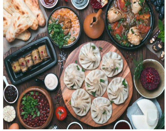
Şekil 14. Gürcü Mutfağına ait yöresel lezzetler

Ağırlıklı olarak et ve et yemeklerinin yer aldığı Çerkes Mutfağı'nda bir çok yemeğe bal katılmaktadır. Çerkes yemeklerinde haşlanmış, kurutulmuş, fırınlanmış et yemekleri ön plana çıkmıştır.