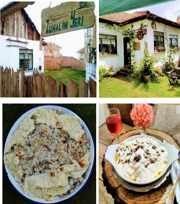
Şekil 8. Zuhal'in Yeri, Konuralp.

Zuhal'in Yeri: Konuralp Atlı Kemer'de yer alan işletmede yöresel köy kahvaltısı, Konuralp Bölgesinin yöresel tatları ile Kasaba Pirinci ile yapılan Yufkalı Konuralp Pilavı yerli ve yabancı turistlerin deneyimlemesi için faaliyet gösteren bir aile işletmesidir.