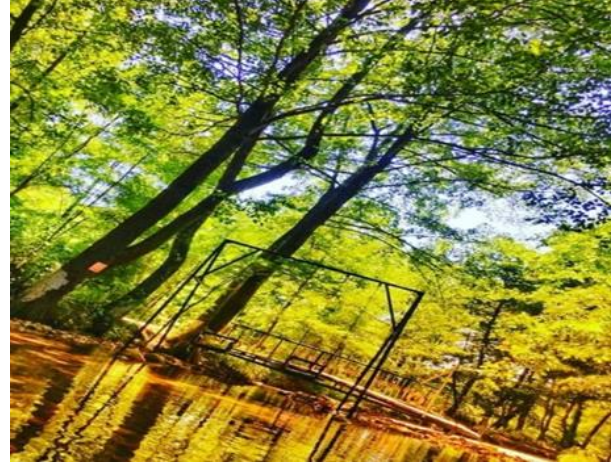
Şekil 6a. Eye A Eko Turizm Çiftliği, Konuralp.

Eye A Eko Turizm Çiftliği (Sessiz Bahçe): "Konuralp Dünya Turizm Destinasyonu Oluyor" Projesi kapsamında Düzce Valiliği, Belediye Başkanlığı, İl Özel İdaresi, Turizm Müdürlüğü ve KOSGEB'in desteği ile hayata geçen Eye A Eko Turizm Çiftliği'nde konaklama ve restorasyon faaliyetleri yer almaktadır.