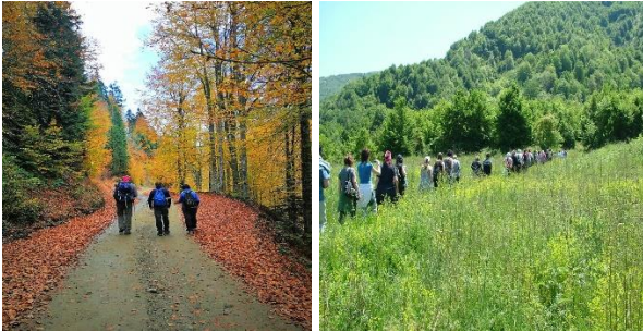
Şekil 3. Düzce yürüyüş parkurlarından örnekler. (URL-1)

Düzce ilinde; Akçakoca, Cumayeri, Çilimli, Gümüşova, Gölyaka, Kaynaşlı, Yiğilca ve İl Merkezi olmak üzere toplamda 330 km'lik 23 yürüyüş parkuru bulunmaktadır. Şelale, mağara ve yayla gibi farklı doğal alanların içlerinde yer alan yürüyüş parkurlarında; trekking, olta balıkçılığı, safari, çadır ve karavan kampçılığı gibi etkinliklerin yapılabildiği alanlar yer almaktadır (URL-6).