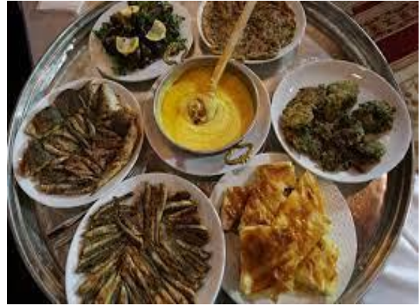
Şekil 15. Karadeniz Mutfağına ait yöresel lezzetler

Sebze yemekleriyle ön plana çıkan mutfakta patlıcan, pırasa, lahananın yanı sıra mısır ve ceviz de sıklıkla yer almaktadır. Beyaz etin de kullanıldığı Gürcü Mutfağında tavuk ile yapılan tüm yemeklerde ceviz ya da cevizli soslar kullanılmaktadır.