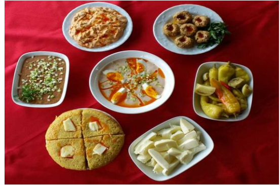
Şekil 11. Abhaz Mutfağına ait yöresel lezzetler

2019 yılında Düzce valiliği, Düzce Belediyesi ve İl kültür ve Turizm Müdürlüğüne hazırlanan "Kültürel Çeşitliliği ile Düzce" adlı kitapta Düzce ilinde yaşayan Abhaz, Balkan, Çerkez, Gürcü, Karadeniz, Kırım Türkleri, Manav ve Roman Kültürüne ait yemeklerin yanı sıra Düzce'ye özgü yemeklerin de yer aldığı bir eserdir. Eserde Abhaz mutfağına ait 11, Balkan Türkleri mutfağına ait 9, Çerkez mutfağına ait 15, Gürcü mutfağına ait 13, Karadeniz mutfağına ait 23, Kırım Türklerine ait 5, Manav Türkleri mutfağına ait 18, Roman mutfağına ait 9 ve Düzce'nin farklı lezzetlerinden oluşan 20 yemeğin tanıtımına yer verilmiştir.