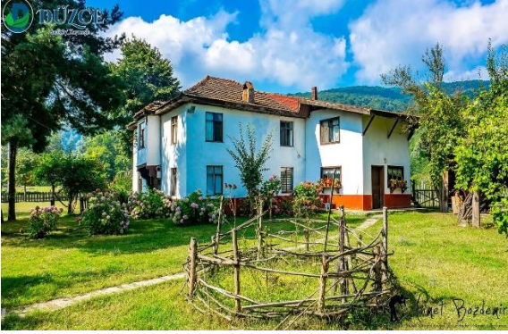
Şekil 10a. Saz Köy, Kaynaşlı.

Köy içerisinde bulunan trekking alanları, çadır ve karavan alanları da ekoturistler için konaklamalı ya da günübirlik turizm için farklı seçenekler sunmaktadır.