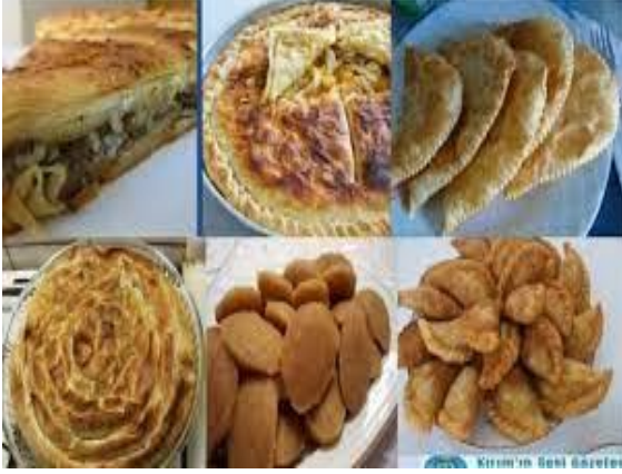
Şekil 16. KırımTürkleri Mutfağına ait yöresel lezzetler

Geleneklerini günümüze kadar taşımayı başaran Kırım Türklerine ait mutfakta özellikle hamur işleri ön plandadır. Tarih boyunca tarım ve hayvancılıkla uğraştıkları için yemek kültürlerine de yaşam şekillerini yansıtmışlardır.