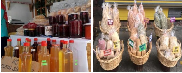
Şekil 2. Tarihi Mahalle Pazarı, Düzce.

Düzce ilinde; Akçakoca, Cumayeri, Çilimli, Gümüşova, Gölyaka, Kaynaşlı, Yiğilca ve İl Merkezi olmak üzere toplamda 330 km'lik 23 yürüyüş parkuru bulunmaktadır. Şelale, mağara ve yayla gibi farklı doğal alanların içlerinde yer alan yürüyüş parkurlarında; trekking, olta balıkçılığı, safari, çadır ve karavan kampçılığı gibi etkinliklerin yapılabildiği alanlar yer almaktadır (URL-6).