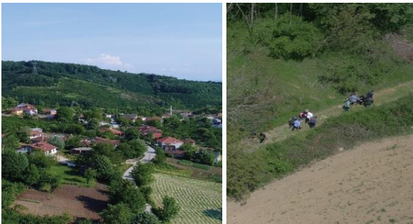
Şekil 5b. Kemerkasım, Konuralp.

Kemerkasım 'da ekoturistler, kendi topladıkları meyve ve sebzeleri köylüler ile birlikte işleyebileceği gibi bu ürünlerden doğal ve katkısız sirke, turşu ve reçel yaparak da keyifli bir zaman geçirebilmektedirler. Ayrıca bölgede mevsimine bağlı olarak fındık bahçelerinden fındık toplayabilecekleri, el değirmeninde mısır çekimi gibi farklı aktivitelerin de yapılabildiği bir alandır.