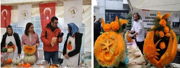
Şekil 18. Düzce Kabağı Lezzet Şenliği

festivalde Düzce'nin tescil edilmiş markaları da tanıtılmıştır.