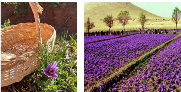
Şekil 4. Kaynaşlı Çakırsayvan Köyü.

Ayrıca endemik bitkilerin de yer aldığı Düzce'nin Kaynaşlı ilçesinde özellikle sonbahar aylarında toplanan Safran bitkisinin toplanması için bölgeye gününbirlik turlar düzenlenerek yerli turistlerin safran hasadı yapması sağlanabilir ve sonrasında bölgede doğa yürüyüşleriyle de desteklenebilir.