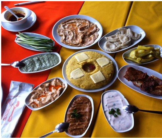
Şekil 13. Çerkes Mutfağına ait yöresel lezzetler

Akdeniz Mutfaklarından esinlenen Balkan Mutfağında genellikle hamur işi ve et yemekleri ön plandadır.