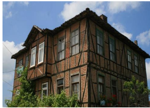
Şekil 1. Dadalı Köyü Akçakoca, Düzce.

Düzce ilinde ekoturizm alanları oldukça geniş bir yer kaplamaktadır. Bozulmamış bir doğaya sahip olan ve organik tarımın yapıldığı Düzce'nin Akçakoca ilçesindeki Dadalı köy, ekoköy örneğidir. Doğu Marmara Kalkınma Ajansı (MARKA)'dan destek alarak Türkiye çapında model köy olmuş, ekoköy turizmüne örnektir (Şekil 1.).