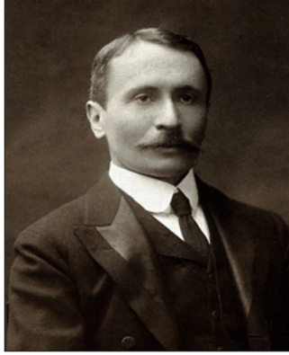
Ek 1. Sir Aurel Stein