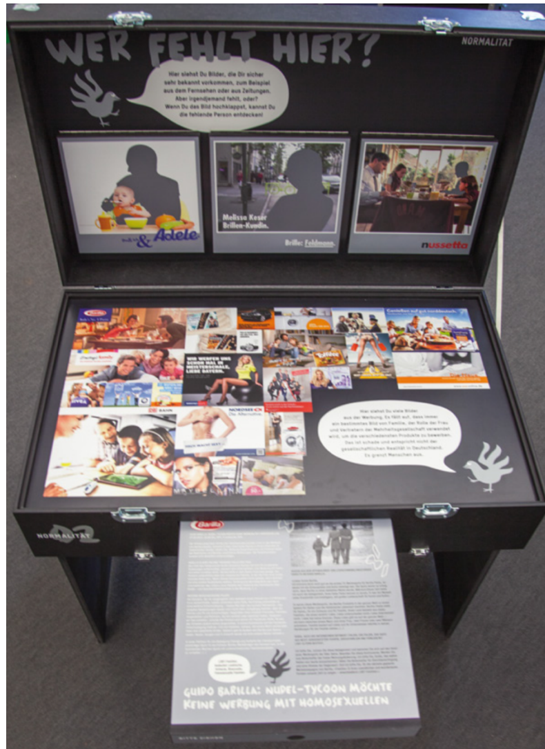
Abb. 5: Station Schublade mit Titelbildern

Das dritte Beispiel bringt eine kritische Auseinandersetzung mit medialer Berichterstattung und der Werbesprache zum Vorschein. Werbungen im Fernsehen oder im Internet, in Zeitschriften oder Zeitungen beeinträchtigen die Denkweise und Wahrnehmung der Einzelnen und ganzer Kollektive stark. Demnach werden verschiedene Werbungen aufgezeigt und die Frage in die Mitte des Diskurses gestellt: Inwieweit ist die Werbung als diskriminierend zu verstehen? In der Station geht es weniger um die Auseinandersetzung mit verschiedenen Marken oder Firmen und inwiefern sie Diskriminierung ausüben, sondern vielmehr um die Tatsache, dass (un)bewusst oder (un)bedacht diskriminierende Werbesprache vorzufinden ist und ebenso verwendet wird. Ob die Firmen oder Marken eine Diskriminierung ausüben, ist der Diskussion ausgeschlossen. Der Fokus liegt auf dem Akt der Wahrnehmung von verschiedenen Formen der Diskriminierung.