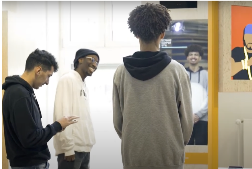
Abb. 4: Jugendlicher (rechts) vor einem Bodyscanner

In einer weiteren Station werden in einer Schublade Titelbilder von Illustrierten gezeigt, die eine satirische Art der diskriminierenden Praxis nachweisen.