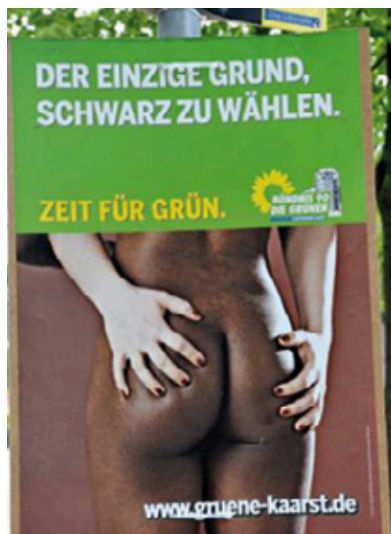
Abb. 6: Wahlplakat der Grünen