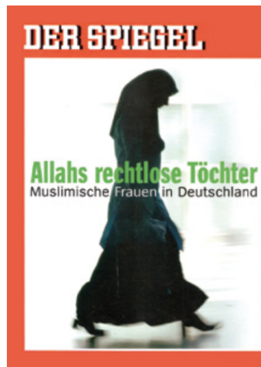
Abb. 7: Coverbild der Zeitschrift Der Spiegel