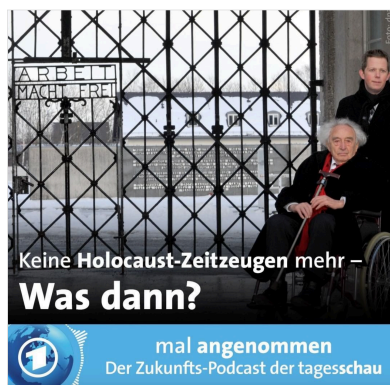
Abb. 1: ARD Zukunfts-podcast über die Holocaust-Zeitzeugen

Ausgangspunkt des ganzen Vorhabens ist nämlich die Befürchtung, dass einerseits die Erinnerung an den Holocaust verloren gehen könnte und andererseits die Gefahr besteht, dass, wenn es immerhin noch Bestrebungen der Aufrechterhaltung an die Erinnerungen gibt, der emotionale Bezug nicht so stark ist wie bei einem realen Holocaust-Zeitzeugen, wenn diese ihre eigene Geschichte erzählen. Letztere wäre nämlich Geschichte aus erster Quelle und der/ die berichtende Erzähler/in – also ein Holocaust-Zeitzeuge – die personifizierte Geschichte höchstpersönlich.