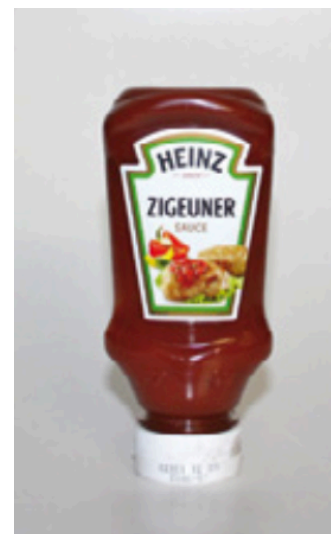
Abb. 8: Etikett der Heinz Ketchup

Hier in Abbildung 6, 7 und 8 sind verschiedene Formen von Werbesprache vorgeführt, die das Nachdenken und Hinterfragen anregen sollen, ob es diskriminierende Wirkungen hat.